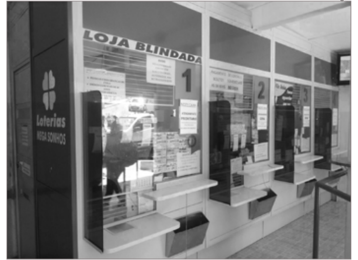
Há dois anos proprietário blindou a loja para evitar assaltos

De acordo com a polícia, os autores já estavam sendo rastreados por assaltar um supermercado em Amarantina, antes da tentativa na lotérica. Desta forma a polícia já fazia o cerco na rodovia para prender os bandidos. Durante a perseguição na BR-356, no sentido Itabirito, os bandidos não atenderam a ordem de parada da PM e abriram fogo contra os militares. Os policiais revidaram os disparos e os dois caíram da moto após serem baleados. Um dos criminosos levou um tiro na perna e o menor foi baleado no pé. Os dois foram socorridos pelos militares e levados para a UPA de Itabirito. Todos dois têm passagem pela polícia, um deles por suspeita de homicídio.