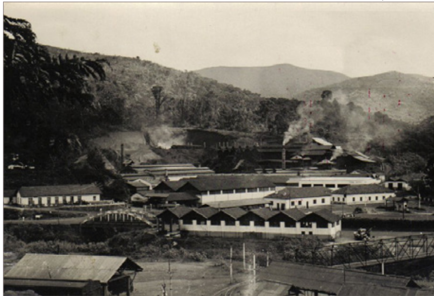
VDL quando ainda era Usina Esperança