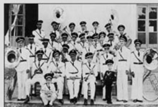
Banda de música "A Alma da Comunidade"

O evento "Roléunião", promovido pela Associação de Skatistas de Ouro Preto (ASKOP) foi reagendado para o dia 19 de setembro, a partir das 13h, na quadra do Colégio Estadual da Bauxita. Na segunda-feira (21), ocorrerá na Câmara Municipal uma Audiência Pública para debater as Políticas Públicas da Secretaria de Esporte e Lazer para os esportes radicais, como o skate.