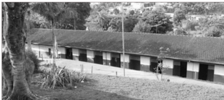
A Escola Estadual Padre Afonso de Lemos convida a comunidade escolar para as apresentações dos alunos pela "Virada da Educação", que constitui-se um momento de encontro e celebração, cujo objetivo é somar esforços e pensar coletivamente como podemos avançar na Educação, aproximando a escola do universo jovem, dia 19 de Setembro, sábado, às 08 horas.