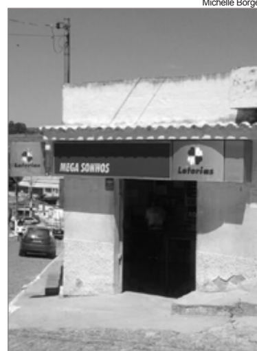
A partir de novembro o espaço irá funcionar em novo endereço