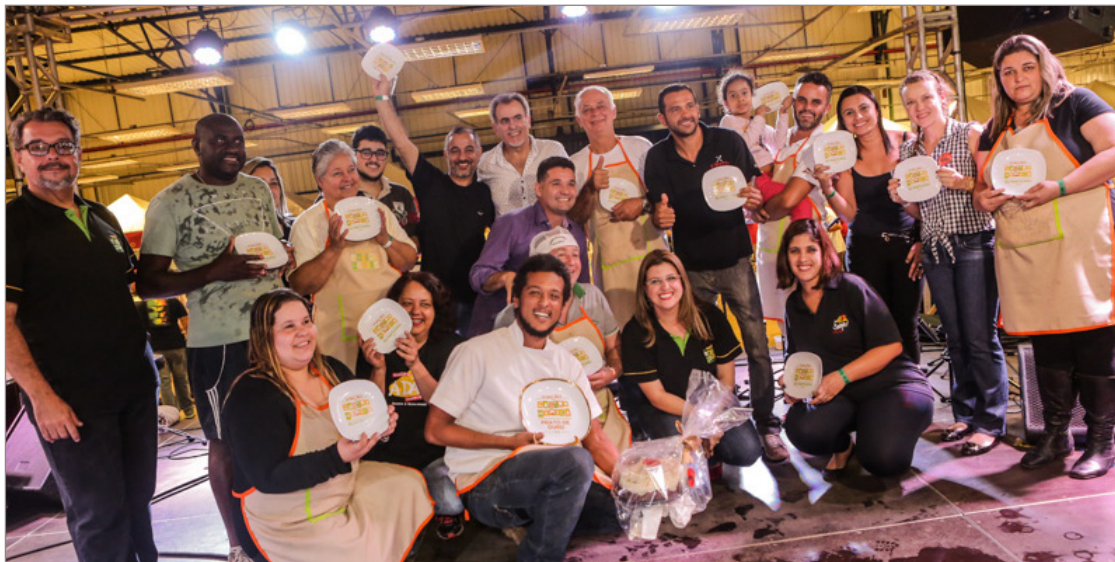
Casa de Pedra Forneria foi a campeã deste ano

A Casa de Pedra concorreu com o prato Menina Caipira.