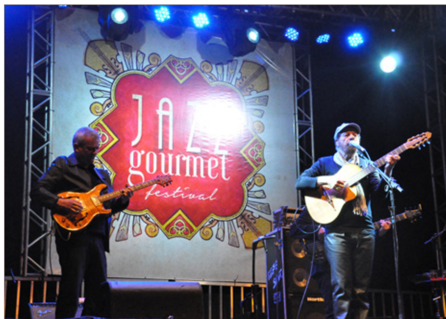
O músico interpretou canções clássicas, como “O bêbado e o equilibrista”, “Quando o amor acontece” e “Incompatibilidade de gênios”