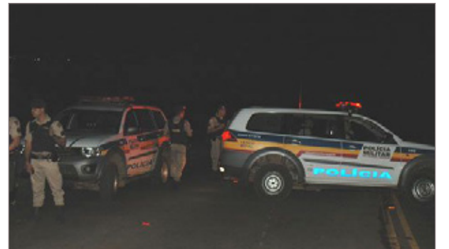
Os dois sentidos da estrada foi bloqueada, o que gerou uma fila de cinco quilômetros