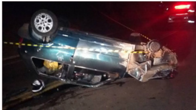
Durante a perseguição policial, o carro conduzido pelos suspeitos capotou na rodovia MG-262