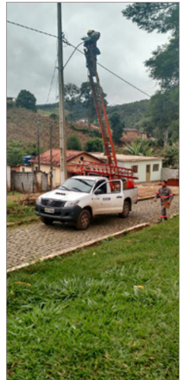
Cimvalpi (Consórcio Intermunicipal Multisetorial do Vale do Piranga) troca lâmpada no distrito de Santa Rita de Ouro Preto

Se houver alguma lâmpada queimada na sua rua ou bairro, solicite a troca pelo telefone 0800 283 1020. O atendente irá registrar sua chamada e retornar a ligação logo em seguida para anotar a localização do poste e demais dados.