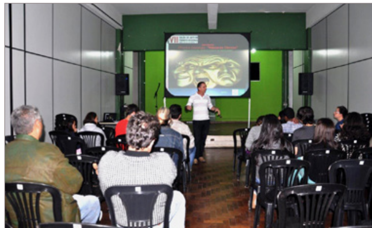
Programação de aniversário teve início com Oficina de Máscaras Cênicas