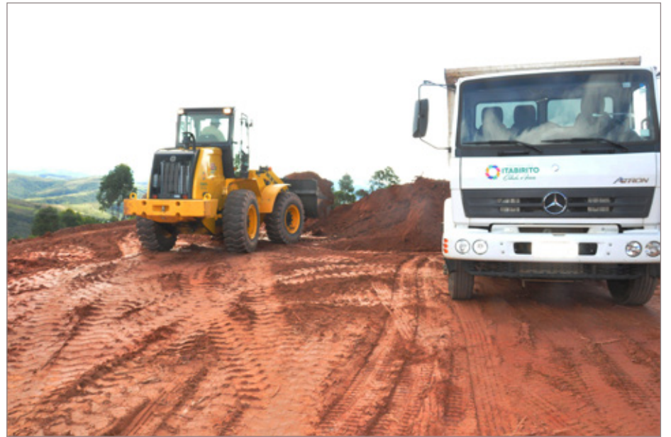
Secretaria de Obras está realizando a terraplanagem para construção de Escola em Acuruí