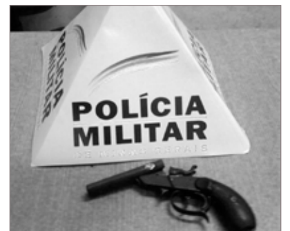
Arma apreendida no bairro São Cristóvão em Ouro Preto

Após receber denúncia anônima, a Polícia Militar compareceu, na noite do sábado (9) ao bairro São Cristóvão, em Ouro Preto. No local, dois rapazes foram abordados, sendo encontrado com um deles, de 17 anos, uma garrucha. De acordo com o outro menor, também de 17 anos, eles iriam utilizar a arma de fogo para cometerem um delito. Ele confessou ainda ser o autor de um roubo praticado com a mesma arma no centro da cidade. Os dois menores, que são suspeitos da autoria de outros dois delitos, foram apreendidos e encaminhados para a Delegacia de Polícia Civil, junto à arma apreendida pela Polícia Militar.