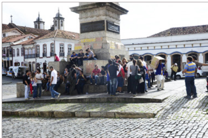
Estudantes participaram da Tribuna Livre para manifestar insatisfação com o transporte público e pedir providências

Ao final da sua participação o estudante propôs a realização de uma audiência pública, para que toda população possa participar e levar suas indagações ao plenário. A sugestão foi colocada em votação e aprovada por todos, sendo agendada para o dia 8 de abril, às 18h na Câmara de Vereadores.