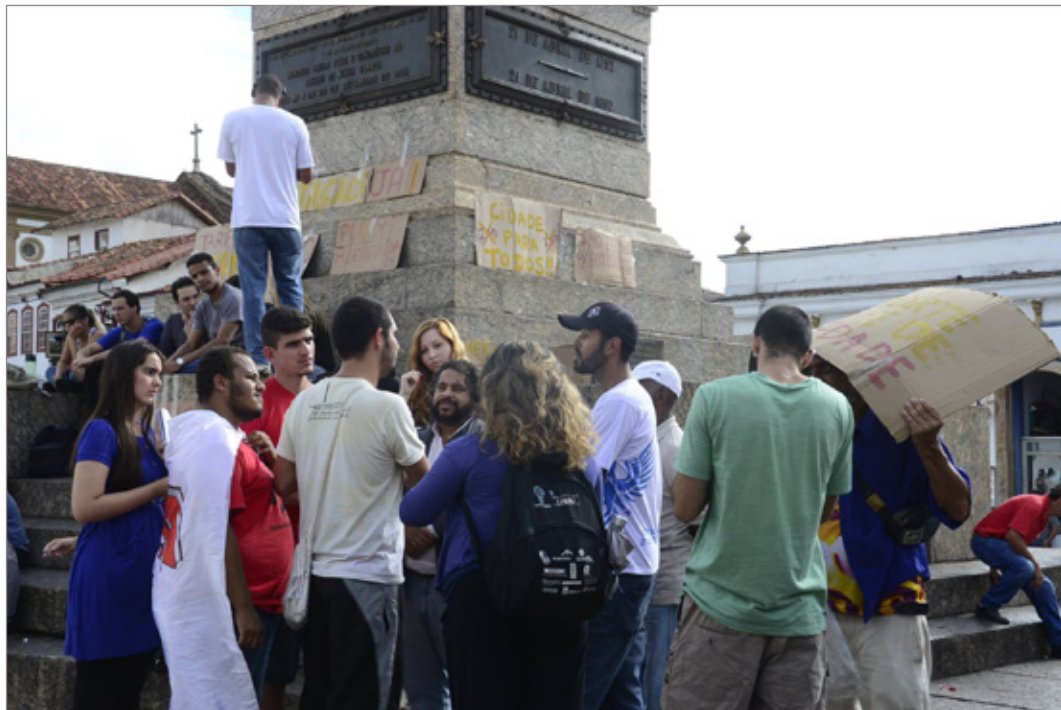
Manifestantes se concentraram em frente à Câmara na tarde de terça-feira (10) antes da reunião ordinária

No Brasil já existem algumas cidades do interior que adotaram a Tarifa Zero. Porto Real, no Rio de Janeiro, e Agudos, no interior de São Paulo, próxima a Bauru, por exemplo, desde 2011 extinguiram a tarifa, o que resultou no aumento de mais de 60% na escolha pelo transporte público.