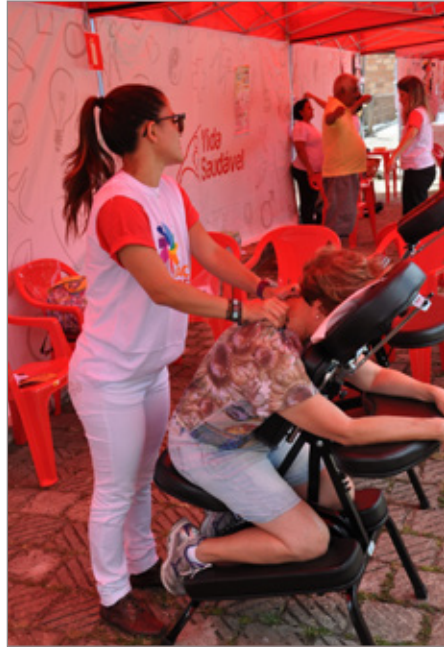
Vários serviços foram oferecidos durante o dia