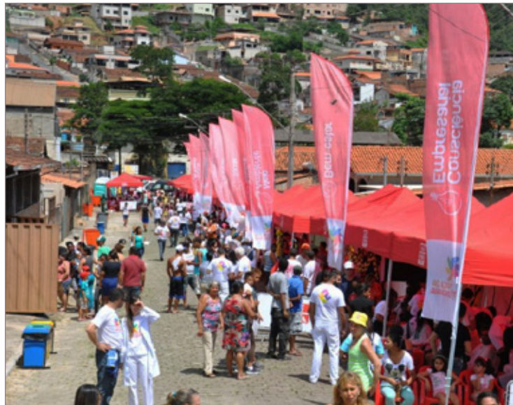
Praça da Cidadania foi sucesso de público

A Praça da Cidadania contou também com a participação do Instituto L’Oreal Professionnel, Polícia Militar de Minas Gerais e Previdência Social como parceiros.