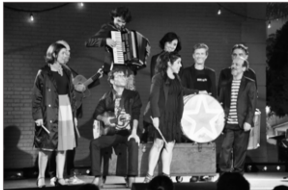
O Grupo Galpão foi uma das grandes atrações da Campanha