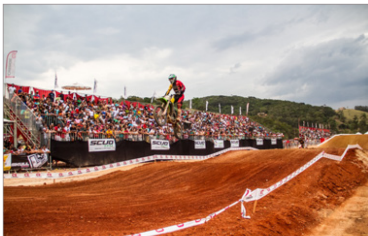
A edição de 2014 da Copa Pro Tork Minas Gerais de Motocross foi um sucesso

Na ocasião irá ocorrer, ainda, o sorteio de uma moto 0 km. Para participar basta entregar 1 kg de alimento não perecível na entrada do evento. O sorteio será dia 15 de março, após o encerramento das provas.