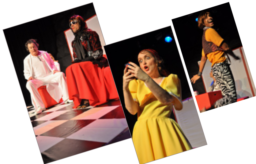
Adultérios e outras pequenas traições da Cia. Farsa teve sua primeira apresentação regional no dia 08/03, no Centro de Artes e Convenções da UFOP. Quem foi afirma: “foi uma excelente apresentação”.