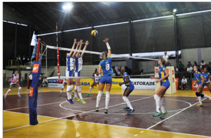
Apesar da derrota, jogo foi disputado ponto a ponto