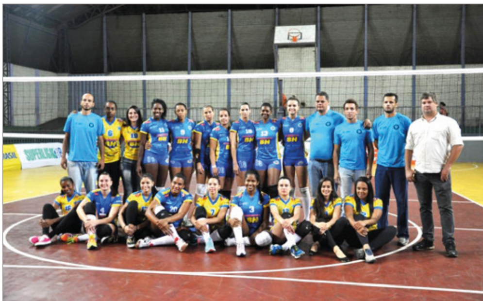
Superliga em Itabirito: no primeiro ano de formação, o Vôlei de Itabirito já é considerado um dos grandes times do estado

A cidade leva seu time, pela primeira vez, a uma das mais importantes competições de voleibol do país