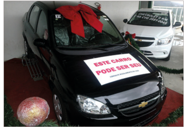
Um dos três Chevrolet's Classic que serão sorteados neste domingo

A promoção Natal Solidário Cooperouro iniciou-se dia 1º de novembro de 2014. Todas as compras feitas desde então geram