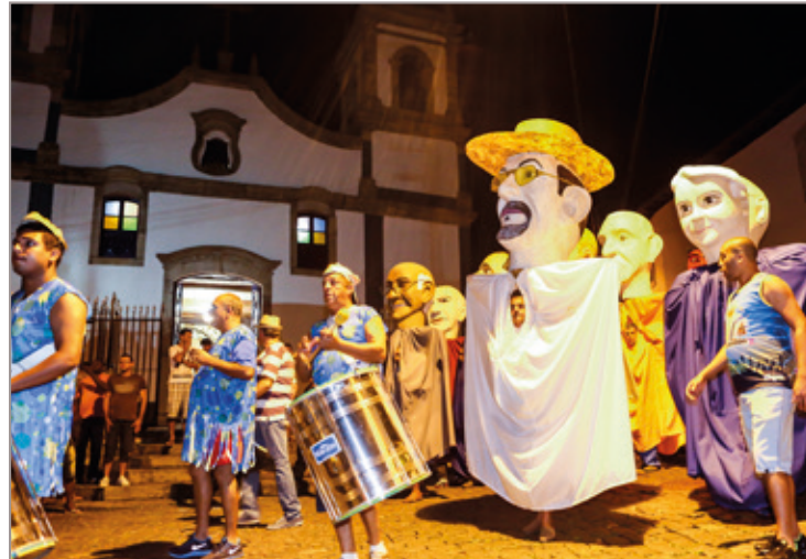
Bloco Zé Pereira é um dos mais tradicionais de Itabirito

Na noite de sexta-feira, 13, é a vez do Cordão da Velha (Corporação Musical Santa Cecília) se apresentar. Este será o 32º desfile do Bloco que abre oficialmente o Carnaval. Os participantes se apresentam com as camisetas oficiais com os símbolos do Gato e a Tuba e também com fantasias dos principais personagens de carnaval. A inspiração vem dos cordões de Olinda.