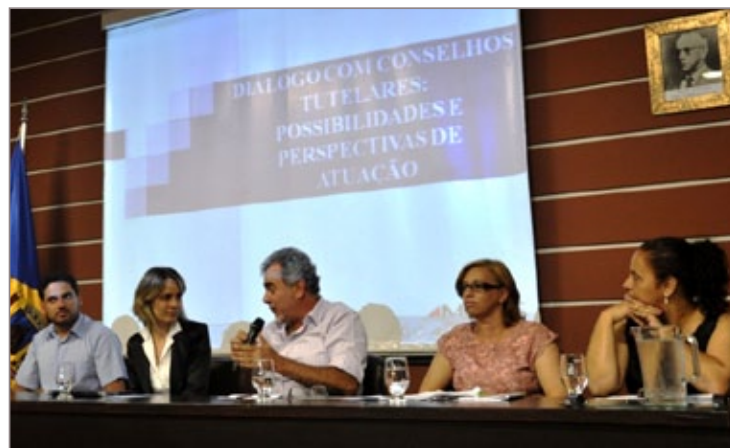
A quarta edição do seminário do Conselho Tutelar debateu questões como as atribuições e desafios do órgão