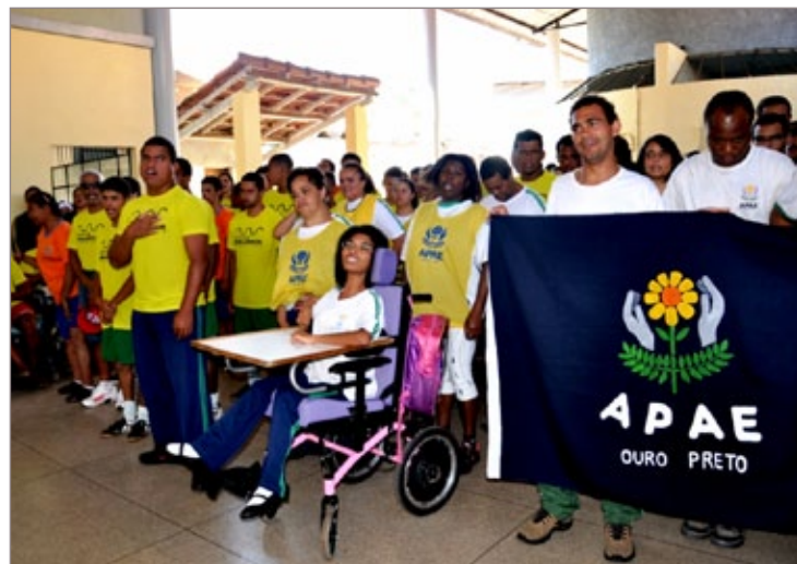
Apaes de Ouro Preto, Mariana, Ouro Branco e Congonhas participaram do evento