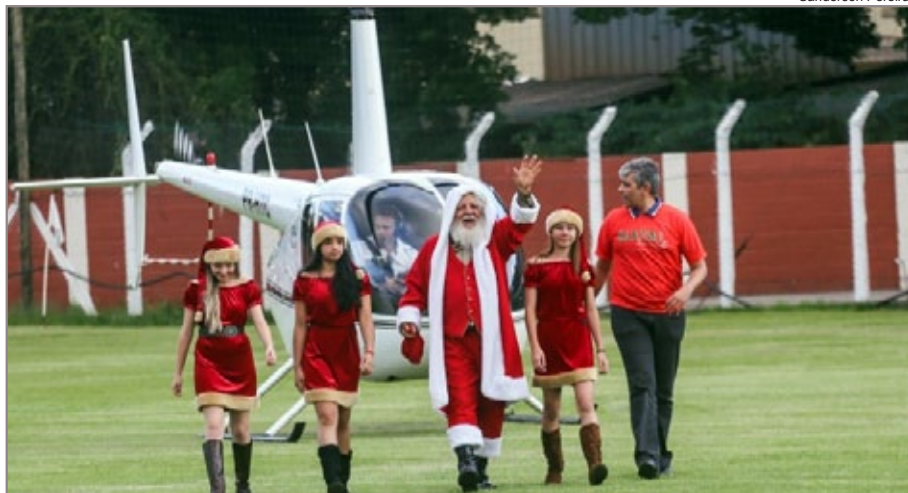
Papai Noel chegou de helicóptero em Itabirito