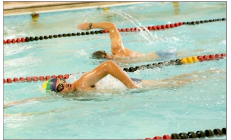
O esporte escolhido para iniciar o triathlon foi a natação