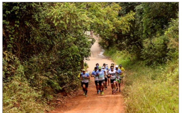
Ao todo, 13 atletas de alto rendimento participaram da competição