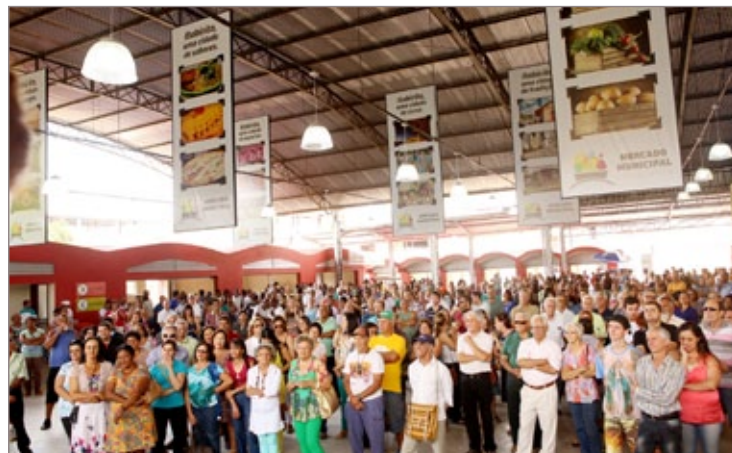
Solenidade de inauguração do Mercado Municipal, comunidade e feirantes acompanharam o evento

A antiga feira, que funcionava no mesmo local, abrigava 18 feirantes. O novo Mercado terá espaço para mais de 30, além disso, 16 novas lojas estarão disponíveis, sendo três para a praça de alimentação e 13 destinadas à venda de produtos e serviços em geral, como peixaria, laticínios, cachaçaria, livraria, floricultura, quitandas, artesanato, entre outros. Os antigos vendedores continuam comercializando no local e os pro-