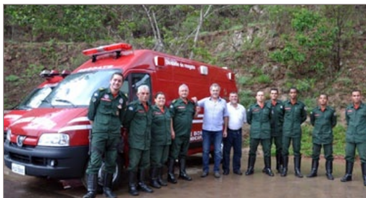
Nova ambulância conta com aparelhos específicos para resgates em locais de difícil acesso, por exemplo

O prefeito Alex Salvador afirmou que a nova ambulância marca o início da renovação da frota do Corpo de Bombeiros. “Vamos adquirir novos veículos, como um caminhão pipa e um caminhão bomba, que são essenciais para o desempenho do trabalho dos bombeiros. Além disso, a renovação da frota, que é feita com recursos próprios do município, é mais uma forma de ofertar segurança à população”.