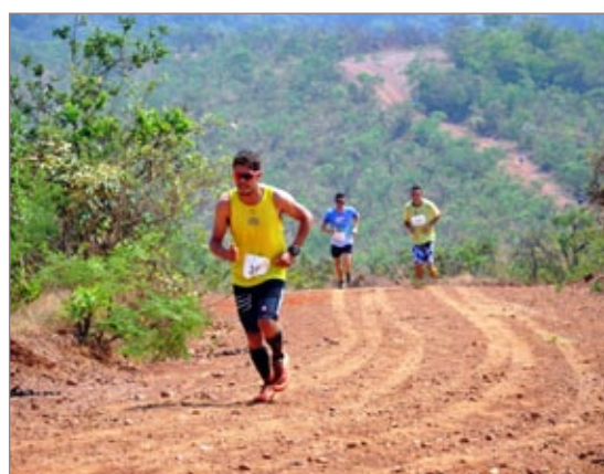
Percurso acidentado e a alta temperatura foram os principais desafios para os competidores