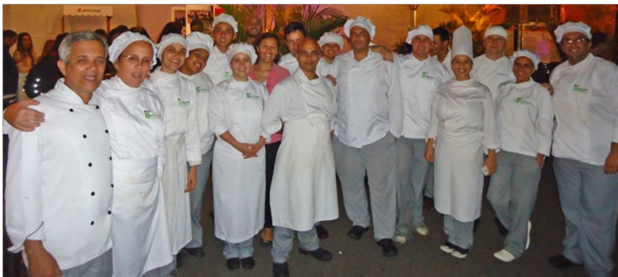
Alunos da gastronomia do IFMG conceberam deliciosas receitas para inebriar o paladar dos presentes

Dentre as atividades, workshops, exposições, mostras, oficinas, intervenções e outros projetos. Paralelo a isso, shows, exibição de filmes, lançamentos de livros, e outras atividades que estão incluídas na programação, como o Red Bull Gravity Challenge (uma competição que convida os estudantes a desenvolverem uma engenhoca que permita que um ovo aterrisse são e salvo depois de lançado de uma altura de 12m.) na sexta-feira (24), no Mirante da UFOP.