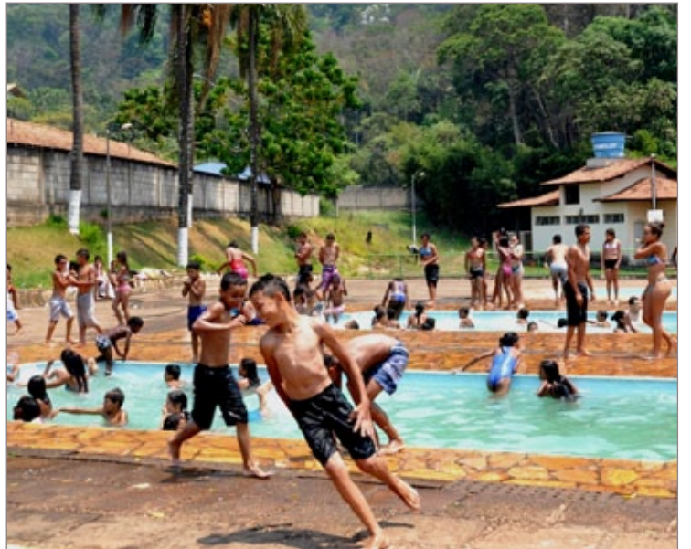
A programação estava recheada de atividades recreativas, mas a atração principal foi a piscina