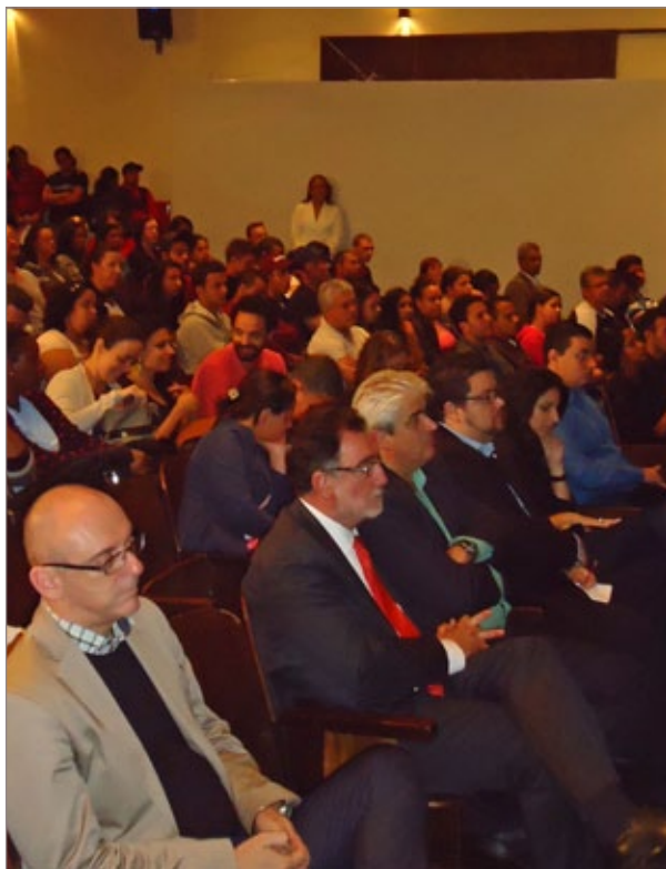
Patrus Ananias falou sobre as políticas sociais da última década

Sob o tema "Ciência e Tecnologia para o Desenvolvimento Social", a 7ª edição da Semana de Ciência e Tecnologia e a 6ª edição do projeto Estação Ciência do Instituto Federal de Minas Gerais (IFMG) teve seu início no dia 20 e segue até 25 de outubro. Exposições e a abertura do Campeonato Brasileiro de Judô integraram a programação no primeiro dia.