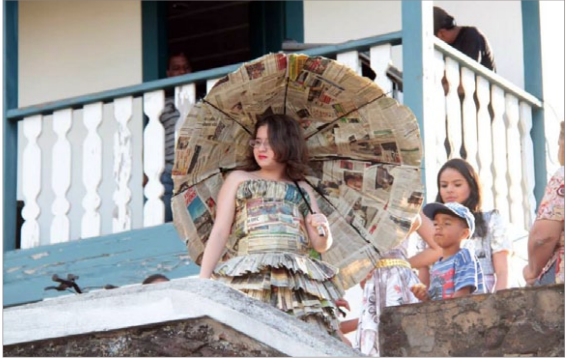
Traje de jornal feito pela Associação de Catadores do Padre Faria

Desde o início do projeto, aproximadamente 700 pessoas da comunidade de Ouro Preto (sede e distritos) participaram de 25 oficinas sobre o tema, além de palestras e eventos culturais. O Projeto foi concretizado em conjunto com a Associação de Catadores do Padre Faria, e conta com a participação da ACMAR, da Associação de Moradores da Vila Aparecida, das Secretarias Municipais do Meio Ambiente, Casa Civil, Turismo, Indústria e Comércio; do Programa Atitude Ambiental da Vale, de voluntários e grupos locais de artesanato.