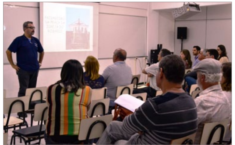
Em reunião, foram apresentadas a próximas ações de intervenção no Centro Histórico de Itabirito

Antes de dar início às atividades de revitalização, paisagismo e recomposição do Centro Histórico, o Conselho Municipal do Patrimônio Histórico Artístico e Natural de Itabirito (Compatri) por meio do Plano de Aplicação do Fundo Municipal de Preservação do Patrimônio Cultural (Fumpac) esclareceu dúvidas acerca do projeto a ser implantado na região. A iniciativa foi importante para a sensibilização das comunidades e para informar sobre as intervenções