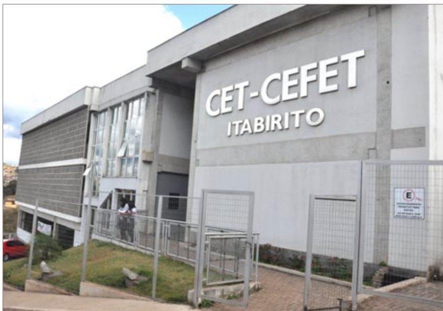
O IFMG assumirá cursos a serem ofertados no município