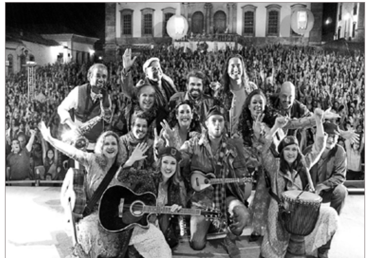
Com um grande público, aconteceu no sábado, 27 de setembro, na Praça Tiradentes, em Ouro Preto, uma homenagem a Milton Nascimento. Sob a coordenação da Rubim Produções, o show emocionou a todos, onde os atores e músicos tocaram, cantaram e representaram os maiores sucessos do artista

Cores do Inconsciente - Os desvios da Lucidez é o título escolhido para a exposição da turma 11.2 do curso de Museologia da UFOP, e está prevista para ser inaugurada no dia 31 de outubro ficando aberta a visitação até o dia 28 de novembro, das 9h às 19h, na sala de exposições do Departamento de Museologia, no prédio da Escola de Direito, Turismo e Museologia. Além do circuito expositivo, estão previstas atividades ligadas ao tema no período vinculado, com ações educativas entre grupos escolares da região, um seminário no dia 07 de novembro e seções de filmes comentados no Cine Teatro Vila Rica.