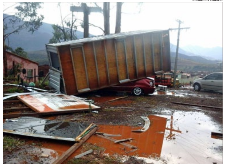
Contêiner de mais de 1 tonelada foi levado pelo vento