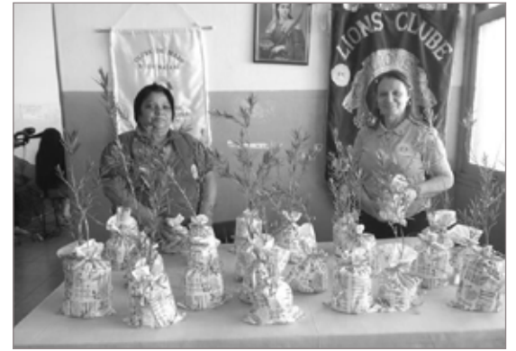
O Lions Clube de Cachoeira do Campo continua engajado em sua missão social com oficinas sendo realizadas todas as terças-feiras, de 14h às 16h, em frente ao Supermercado Pedrosa. Os cursos formativos incluem cabeleireiro, manicure, pedicure, bordados em geral, crochê e pintura em tecido. Os tutores são pessoas abnegadas e comprometidas com a comunidade. Durante o horário das oficinas a população ainda pode visitar o Bazar da Pechincha

O Programa Proteger é Preciso, da Vale e Fundação Vale, inaugurou o Núcleo Jovem de Comunicação de Antônio Pereira, distrito de Ouro Preto. O espaço está localizado na Casa Escola e foi inaugurado na sexta-feira, dia 26. O objetivo da iniciativa é estimular a mobilização e participação de adolescentes no desenvolvimento de ações de prevenção e enfrentamento à violência sexual contra crianças e adolescentes. O Núcleo oferecerá aos jovens oficinas de teatro, dança, fotografia, produção de vídeo e produção literária. Os jovens também participarão de exposições fotográficas e outras atividades. O espaço está equipado com câmeras fotográficas, gravadores, datashow e materiais didáticos. As oficinas serão, ainda, ministradas por especialistas nos Direitos das Crianças e Adolescentes e pessoas com experiência em linguagens artísticas e de comunicação. Também serão inaugurados Núcleos em Santa Rita Durão, distrito de Mariana; e Jardim Canadá, em Nova Lima. Nos municípios de Barão de Cocais e Itabirito os espaços já estão em funcionamento.