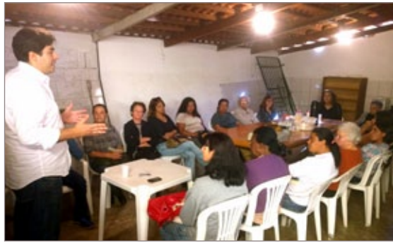
Na reta final, reunião com Grupo de Artesãs