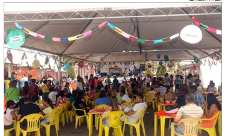
A Feira Gastronômica esteve lotada durante os dois dias!

Estação também recebeu exposições sobre Patrimônio e Cidadania e Lugares de Minas.