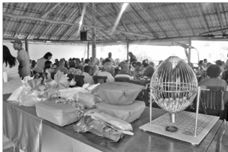
Várias atrações foram realizadas para as entidades da região, como o Clumi, a Casa de Repouso Luiza de Marilac e Grupo Fim de Tarde