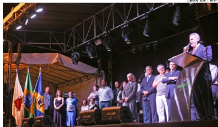
A cerimônia de inauguração da UPA aconteceu no dia 26 de setembro