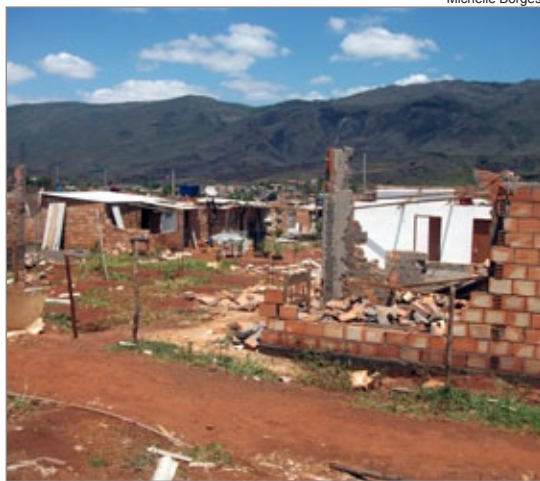
Casas construídas em terreno de invasão ficaram totalmente destruídas com a forte chuva