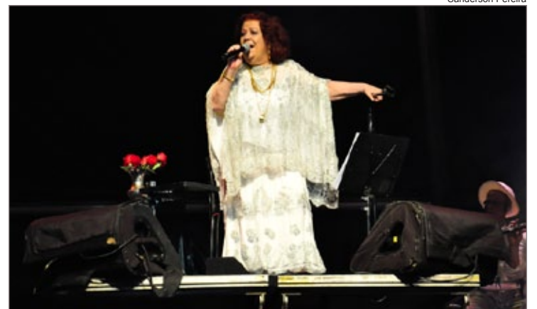
Beth Carvalho foi a atração mais esperada da Saideira