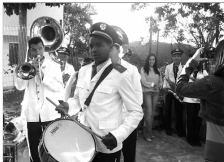
Bandas esperam ser contempladas em projeto anunciado pela prefeitura