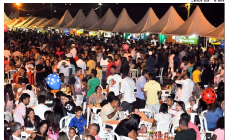
O público lotou a Praça dos Inconfidentes no último sábado