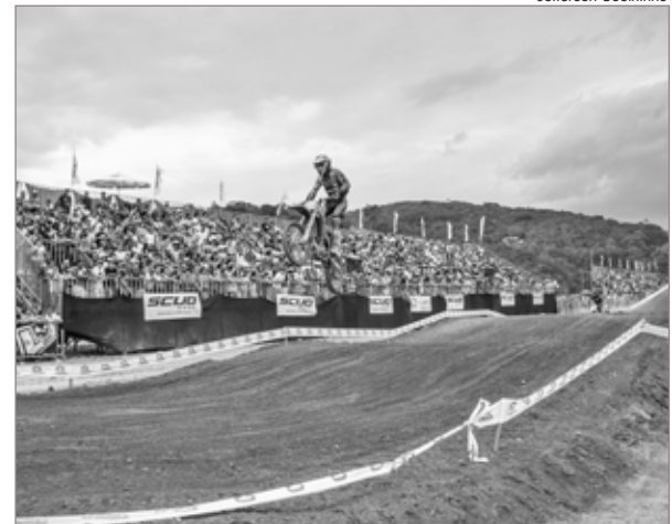
Motocross foi sucesso de público no último domingo