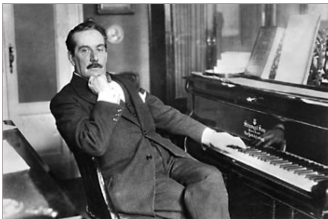
Puccini, criador de peças de grande valor dramático como Nessun Dorma , terá espaço na programação

O Circuito VDL de Arte e Cultura é viabilizado por meio da Lei Estadual de Incentivo à Cultura de Minas Gerais, e conta com o patrocínio da VDL Siderúrgica Itabirito e Irmãos Farid, apoio da Prefeitura de Itabirito, Casa de Cultura Maestro Dungas. A produção é assinada por José Carlos Oliveira e Ubiraney Silva.