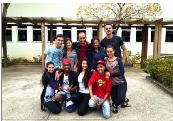
Elenco do espetáculo encenado pela Cômica Cia. de Teatro