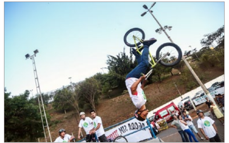
Apresentação de manobras radicais antecederam a inauguração da passarela

A passarela irá oferecer segurança aos pedestres que precisam passar pelo local, tendo em vista que na ponte havia espaço somente para a passagem de carros. “O risco era constante. Muitas pessoas fazem caminhadas por aqui e precisam disputar espaço com os carros, eu mesma já corri perigo aqui! Foi um alívio quando soubemos da construção da passarela”, comemorou a moradora do bairro