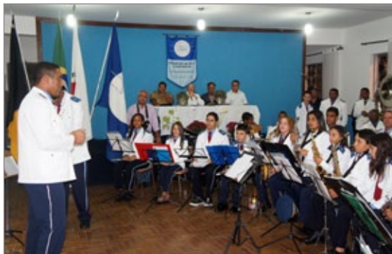
Músicos novatos já reunidos para a alvorada