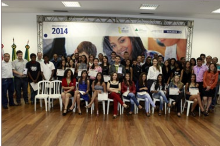
Cerimônia de formatura do projeto Miniempresa em Mariana

O evento contou com a presença de diversas pessoas, principalmente dos familiares e amigos dos formandos que vibraram intensamente a cada cer-