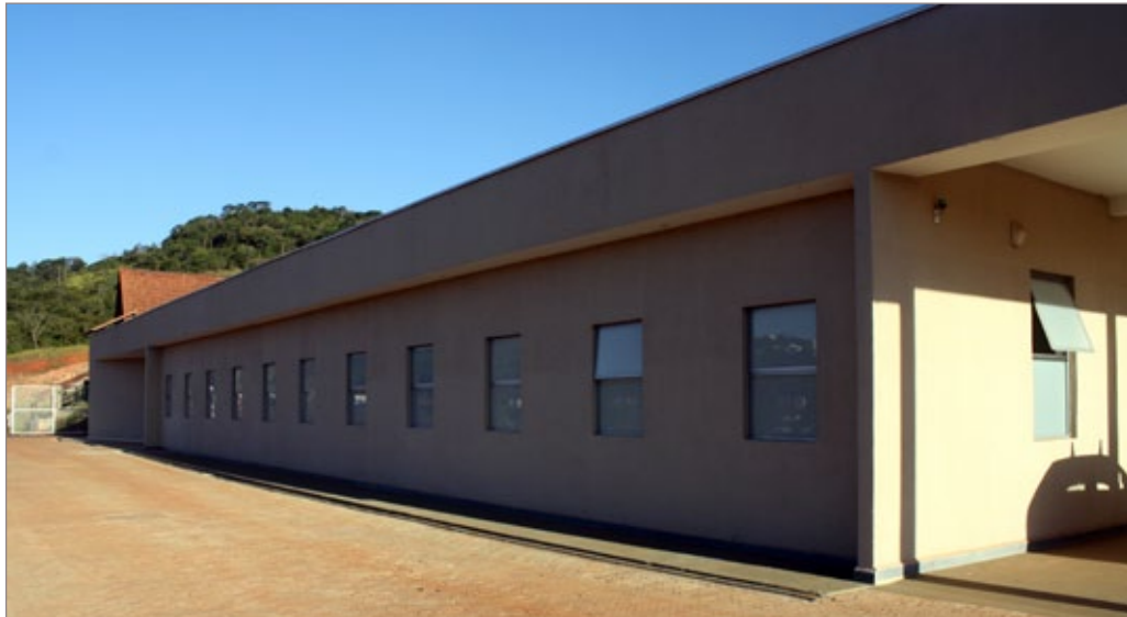
Nova UPA será entregue no dia 26 de setembro

Prefeitura entrega Nova UPA pronta para atender a população