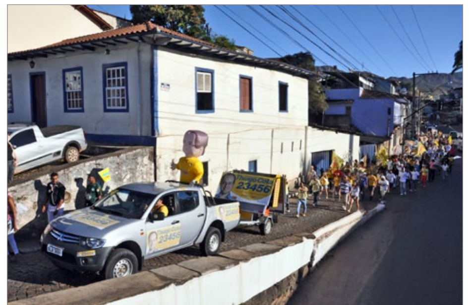
Caminhada toma as ruas da cidade