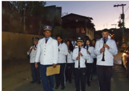
Banda se apresenta com os recém-incorporados