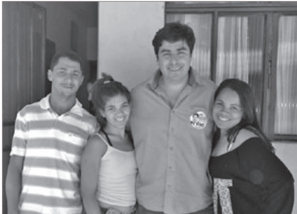
Mobilização em Santa Rita