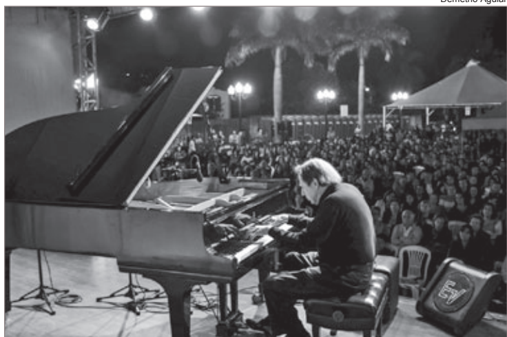
O público encheu a Praça da Estação, local onde aconteceu o concerto de piano itinerante