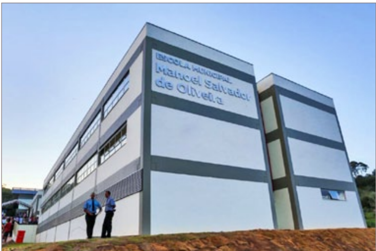
A Escola Municipal Manoel Salvador foi inaugurada no final do ano passado. Um dos exemplos de investimento da atual administração na educação do município.

O Ideb é o Índice de Desenvolvimento da Educação Básica, criado em 2007, pelo Instituto Nacional de Estudos e Pesquisas Educacionais Anísio Teixeira (Inep) formulado para medir a qualidade do aprendizado nacional e estabelecer metas para a melhoria do ensino. O Ideb funciona como um indicador nacional que possibilita o monitoramento da qualidade da educação pela população por meio de dados concretos, com o qual a sociedade pode se mobilizar em busca de melhorias. Para tanto, o Ideb é calculado a partir de dois componentes: a taxa de rendimento escolar (aprovação) e as médias de desempenho nos exames aplicados pelo Inep. Os índices de aprovação são obtidos a partir do Censo Escolar, realizado anualmente.