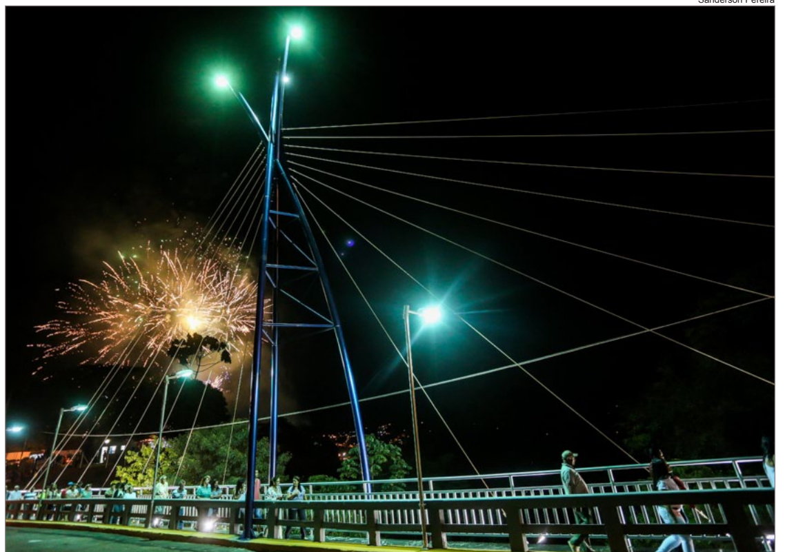
Passarela oferecerá conforto e segurança para os pedestres que passam pelo local!

Após a inauguração, os participantes curtiram um show de pop rock com a banda Dona Benedita.