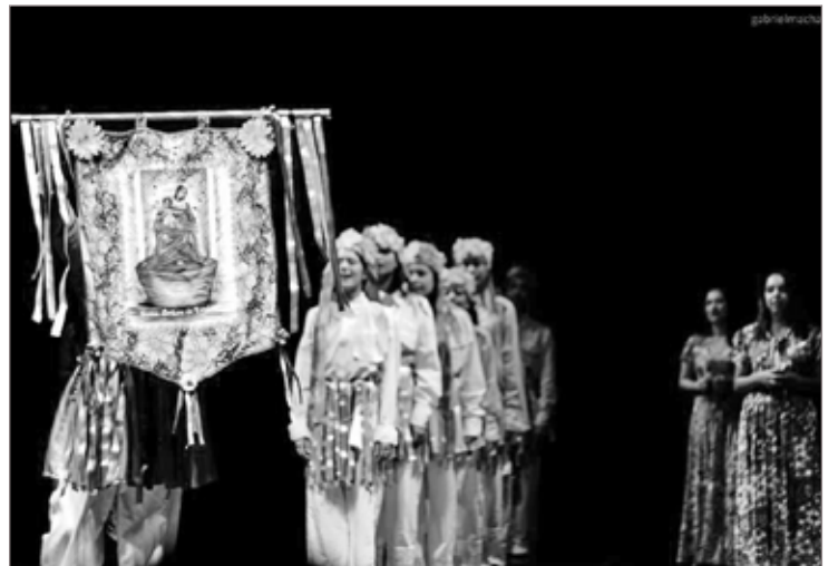
Grupo Rosários de Ouro Preto representa Minas Gerais em Porto Alegre

No ENUDP, o Grupo apresentará o espetáculo "Minas dança o Brasil". O evento ainda terá oficinas, sessões científicas e apresentações de espetáculos.