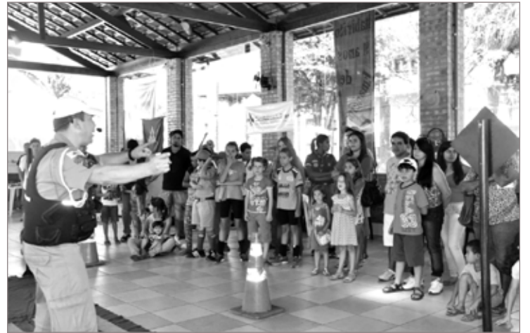
Durante a Ação Cívica da PM, ocorreram diversas atividades de orientação como esta, um teatro sobre educação no trânsito