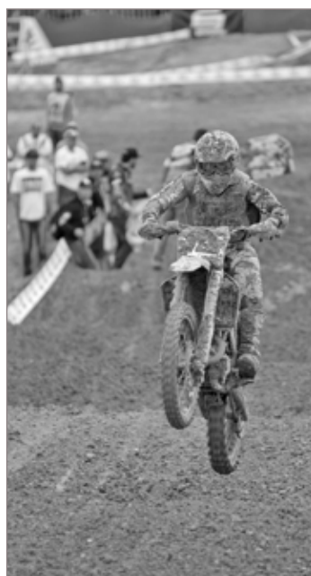
Córrego do Bação receberá a 4ª etapa da Copa Minas Gerais de Motocross

Ainda no dia 20 terá início a 4ª etapa da Copa Minas Gerais de Motocross. A disputa acontecerá na Rua Principal do distrito de Córrego do Bação, com treino no sábado e competição no domingo, a partir das 8h. A entrada é franca. E para fechar com chave de ouro, o domingo, 21, é dia de Passeio Ciclístico. A largada será realizada na Praça da Estação, às 8h30.