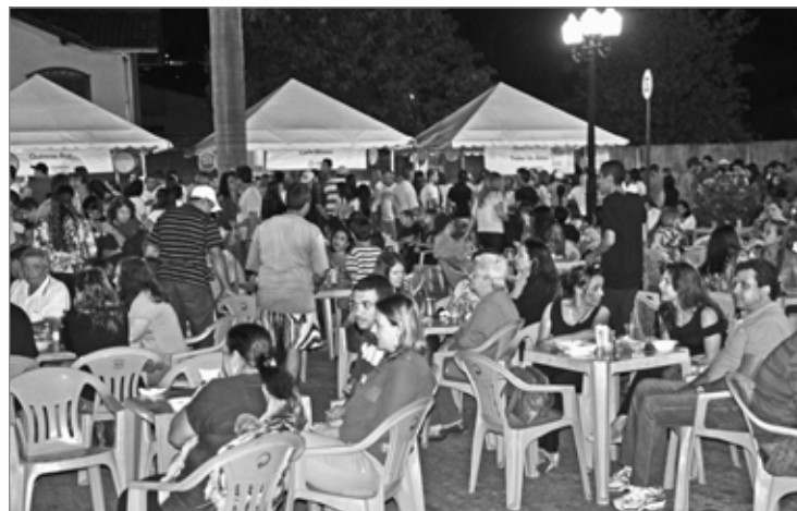
A Saideira do Viação Gastronômica promete ser sucesso de público!