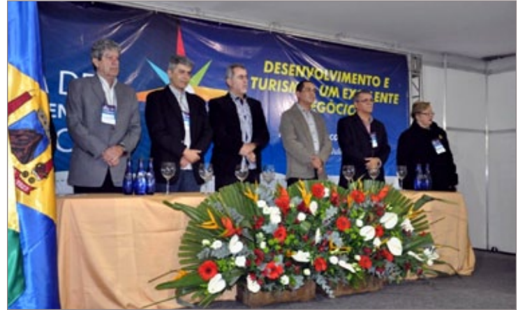
Abertura da Semana de Desenvolvimento Econômico

A 10ª Semana de Desenvolvimento Econômico de Itabirito é uma realização da Prefeitura, por meio da Secretaria de Desenvolvimento Econômico, em parceria com a Adesita.