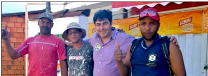
Corpo a corpo em Antônio Pereira