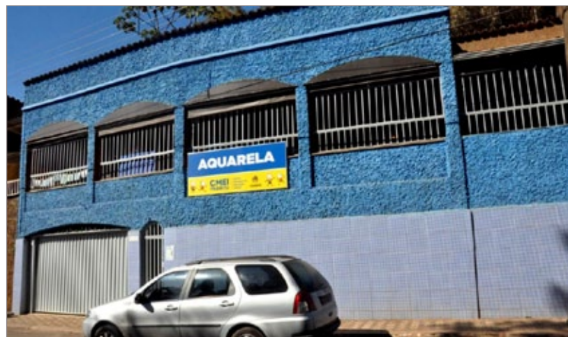
A Creche Aquarela é inaugurada no dia 05 de setembro (sexta-feira, hoje)