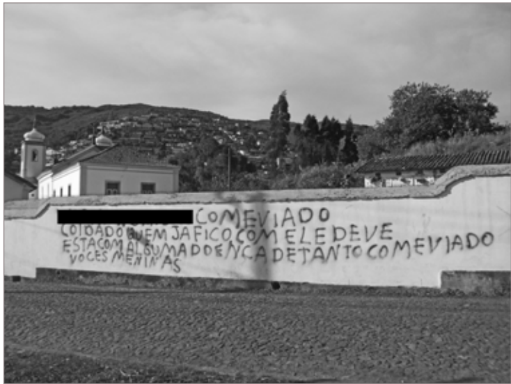
Muro foi pichado com dizeres de teor homofóbico

Os autores, um rapaz de 32 anos e sua namorada, de 15, confessaram o crime e alegaram arrependimento. O motivo do delito, segundo os suspeitos, foi a decepção com o catolicismo.