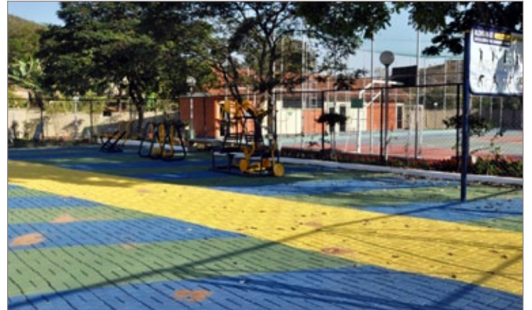
Ao todo, serão inauguradas 24 academias a céu aberto por toda a cidade