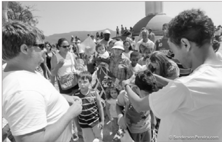
Muitas famílias foram ao Alto do Cristo para participarem do Festival de Pipas e Papagaios