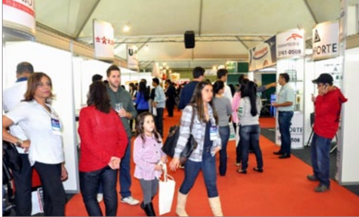
Visitantes lotam o espaço de exposições da Semana