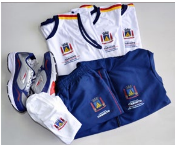
Alunos serão beneficiados com uniformes gratuitos

Os pais que já adquiriram uniformes este ano não precisam se preocupar, pois, eles poderão ser utilizados até dezembro de 2015 ou mais, respeitando assim o período de transição de modelos. Para 2015 o processo será mais tranquilo e a previsão de datas será comunicada após processo licitatório concluído.