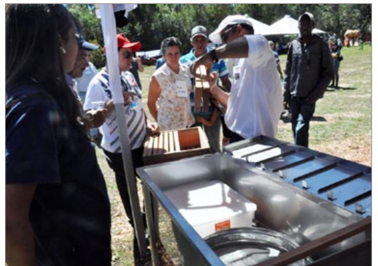
Nas vitrines, os participantes puderam vivenciar na prática o que foi discutido na palestra