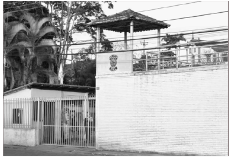
Presídio de Mariana, localizado na rua 16 de Julho, no Centro da cidade