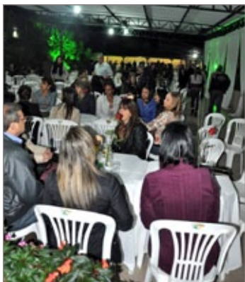
A premiação aconteceu de forma descontraída entre os líderes comunitários e autoridades

Associação de Apoio Comunitário Hamilton de Oliveira do Bairro Pedra Azul - R$3.500,00; 4º lugar: Associação de Apoio Comunitário do Bairro Santa Rita - R$ 3.000,00; 5º lugar: Associação Comunitária Amigos do Munu - R$2.500,00