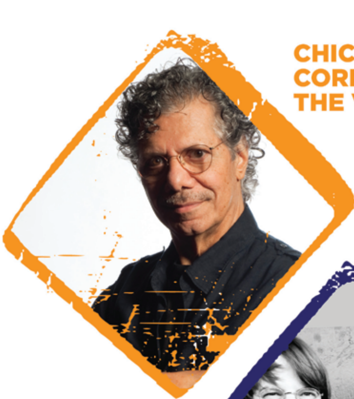
CHICK COREA & THE VIGIL