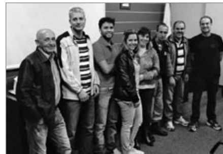
Integrantes da primeira Rede de Comerciantes Protegidos de Itabirito

Outros proprietários de comércios ou moradores da cidade interessados em criar Redes de Proteção de Comerciantes ou de Vizinhos devem procurar a Polícia Militar para que sejam agendadas reuniões para criação das mesmas.