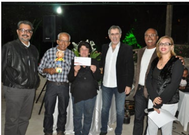
Os cheques foram entregues às cinco associações comunitárias vencedoras da 24ª edição da Julifest