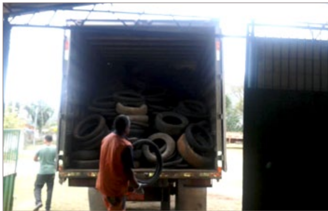
Recolhimento de pneus no Ecoponto.

Um pneu pode demorar até 600 anos para se decompor naturalmente. Quando queimado ao ar livre, solta uma fumaça poluente e, se lançado nos rios, pode atrapalhar o fluxo natural das águas,