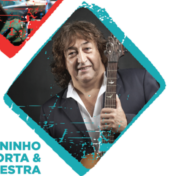
TONINHO HORTA & ORQUESTRA FANTASMA

CONCERTOS • FILMES • ETAPA EDUCATIVA E MUITO MAIS! ENTRADA FRANCA mimo.art.br