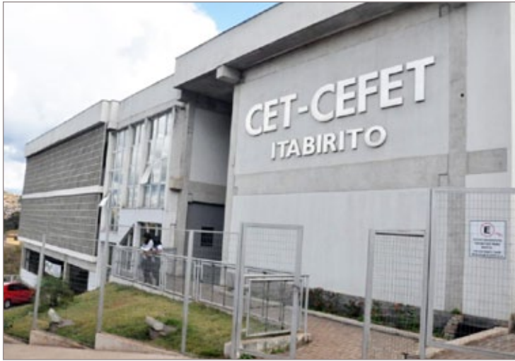
CEFET: O CET-Cefet de Itabirito será transformado em IFMG