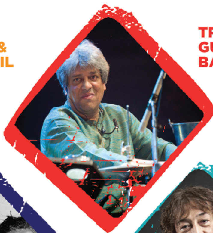
TRILOK GURTU BAND