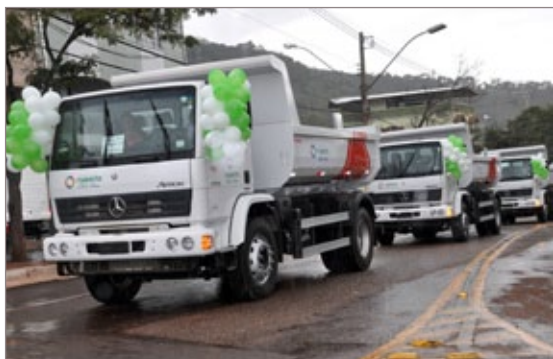
Caminhões atenderão os serviços de limpeza urbana, obras e conservação de estradas