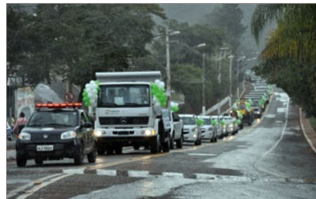
Frota em carreta pelas ruas de Itabirito