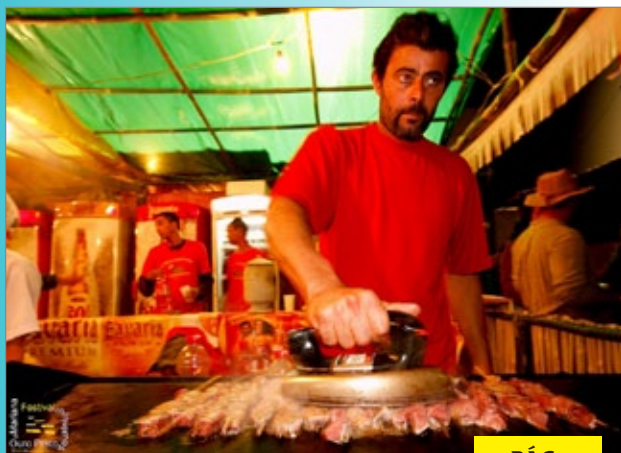
9ª Festa da Panela de Pedra em Cachoeira do Brumado