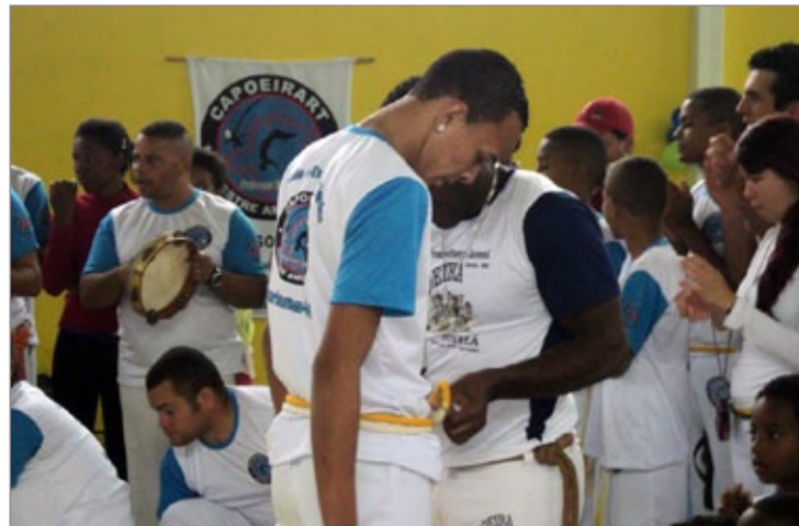
A comunidade marcou presença no batizado e na troca de cordas