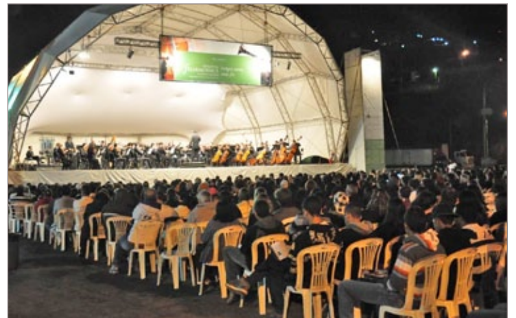
A Praça dos Inconfidentes lotada para a apresentação da Orquestra Filarmônica de Minas Gerais

A apresentação da Orquestra Filarmônica de Minas Gerais foi mais uma atração do Ano de Desenvolvimento da Atividade Turística de Itabirito. A Prefeitura reforça cada vez mais seu comprometimento no investimento em atrações turísticas diversificadas, contemplando os mais variados gostos e estilos, além de fortalecer os vínculos culturais da cidade.