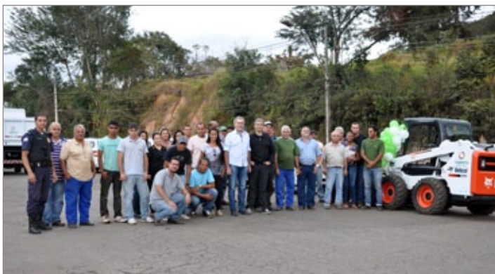
Esforço conjunto! Prefeitura adquire nova frota de veículos