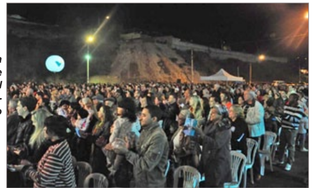
Platéia aplaude ao final da apresentação