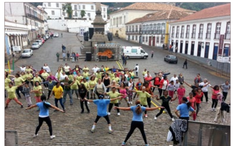
Projeto Comunidade em Movimento fez parte das atividades oferecidas pela Secretaria de Esportes para comemorar o aniversário da cidade