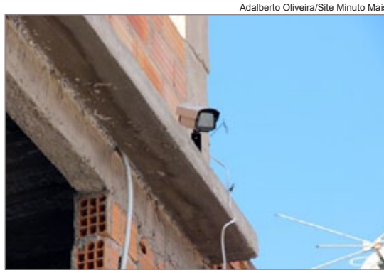
Três câmeras de segurança monitoravam a movimentação da rua em volta da casa