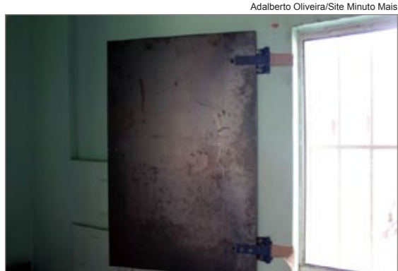
Janelas com chapas de aço foram parte do forte esquema de segurança