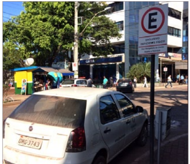
Motorista a serviço do município estacionado em local proibido

Os telefones do Departamento de Trânsito são: (31) 3561-4032 ou 3561-4067.