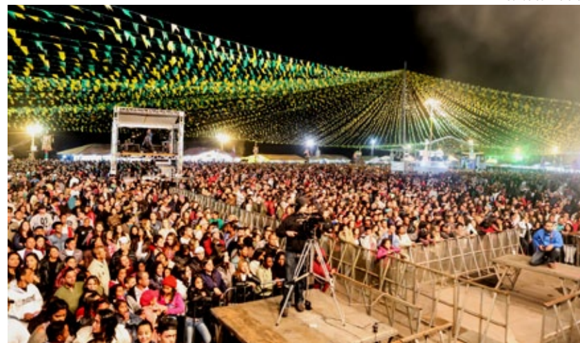
Abertura da Julifest conta com grande público