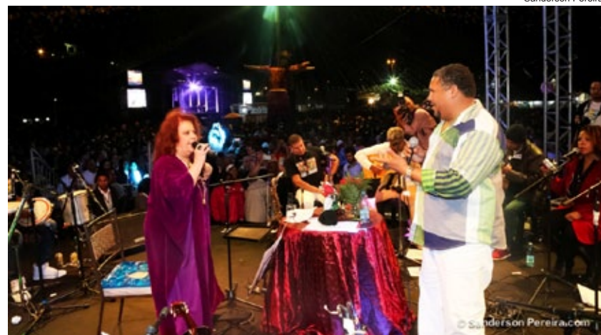
Beco do Rato e Beth Carvalho fazem roda de samba