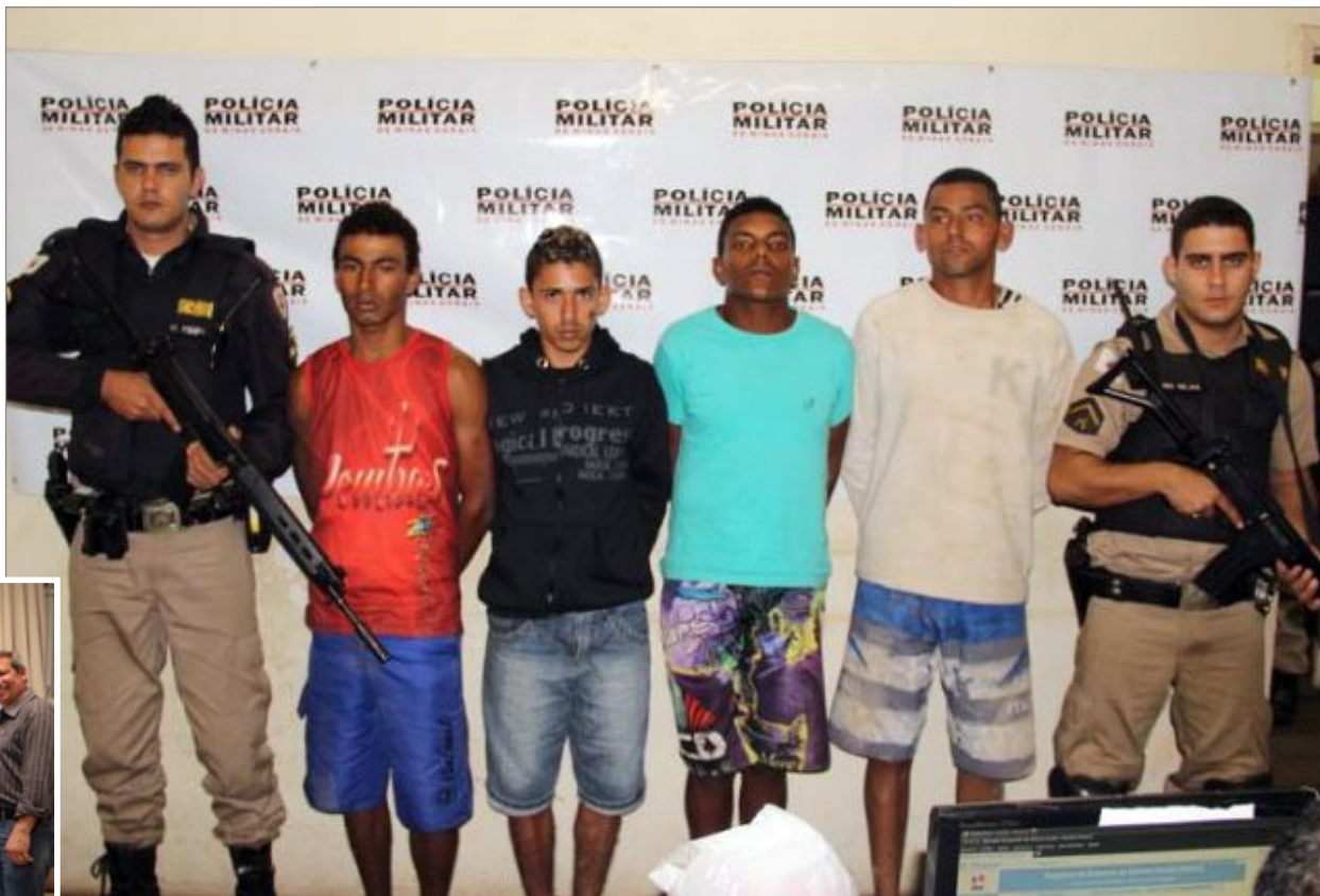
Quadrilha confessou ter realizado pelo menos 7 assaltos a mão armada em Itabirito

Vale lembrar que no dia 13/05, uma quadrilha de assaltantes foi detida, após realizar pelo menos 7 assaltos à mão armada em estabelecimentos itabiritenses, e que nem todas as ocorrências vêm recebendo cobertura extensiva da mídia local.