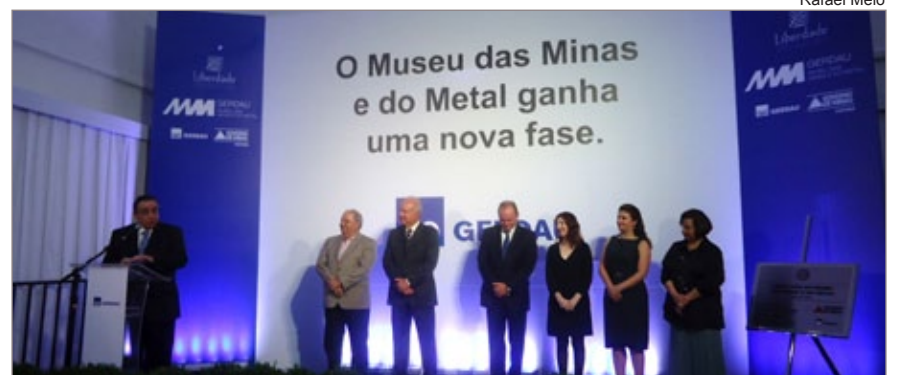
O governador resalta a importância da parceria do Governo Estadual com a Gerdau