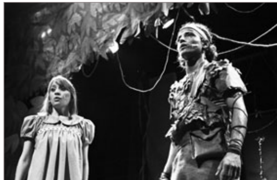
O Teatro SESI-Mariana apresenta, dia 8 de junho, às 17h00, o espetáculo musical “Peter Pan”. Muita música, dança e fantasia, para todas as idades.