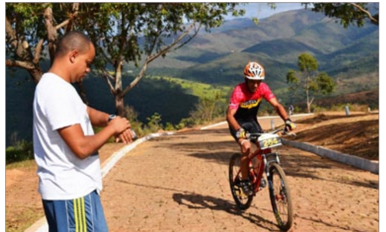
Golden Biker agita o fim de semana em Itabirito

A terceira etapa do Golden Biker será realizada no dia 8 de junho, às 9h, na Praça dos Imigrantes. O trajeto irá percorrer a estrada de terra que dá acesso ao distrito de São Gonçalves do Baço, caracte-