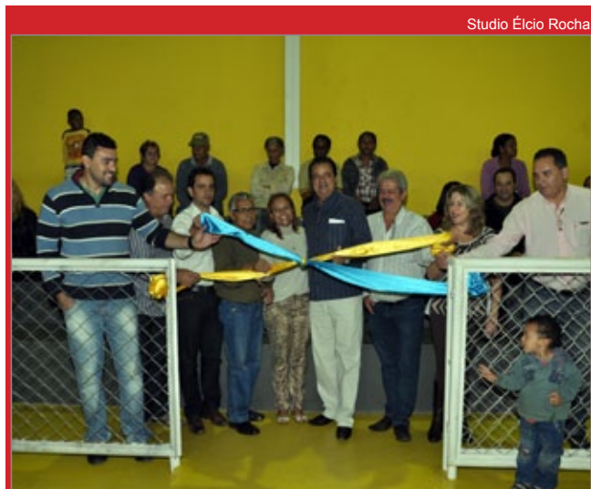
Studio Élcio Rocha