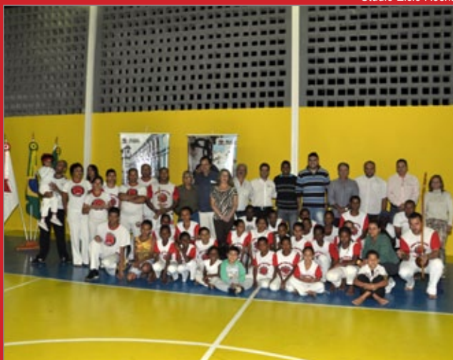
Studio Élcio Rocha

CELSO ENTREGA QUADRA DA CARTUCHA REFORMADA – após meses fechada para obras, a quadra poliesportiva do Bairro Cartucha, em Mariana, abriu suas portas à comunidade na quarta-feira (21). Ao lado do secretário de Desportos, Helerson Freitas, o prefeito Celso Cota participou da cerimônia de entrega e destacou a importância da obra no incentivo à prática esportiva. A quadra poliesportiva do Bairro Cartucha foi construída em 2006. O prefeito destacou os trabalhos de reforma. “Todo prédio público, assim como a casa da gente, precisa de manutenção periódica. É o que estamos procurando fazer aqui e em outros espaços. A gente fica feliz por reabrir esse ambiente adequado a prática do esporte e outras ações na área da cultura e do lazer”, disse Celso.