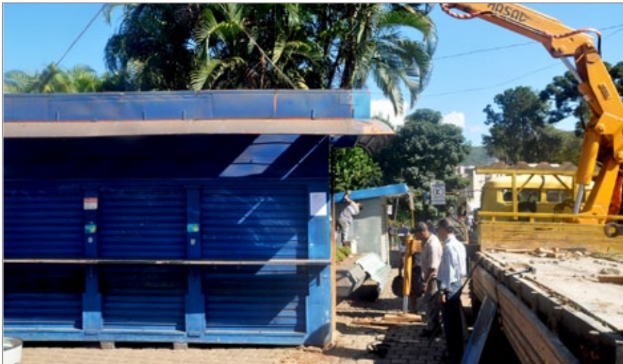
Prefeitura retira trailer da Praça São Sebastião