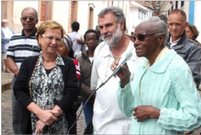
Moradores pedem explicações do Iphan e da Paróquia do Antônio Dias