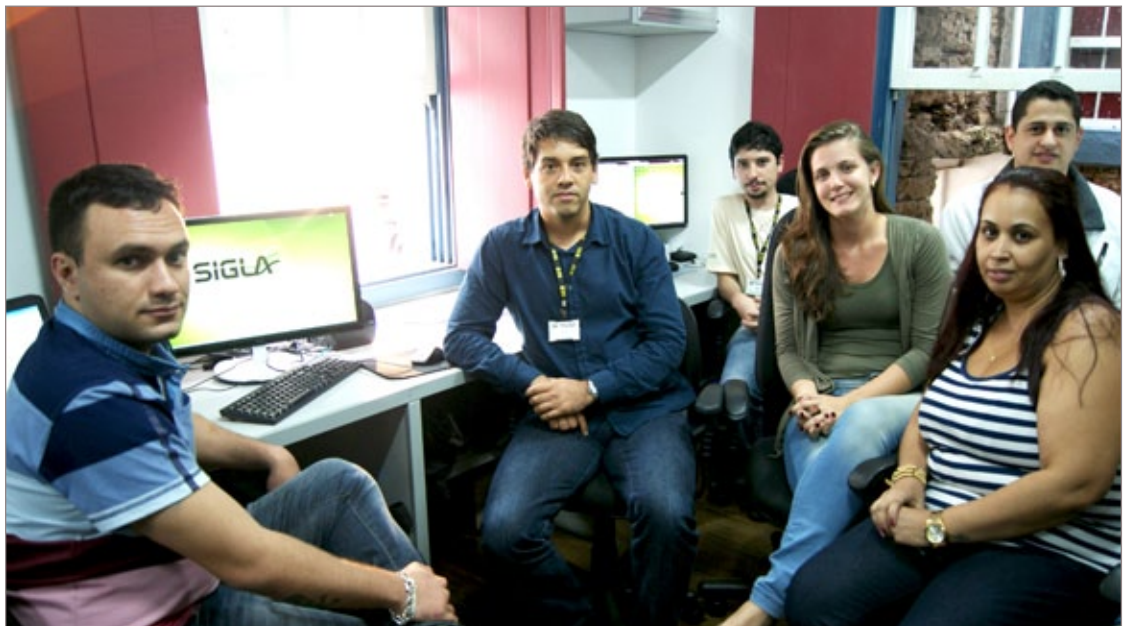
Servidores da Câmara de Cataguases reunidos com servidores da Câmara de Ouro Preto para conhecer todas as funcionalidades do Sigla

Na próxima terça-feira, 20 de maio, a partir das 19h, são comemorados os 17 anos da Rede Pousos dos Viajantes, Grupo Gleiser Boroni. A animada programação inclui show sertanejo com moda de viola, caldos e comida típica de buteco. Inclusive, na oportunidade é inaugurado o Buteco dos Viajantes, mais um empreendimento do prolífico empresário. Venha comemorar! Entrada franca. Informações (31) 9961 1240.