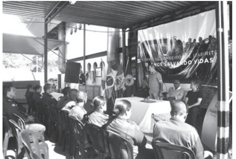
O prefeito Alex Salvador participou das comemorações dos 15 anos dos Bombeiros Municipais

O prefeito aproveitou a oportunidade para anunciar a compra de um caminhão auto-bomba para os trabalhos de combate a incêndios. A corporação também ganhará, em breve, uma nova sede que está sendo construída pela administração municipal. O espaço oferecerá mais conforto e comodidade para a equipe.