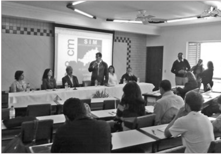
Em 2013, foi realizado o 1º Seminário de Manipulação de Carnes de Ouro Preto para os comerciantes locais

De acordo com a lei, os estabelecimentos serão separados por categorias (A, B e C) para efetuar as atividades comerciais. É conside-