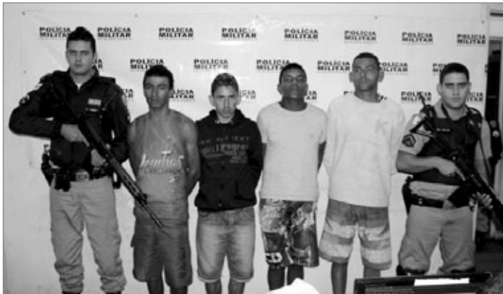
Quadrilha foi presa pouco tempo depois de assaltar supermercado