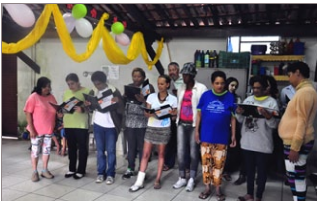
Pacientes do Caps fizeram apresentação musical durante as comemorações

O Caps funciona de segunda a sexta das 08 às 18h. Trabalham no local cinco psiquiatras, quatro psicólogos, um assistente social, uma enfermeira, duas técnicas de enfermagem, duas terapeutas ocupacionais, uma monitora, uma farmacêutica, duas auxiliares de farmácia, duas recepcionistas, dois vigias, uma artesã e duas auxiliares de serviços gerais. Além do Caps Adulto, o Serviço de Saúde Mental em Itabirito conta ainda com atendimento voltado ao público infantojuvenil (Caps infantil).