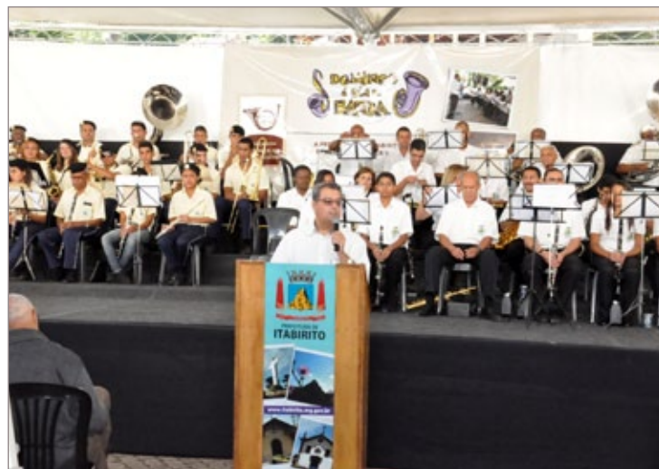
Bandas se apresentam durante o evento

Duas bandas se apresentam gratuitamente a cada evento. Neste domingo foi a vez da Corporação Musical Santa Cecília receber a Corporação e Sociedade Musical Nossa Senhora do Bom Sucesso, de Caeté.