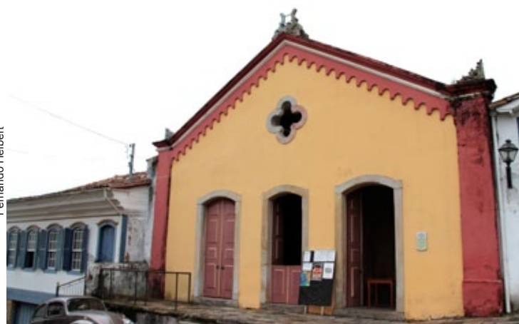
Fachada Teatro Municipal Casa da Ópera

Mais informações pelo telefone: 3559-3224.