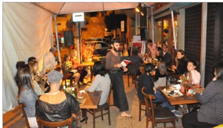
Público acompanha performance artística baseada em poemas de Verdades Temporárias