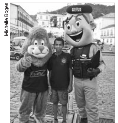
Crianças aproveitaram para tirar fotos com personagens do Proerd da Polícia Militar de Ouro Preto