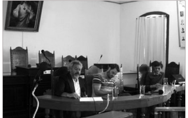
Estudiosos da Inconfidência Mineira falaram sobre o tema durante a mesa redonda que aconteceu pela manhã

Com uma programação diversificada, que aconteceu ao longo do dia, o evento teve como principal objetivo a integração dos moradores às festividades da data, que é a comemoração da liberdade pela Inconfidência Mineira. "A gente viu nos últimos anos a insatisfação de Ouro Preto com a programação oficial. Muita gente reclamando que não entra na Praça. Então, no ano passado, durante a 5ª Semana Social da Arquidiocese de Mariana, pensou-se o que se podia fazer no 21 de abril. Foi montada uma comissão e resolvemos partir para ação, não somente se opondo ao evento. Surgiu então a ideia de