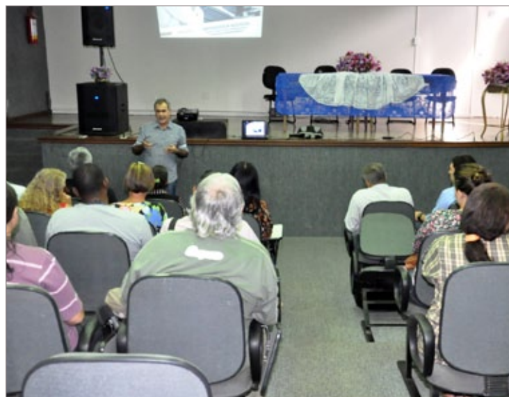
Prefeito Alex Salvador fala durante o encontro de capacitação de vendedores ambulantes

Até o fim do ano serão discutidos temas como desafios de gerenciar, elaboração de controle financeiro, pesquisas de mercado, estratégias de comercialização, atitudes empreendedoras, manipulação de alimentos e excelência no atendimento ao cliente. O objetivo é estimular e desenvolver as características individuais proporcionando