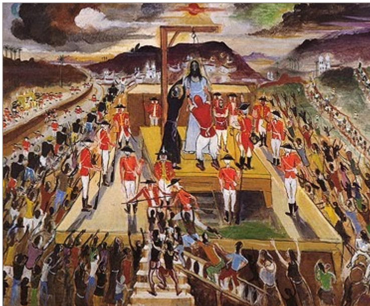
Quadro “Execução de Tiradentes” – Guignard 1961 (Coleção Particular)

Carecemos de novos representantes que promulguem uma nova inconfidência despida de sentimento neo-liberal, que combata não mais “O QUINTO”, mas uma das mais altas cargas tributárias do país.