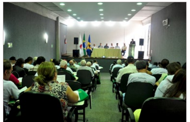
O evento ficou lotado. A Conferência contou com as presenças de diversas autoridades e de grande quantidade de agricultores e produtores rurais do município

Com o objetivo de discutir questões estratégicas relacionadas ao desenvolvimento rural sustentável e solidário de Itabirito, foram debatidas em reunião 31 propostas para a elaboração e qualificação do Plano Municipal de Desenvolvimento Rural Sustentável (PMDRS). Mais que um instrumento legal de participação popular, a Conferência significou o compromisso do poder público com os avanços necessários do sistema de produção rural.