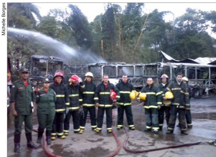
Equipe trabalha para retirada dos ônibus queimados