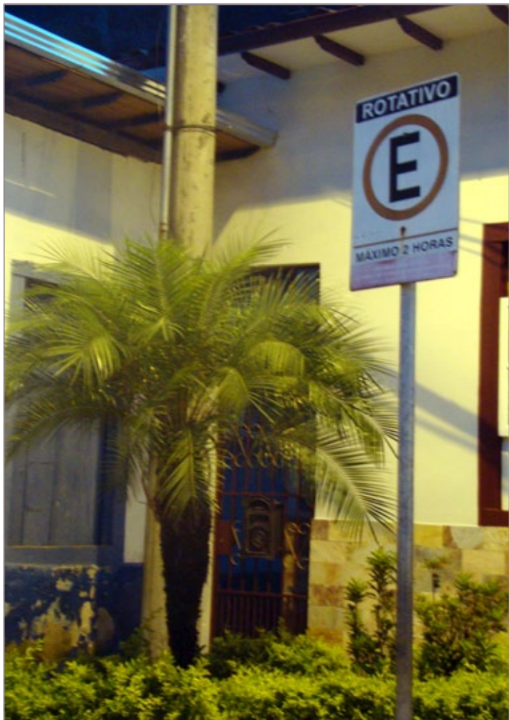
Com o fim da campanha, a utilização do estacionamento rotativo sem o talão pode gerar penalidades ao motorista