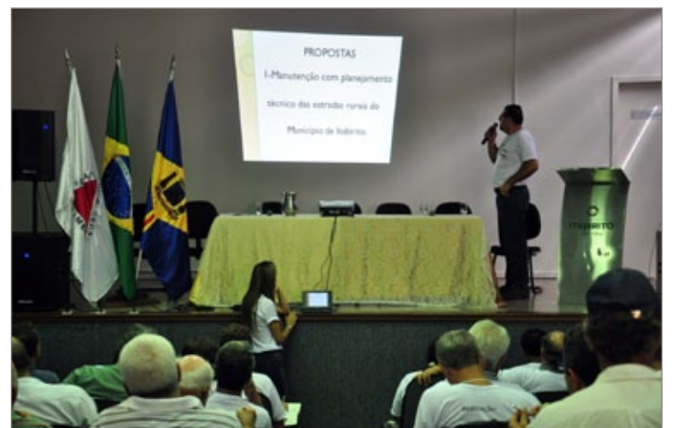
Foram debatidas 31 propostas a serem implementadas na zona rural