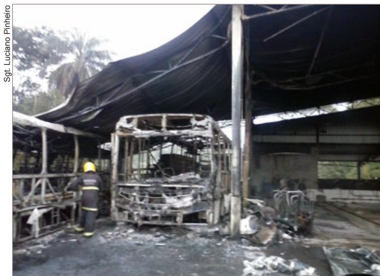
Bombeiros contaram com ajuda de caminhões pipas de parceiros da empresa para conter as chamas