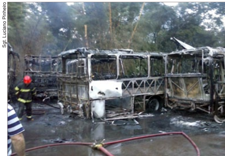
Incêndio destruiu sete ônibus e parte do galpão da garagem

A estimativa é de que o prejuízo seja de mais de R$ 1,4 milhões. Ninguém ficou ferido.