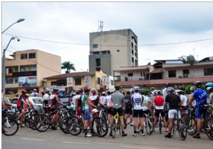
Mais de 100 ciclistas participaram da competição

A Prefeitura de Itabirito, por meio da Secretaria de Esportes e Lazer realizou a primeira etapa do Golden Biker, no último domingo, dia 13. Mais de 100 inscritos participaram da competição, na modalidade Speed e Mountain Bike. O evento começou às 9h, no Largo dos Imigrantes e teve como linha de chegada a Praça da Matriz, no distrito de São Gonçalo do Baçon.