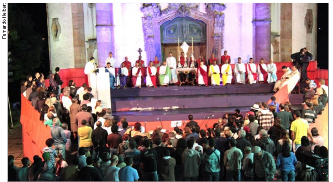
A Semana Santa de 2013 foi organizada pela Paróquia de Nossa Senhora da Conceição do Antônio Dias. Em 2014 é a vez da Paróquia do Pilar

As procissões de Ouro Preto são famosas pela piedade e pelo encanto que as envolve. Subindo e descendo ladeiras, elas sugeriram belos poemas a autores como Alphonsus de Guimaraens, Murilo Mendes, Carlos