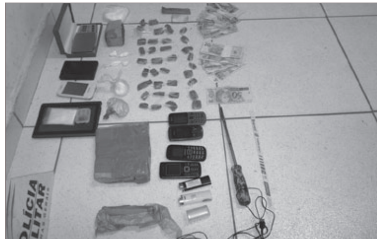
Material apreendido pela Polícia Militar durante a operação

Na busca pelos fornecedores dos alimentos a Polícia Militar localizou os donos da padaria, um casal de 50 anos, que apontaram um menor de 14 como autor do crime. O menor, que foi apreendido, delatou outros dois autores,