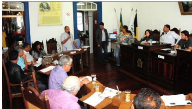
Vereadores questionam omissão do DNIT, má qualidade do atendimento da Cemig e exigem placas de identificação em obras públicas