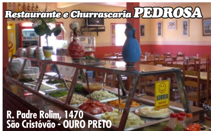
R. Padre Rolim, 1470 São Cristóvão - OURO PRETO