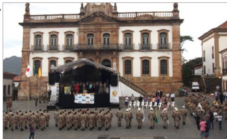
Solenidade reuniu autoridades, militares e população na Praça Tiradentes