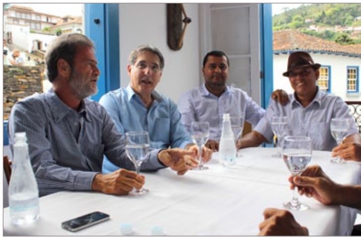
Deputado Durval Ângelo (PT); ex-ministro Fernando Pimentel (PT); presidente da Câmara de Ouro Preto, Léo Feijoada (PSDB); e vereador Dentinho da Rádio (PT)

Pimentel percorreu locais da cidade, como a Igreja São Francisco de Assis e a Igreja de Nossa Senhora das Mercês e Misericórdia (Mercês de Cima) onde realizou gravações que irão compor o vídeo produzido durante viagens por Minas.