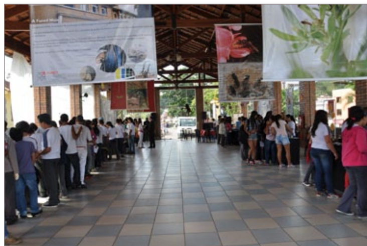
No primeiro dia de exposição, alunos fizeram fila para conhecer, de perto, cada espécie