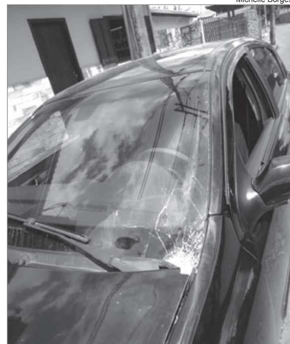
Veículo teve para-brisa danificado

Até o momento a polícia não tem nenhum suspeito. Werbert afirma que o estouro de bombas no bairro são frequentes, mas que até o momento não tinham causado nenhum dano.