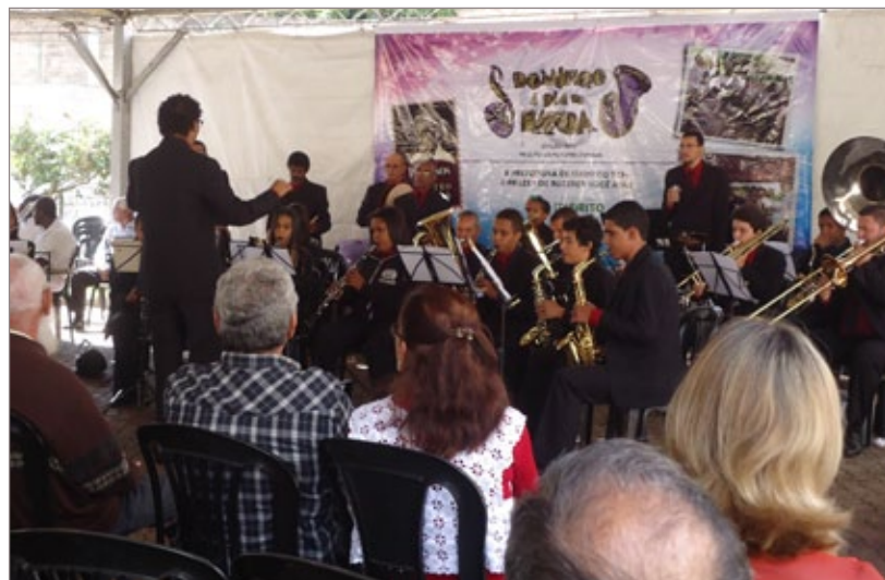
Investimentos em Cultura geram retorno para o município. Na foto, projeto “Domingo é dia de Banda”, realizado no ano passado