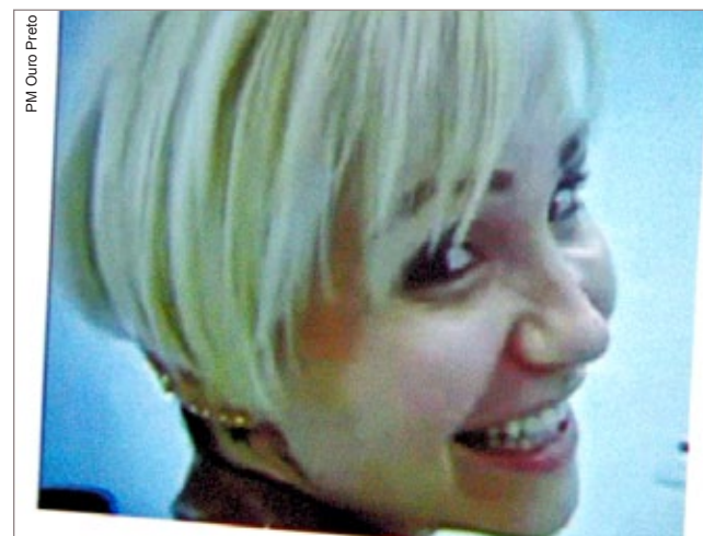
PM Ouro Preto

PÁG. 5 OURO PRETO Servidores municipais buscam melhoria nos vencimentos