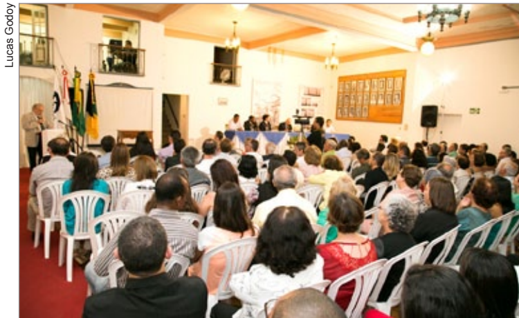
Público acompanhou a cerimônia de posse da presidência durante as comemorações dos 80 anos da Aceop

A posse aconteceu durante as comemorações de 80 da associação