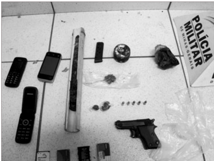
Objetos apreendidos durante a ação policial

Após busca no imóvel foram encontrados um tubo feito de bambu contendo um tablete de maconha, e a arma do homicídio, uma pistola carregada com cinco munições intactas.