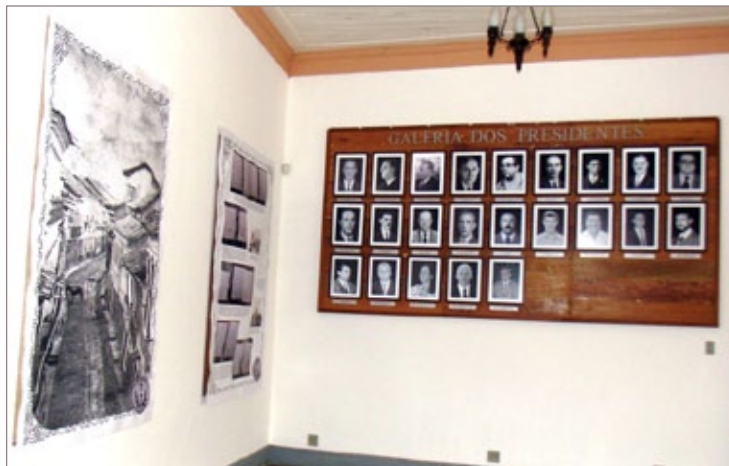
Galeria dos Presidentes. Sala com acervo fotográfico de todos os presidentes da Aceop