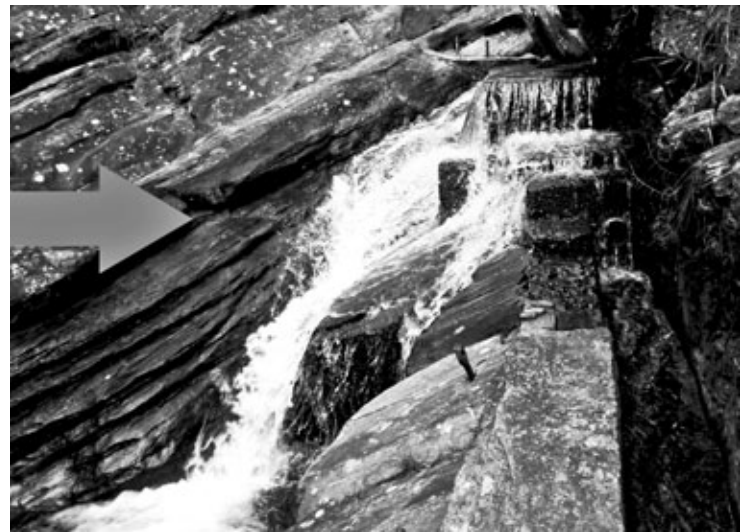
Seta indica a marca na pedra do volume de uma das captações em dias sem estiagem

to para as ações de vandalismo, que prejudicam o abastecimento, às manutenções emergenciais de possíveis rompimentos de rede, e tem redobrado a atenção para obter o pleno funcionamento dos