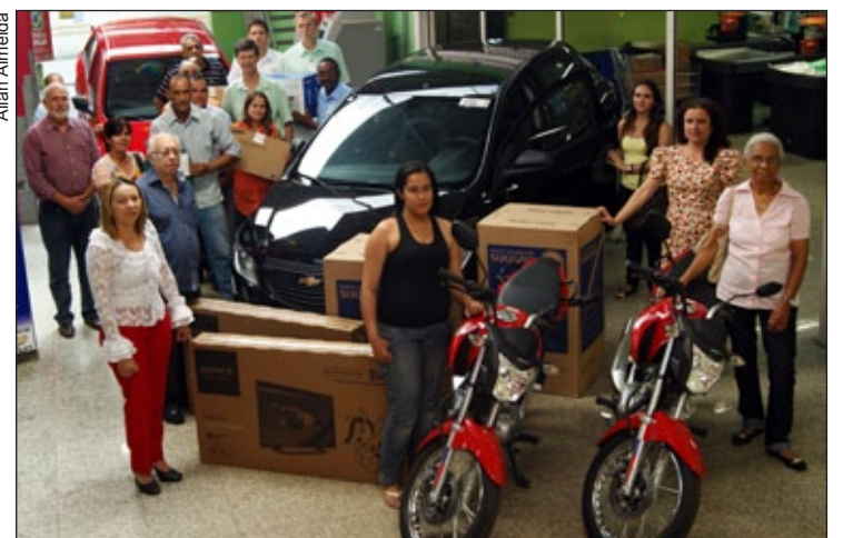
Ganhadores posam ao lado de seus prêmios

Ao todo foram retirados das lojas da Cooperouro 105.625 cupons. Já a campanha de adoção de cartinhas da Árvore Solidária arrecadou mais de dois mil e 300 presentes.