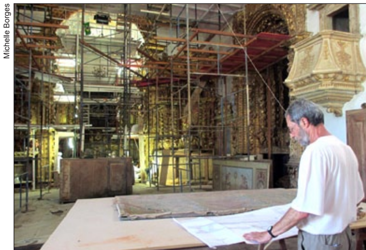
Previsão é de que as obras finalizem em abril

Para preservar o trabalho que foi realizado é preciso promover as condições ideais, como as manutenções periódicas. “É indispensável realizar limpezas, a descupinização, que é o processo utilizado para a eli-