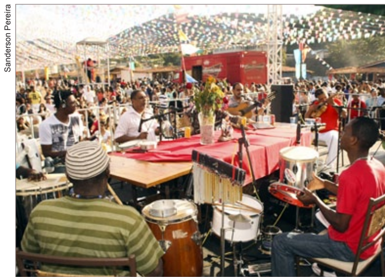
A Roda de Samba do Beco do Rato, que se apresentou no Julifest 2013, é uma das atrações do pré-carnaval de Itabirito

O prefeito Alex Salvador ressalta que o objetivo é fazer uma festa que atenda aos diferentes públicos. "Estamos trabalhando para que o pré e o carnaval de Itabirito