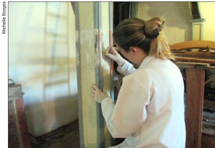
Trabalho minucioso permite descobrir pintura original