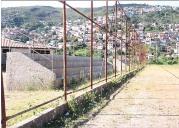
Campo do Padre Faria passará por reforma completa