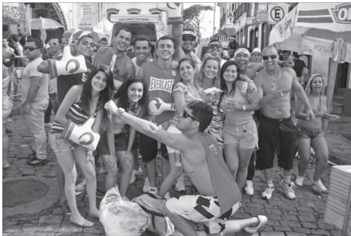
Bem na Foto, edição 2013

O projeto foi lançado no último ano e ajudou a diminuir o número de ocorrências