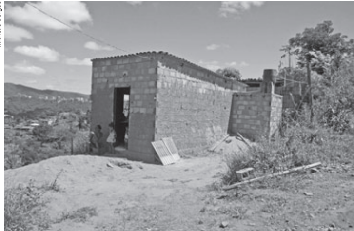
Um casebre já foi construído em um dos locais