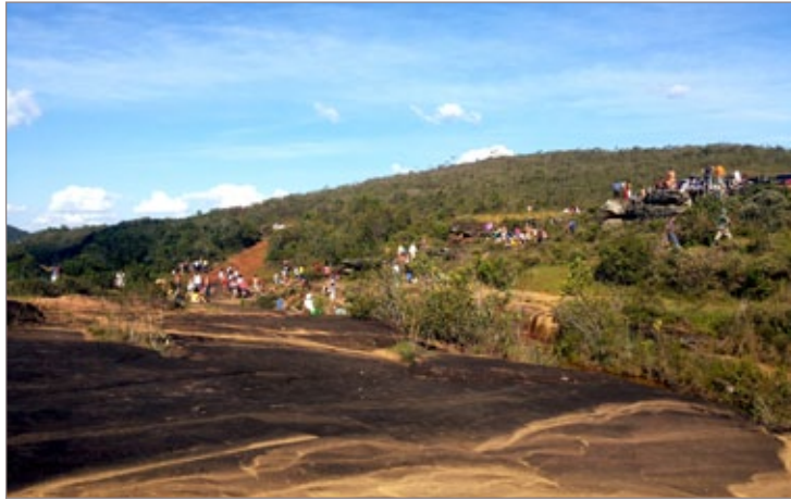
Cachoeira das Andorinhas recebe grande número de visitantes