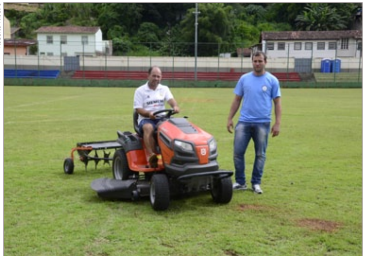
Revitalização do gramado do Campo da Água Limpa