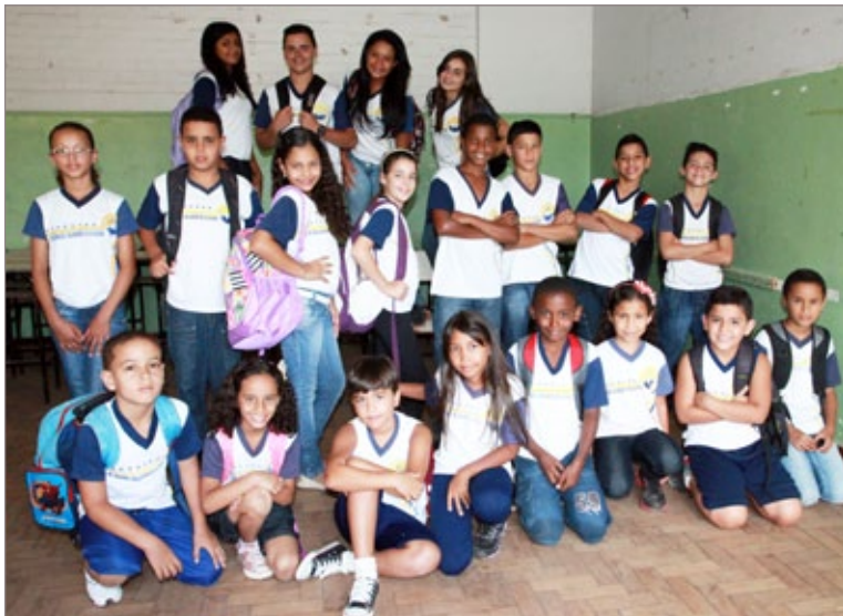
Alunos aguardam ansiosos pela inauguração da nova escola

A escola começará a funcionar no início do ano letivo, para atender alunos do 1º ao 9º ano do ensino fundamental de aproximadamente 10 bairros, da re-