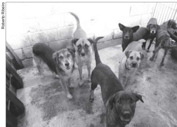
Centro de Controle de Zoonoses de Ouro Preto

Saúde, para que seja feita uma troca de posse, evitando o abandono. Quem tiver interesse em visitar ou adotar um cão, entre em contato com o Centro de Controle de Zoonose pelo telefone 3551-3891.