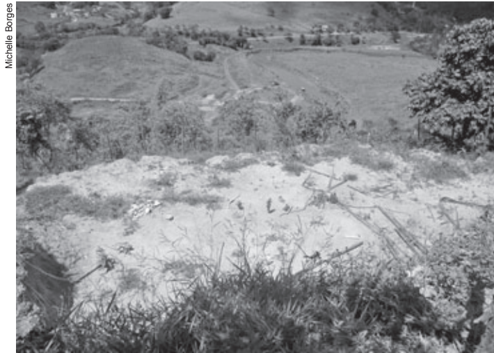
As demarcações e cercamentos estão em áreas verdes destinados à preservação