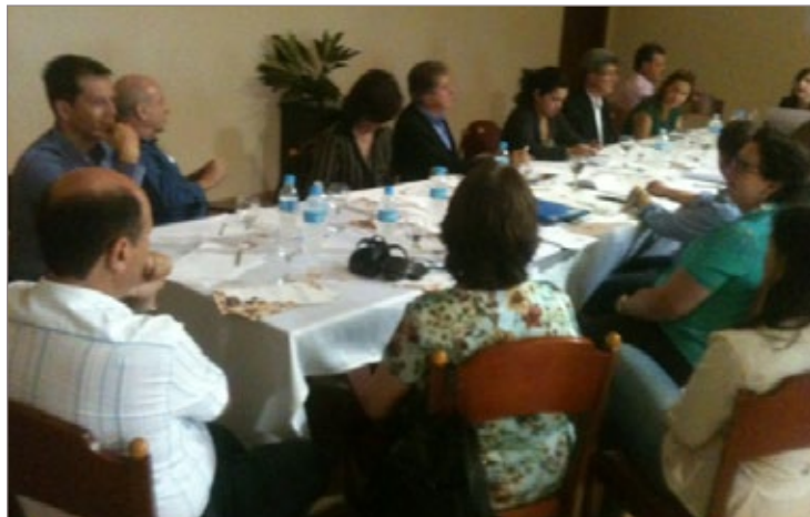
Encontro em São Miguel das Missões traçou metas para melhoria do saneamento básico, mobilidade urbana e infra-estrutura turística nas Cidades Patrimônio Mundial

O objetivo foi traçar metas na busca por recursos federais para melhoria no saneamento básico, mobilidade urbana e infra-estrutura turística para esses municípios. Nesse encontro foi estipulada a data de 18 de dezembro para que esses mesmos representantes se reúnam com o Ministério do Turismo para captação da verba e tratar das necessidades das Cidades Patrimônio Mundial.