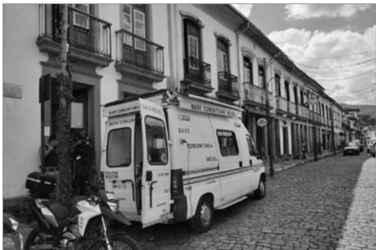
Base comunitária da PM é mantida no centro da cidade