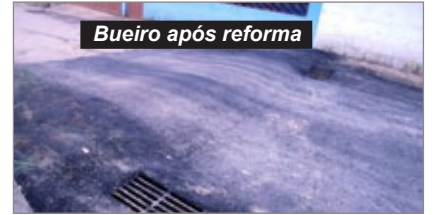
Situação do bueiro acarretava perigo para quem passava no local