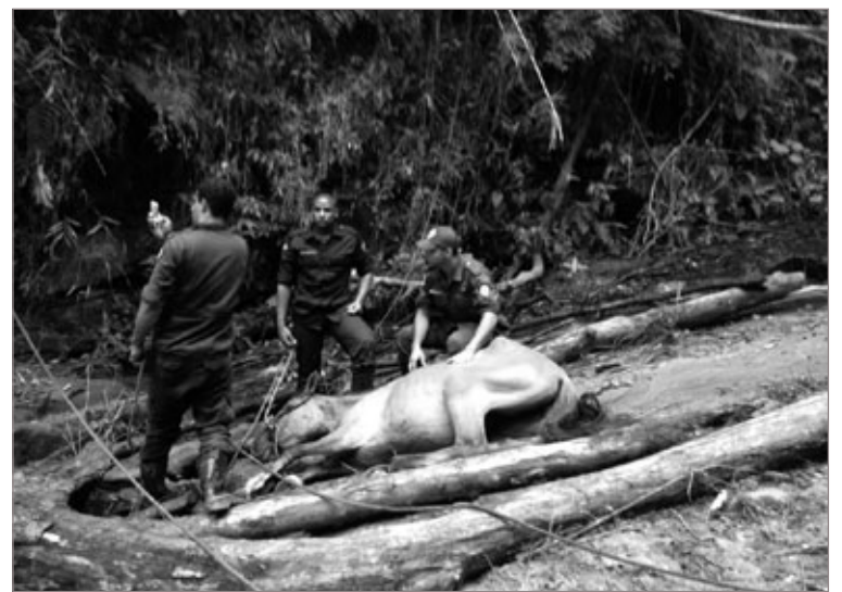
Bombeiros resgatam égua que caiu em uma cachoeira