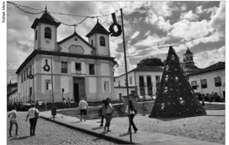
A maioria das agressões registradas ocorreu nos arredores da Praça da Sé

Com o pânico causado na cidade, alguns estudantes e representantes da comunidade organizam um abaixo-assinado para pedir providências cabíveis às autoridades. A Polícia Militar, com o apoio da Guarda Municipal, está atuando no âmbito preventivo para assegurar a tranquilidade da população diante das ocorrências até a situação ser normalizada.