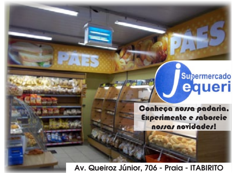
Av. Queiroz Júnior, 706 - Praia - ITABIRITO