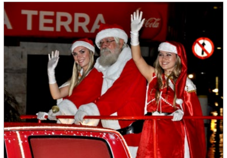
Papai Noel e suas noeletes encantaram crianças e adultos pelas ruas de Itabirito