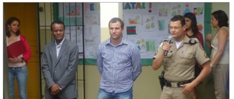
Encerramento anual do projeto “Comunidade Unida, Escola Feliz”