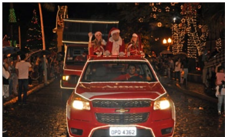
Chegada do comboio da Coca-Cola na Praça da Estação