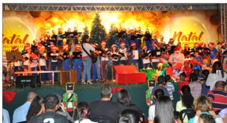
Apresentação das crianças da rede municipal