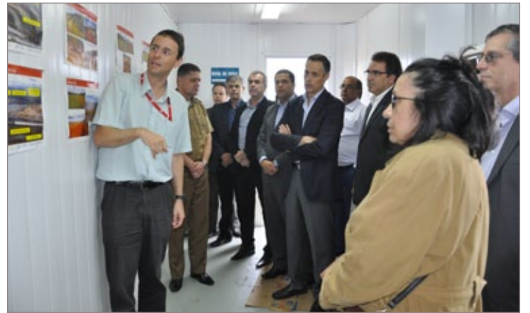
Engenheiro da Coca-Cola detalha o andamento das obras e explica como será o funcionamento da fábrica

Em janeiro de 2014 começarão os testes com o maquinário que será utilizado na produção de refrigerantes. Nesse período, o presidente da Coca-Cola, José Ramón Martínez, voltará a Itabirito para mais uma visita às instalações da fábrica.