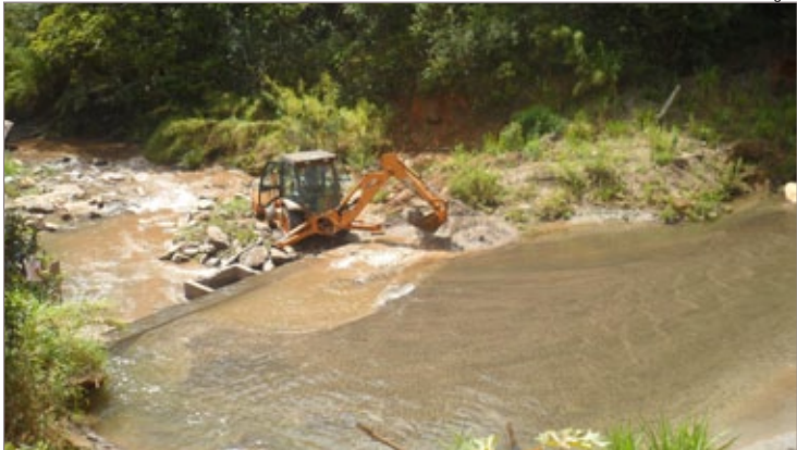
SEMAE-OP realiza limpeza da captação do Funil