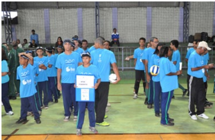
Os jogos reuniram comitivas das Apaes de seis cidades mineiras