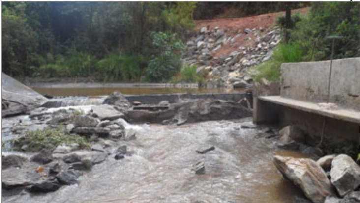
Objetivo é melhorar a qualidade do abastecimento