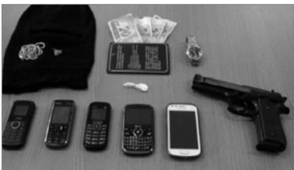
Objetos encontrados com criminosos

Na manhã do domingo (10) uma dupla foi presa sob suspeita de cometer uma série de crimes em Ouro Preto. Os homens teriam roubado e agredido duas pessoas na rua, subtraído a quantia de R$500,00 de uma farmácia do bairro Cabeças e por último, roubaram também uma república estudantil na Rua Direita, Centro. Após busca, os policiais militares encontraram os criminosos tentando se esconder no telhado e em um quarto da república. Foram encontrados com eles uma réplica de uma pistola, R$ 31,00, um papelote de cocaína, uma touca, cinco celulares, um relógio, um cordão de prata e um cordão dourado. Os autores têm 18 e 20 anos e foram levados para a Delegacia da Polícia Civil em Ouro Preto.