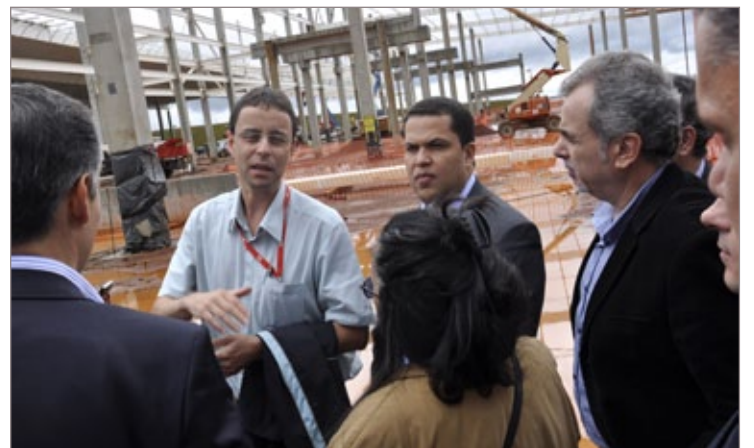
Autoridades visitam as obras da futura fábrica da Coca-Cola