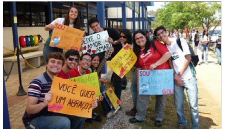
Grupo de oração universitária

As missas estão sendo realizadas todas as quintas-feiras, no horário do almoço, às 12h15min, no auditório do Iceb, Campus Morro do Cruzeiro. A Missa Universitária é breve para que os estudantes possam aproveitar o intervalo das aulas e ter tempo para o almoço e descanso. Os jovens de toda a cidade estão convidados.