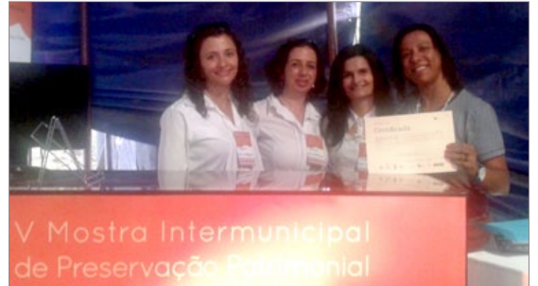
Casa do Professor conquista segundo lugar na categoria Instituição

O 1º lugar da mesma categoria também foi para Ouro Preto, com o projeto “A fê que canta e dança” da Associação Amigos do Reinado de Nossa Senhora do Rosário e Santa Efigênia (AMIREI).