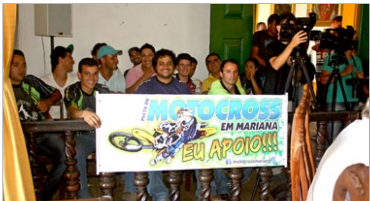
Motociclistas - primeiro passo para alcance de objetivos do grupo