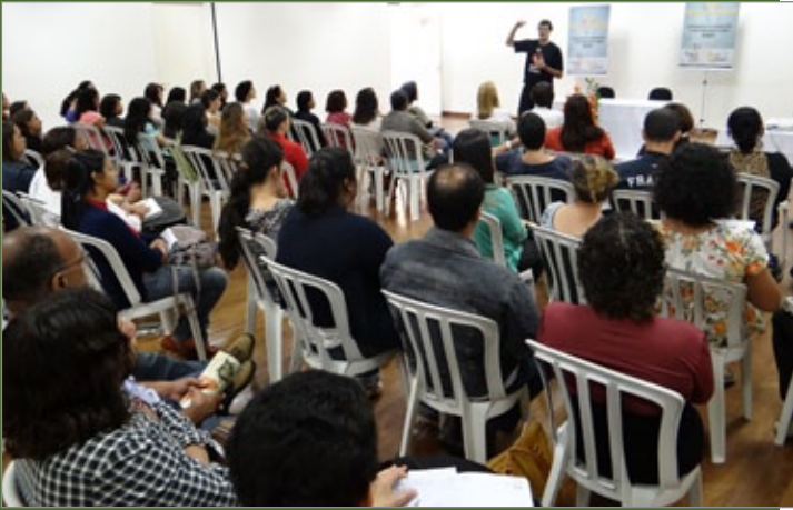
Profissionais da Secretaria de Educação da Prefeitura de Mariana participaram na manhã de terça, 29, do curso de capacitação sobre prevenção às drogas. O workshop é promovido pela equipe do programa Rede Pela Vida, projeto da Prefeitura de Mariana, em parceria com a Divisão de Prevenção e Educação da Polícia Civil de São Paulo.