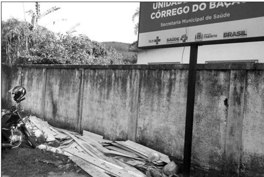
Lixo e entulho próximo ao complexo