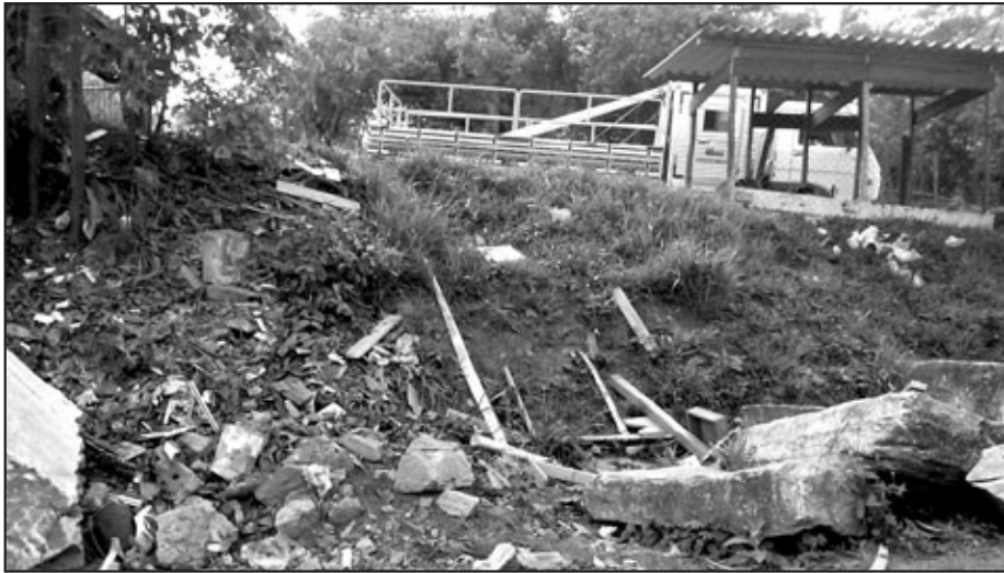
Lixo e entulho próximo à escola