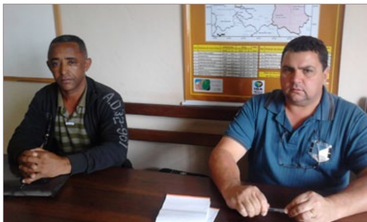
Secretário e diretor respondem dúvidas sobre situação da rua

Em meio às críticas, boa parte da comunidade comemora o asfalto que facilita o trânsito de pedestres e veículos. Muito acreditam ainda que o asfalto não atrapalha o visual colonial da cidade. A multa para o descumprimento da ordem judicial é de R$ 50 mil por dia. A prefeitura de Ouro Preto ainda não comentou a decisão do Ministério Público.