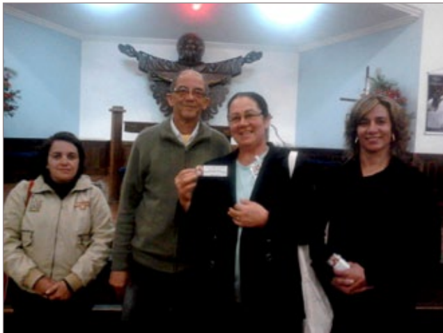
Missionários da Paróquia Cristo Rei

As casas que ainda não foram visitadas não só na Bauxita, como no restante da cidade, podem esperar a campanha missionária à qualquer momento, os voluntários estão caminhando durante todo o mês.