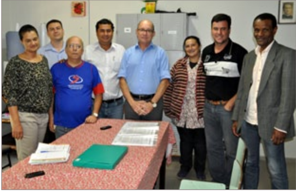
Em agosto, Prefeitura firmou parceria com Oratório Dom Bosco