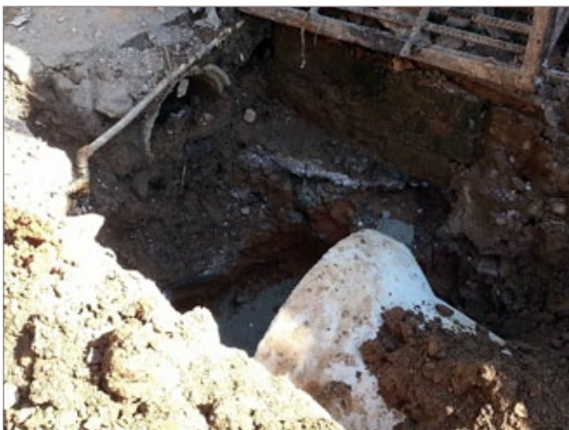
Manilhas de 25cm de diâmetro estão sendo substituídas por outras de maior capacidade para vazão da água, com 40cm