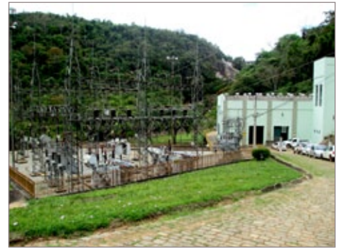
Usina Hidrelétrica da Cemig em Itabirito

A usina hidrelétrica Rio de Pedras está localizada no Rio das Velhas, afluente do rio São Francisco, a jusante da confluência com o Rio de Pedras, em Itabirito, na região central de Minas Gerais. Com o início de operação em 1907, ela possui capacidade instalada de 9,28 megawatts.