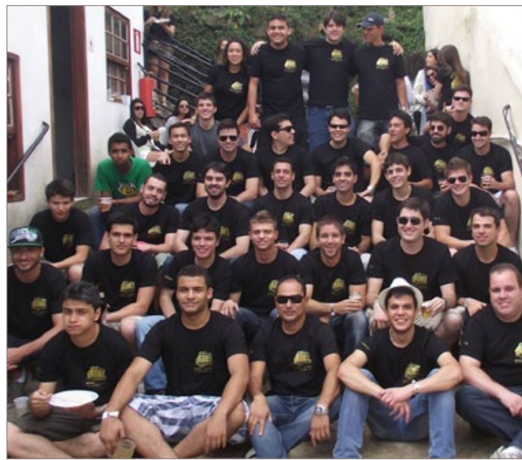
Alunos e ex-alunos da República Partenon reunidos