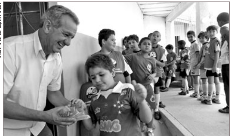
Cruzeiro do Sul Esporte Clube

Na manhã do dia 12 de outubro o Cruzeiro do Sul Esporte Clube, mais uma vez, recebeu em seu estádio a Escolinha de futebol do OPTC – Ouro Preto Tênis Clube, para festejarem o Dia das Crianças. Foi registrada a presença de aproximadamente 500 crianças, que acompanhados de pais e responsáveis, comemoraram com muitas brincadeiras, balas, pipocas, bolos de aniversário e, claro, com bola rolando o dia todo no gramado.