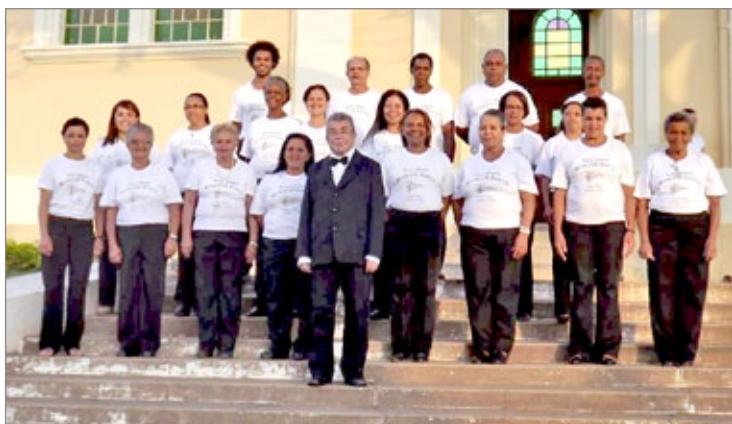
Coral Nossa Senhora do Rosário de Padre Viegas

Ainda segundo a nota, “todas as pessoas que adquiriram ingressos serão ressarcidas”. A prefeitura lamentou a decisão, que classificou de extremada, “causando tão grande frustração à população”, e adicionou “que envidará todos os esforços para a realização dos próximos shows”.