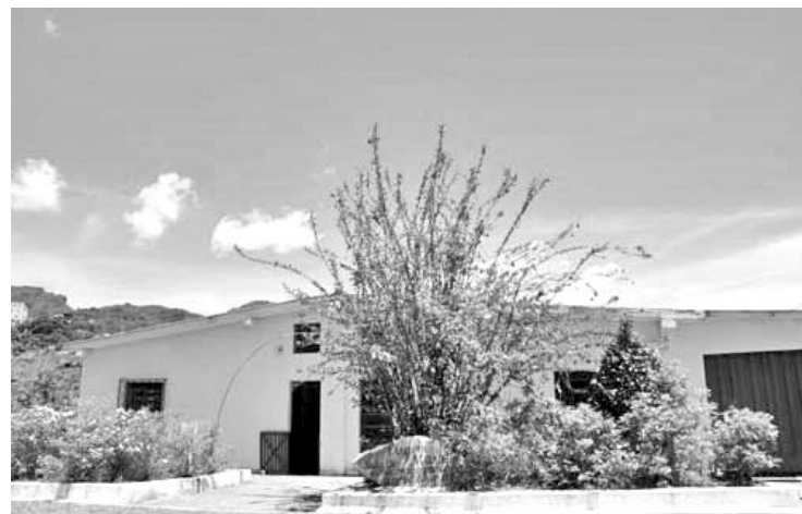
Sede da comunidade Lírios do Campo

"A instituição trabalha no sentido de ver o ser humano como um todo, em suas várias dimensões, buscando enriquecer sua qualidade de vida através da saúde física, psicológica, mental e espiritual