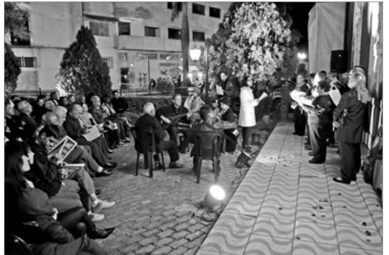
Seresta em Itabirito – uma noite de cores, luzes e música

Os arbustos foram iluminados com luzes verdes, o prédio, em estilo inglês, da Biblioteca Municipal a cada momento ficava de uma cor por causa dos efeitos de iluminação.