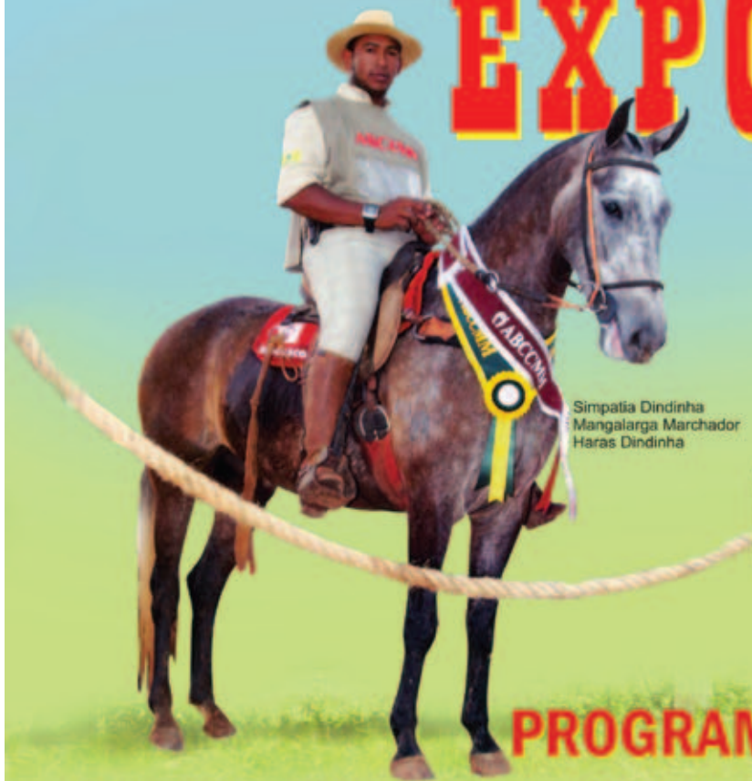
Simpatia Dindinha Mangalarga Marchador Haras Dindinha

Portinare Mandala Campolina Haras Mandala