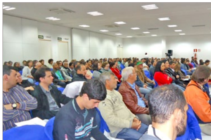
Grande público presente ao lançamento do programa de enfrentamento às drogas