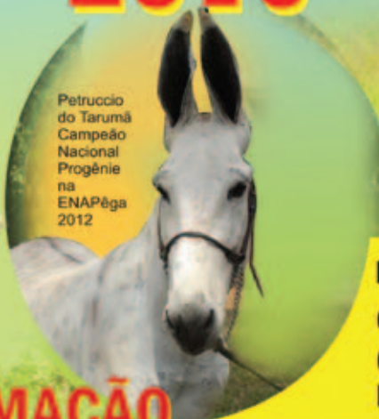
Petruccio do Tarumã Campeão Nacional Progenie na ENAPêga 2012