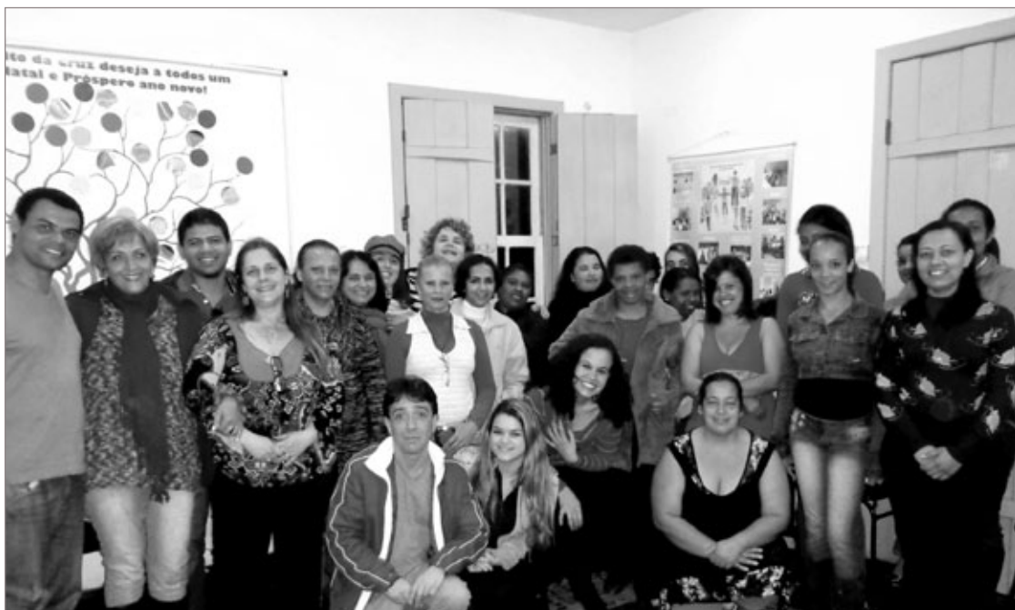
Curso de Camareira, no Alto da Cruz

As alunas que preencherem satisfatoriamente as metas estabelecidas receberão certificados do Nucát UNESCO.