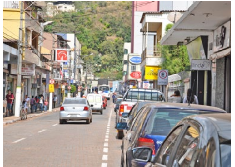
O horário de funcionamento do comércio de Itabirito será estendido, a partir do dia 1º de agosto