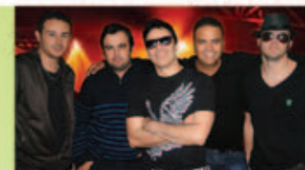
Banda UAI PODE (Belo Horizonte)