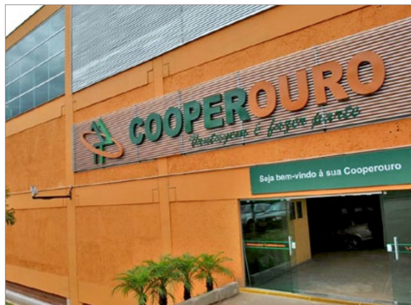
Atendendo a pedidos de cooperados, o sorteio acontecerá dia 4 de agosto na Cooperouro Mariana

Atendendo a pedidos dos cooperados, a Cooperouro prorrogou a promoção “Cooperouro 33 anos”. Agora, o Cooperado pode retirar seus cupons e depositá-los nas urnas até o dia 03 de agosto para concorrer a 33 vale-compras de R$1 mil, cada. A cada 100 reais em compras, o Cooperado ganha um cupom. O sorteio acontece dia 04 de agosto, às 11h, em novo local: Cooperouro Mariana. Atrações especiais estão sendo preparadas para os cooperados da cidade que forem prestigiar o sorteio, dentre elas uma mini rua de lazer para as crianças. Não fique de fora dessa promoção!