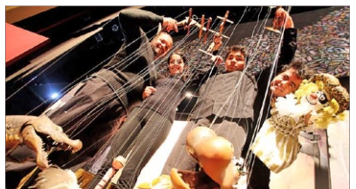
O espetáculo infantil 'O Carnaval dos animais' será apresentado neste fim de semana