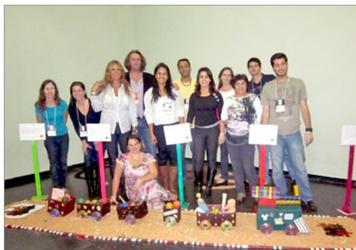
Equipe do CAPSi de Ouro Preto