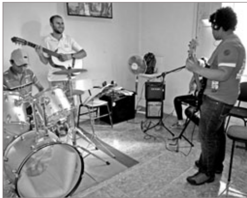
Oficina de música da Casa do Adolescente

A instituição, que já atendeu cerca de 6 mil adolescentes durante seus 13 anos de existência, agora aguarda pelo fim das construções de sua nova sede no bairro Padre Eustáquio.