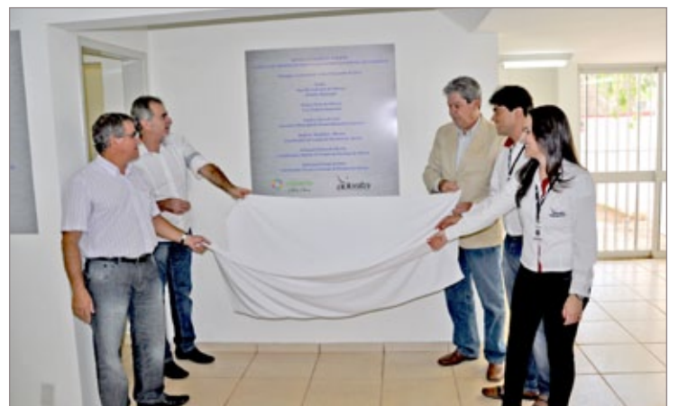
A reabertura da Adesita aconteceu na última quarta-feira

Na última quarta-feira, dia 18, aconteceu a reabertura da Agência de Desenvolvimento Econômico e Social de Itabirito (Adesita), responsável por orientar empreendedores, atender os empresários do município com serviços de pesquisas, plano de negócios e oferecer consultoria às micro, pequenas e médias empresas do município.