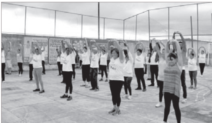
Grupo de Atividades Físicas do Nasf

O Nasf é dividido em nove áreas estratégicas, sendo elas: atividade física, práticas integradas e complementares, reabilitação, alimentação e nutrição, saúde mental, serviço social, saúde da criança, do adolescente e do jovem, saúde da mulher e assistência farmacêutica. A prioridade de atendimento é para usuários e famílias encaminhadas pelo Programa Saúde da Família.