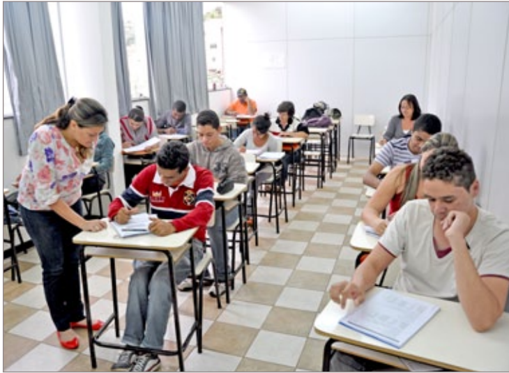
Curso de auxiliar administrativo no Cepep

O que não faltam na comunidade são exemplos bem sucedidos de pessoas que tiveram a oportunidade de se especializar e acabaram sendo referências de sucesso na vida profissional, como por exemplo, a doceira que apostou no próprio talento e se tornou dona de confeitaria ou aquela costureira que todo mundo elogiava e, um dia, investindo na própria capacidade, entrou de sócia numa confecção. Histórias assim não são raras e seus protagonistas sempre têm algo em comum: o estímulo e incentivo resultantes dos cursos de capacitação oferecidos pelo Cepep (Centro Público de Educação Profissional) em parceria com o Senac.