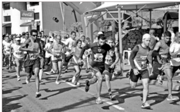
A 2ª etapa da Corrida de Rua acontece neste sábado, às 19h