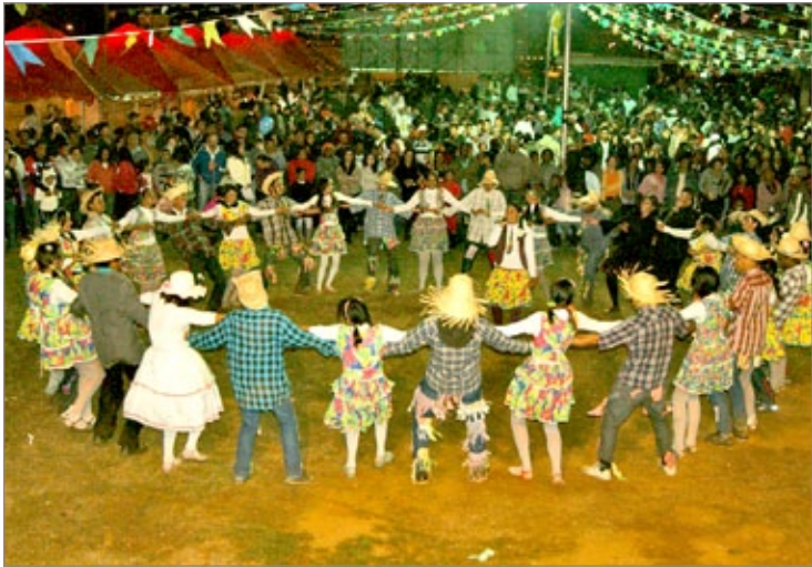
Grande público prestigiou as atrações do 13º Arraial da Cooperação