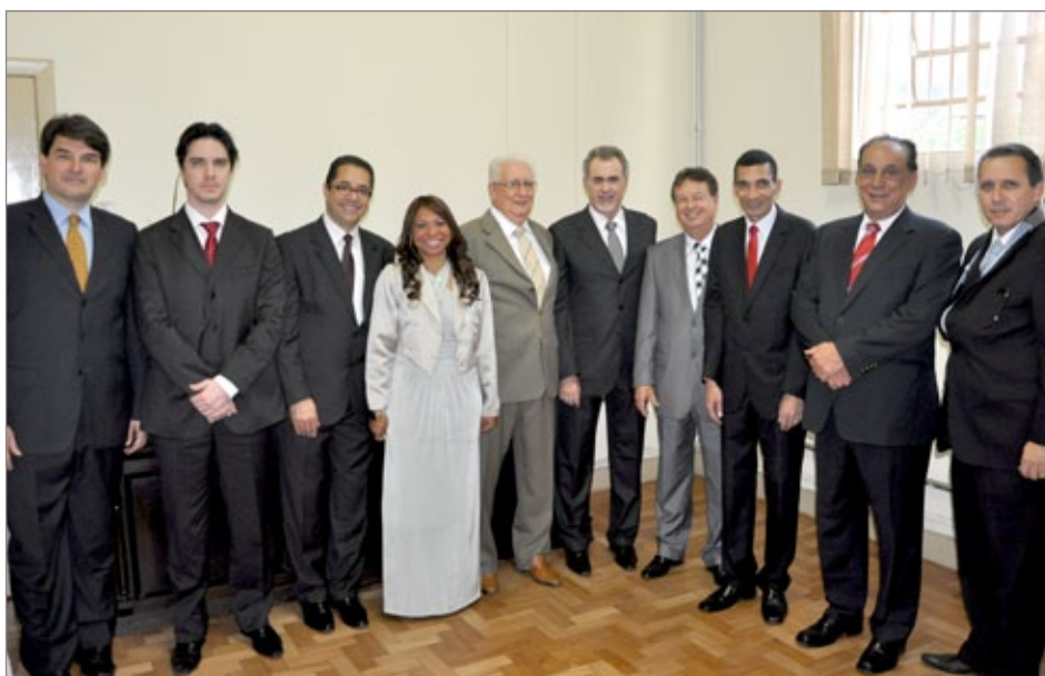
Foi instalada a 2ª Vara Cível, Criminal e de Execuções Penais da comarca de Itabirito