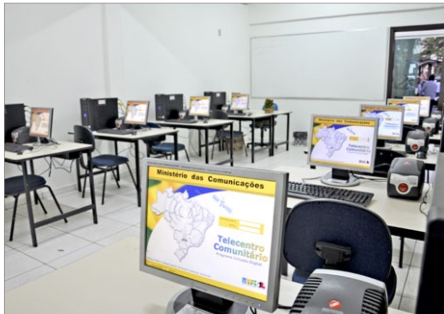
Sala do Telecentro pronta para receber a população