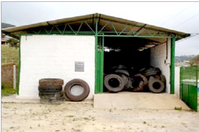
Ecoponto em Ouro Preto

O encaminhamento pode ser feito por qualquer pessoa desde que sejam pneus de bicicleta, motos, carros de passeio e caminhões comuns. O Ecoponto fica localizado na Rua Jorge Caran, nº 40, Bairro Nossa Senhora do Carmo (próximo à Cooperouro), mais informações pelo telefone 3559-3236.