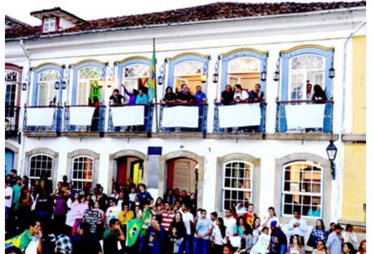
Câmara de portas abertas e com bandeiras brancas na sacada durante a manifestação em Ouro Preto II

Audiência Pública – A Comissão de Direitos Humanos da Câmara de Ouro Preto informa que a Audiência Pública sobre “Abordagem Policial: Abuso de Autoridade” que estava agendada para a última quarta-feira (19) foi remarçada para o segundo semestre de agosto.