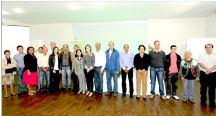
Proponentes dos projetos aprovados pelo 3º Edital do Ambiental com representantes da Novelis e autoridades

Na área de ensino, um dos destaques do terceiro edital do Programa Ambiental é o projeto “Ciência para Educação e Sensibilização Ambiental – Círculos de Sustentabilidade”, do Departamento de Computação (DECOM), da Universidade Federal de Ouro Preto (UFOP), que buscou fortalecer o vínculo entre a pesquisa e a inovação acadêmica, difundindo a prática da sustentabilidade nas comunidades de atuação, por meio da produção de conteúdo didático para o ensino, realização de seminários, oficinas, além de outras ações voltadas para o tema reciclagem, e a criação de um perfil no Facebook para ampliar a divulgação do conteúdo criado.