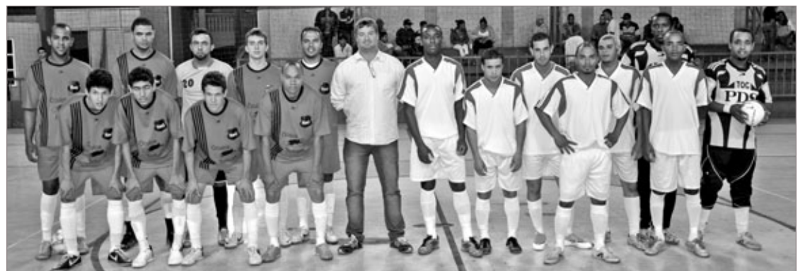
A Taça Cidade Ativa de Futsal 2013 reúne 24 equipes nesta edição