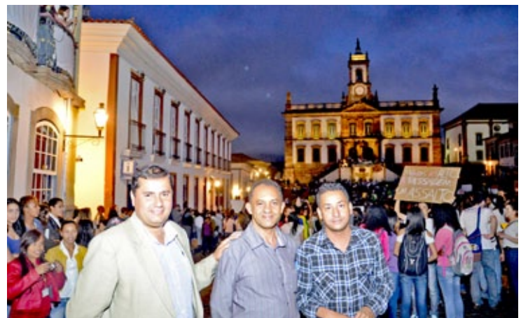
Vereadores presenciaram, na rua, o Ato Público de Ouro Preto