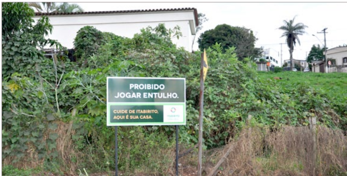
Prefeitura de Itabirito lança campanha Cidade Limpa e começa a instalar placas de conscientização

O próximo bairro a ser beneficiado será o Monte Verde. Depois (também da região do São José) os bairros São Matheus, Liberdade, Floresta, Pedra Azul, Monte Verde e Novo Itabirito terão o benefício. Na sequência, os bairros Nossa Senhora de Fátima, Santo Antônio, Vila José Lopes, Padre Adelmo e São Geraldo também serão atendidos. A população deve ficar atenta para não "comer mosca" e perder o bota-fora.