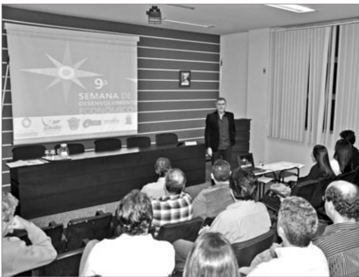
Abertura da 9ª Semana de Desenvolvimento Econômico

As vendas de estandes já se iniciaram, os interessados devem entrar em contato com a Adesita através do telefone 3563-1958.