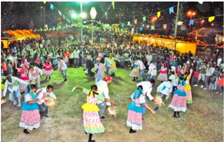
Em 2012, o Arraial da Cooperação reuniu cerca de duas mil pessoas em Ouro Preto