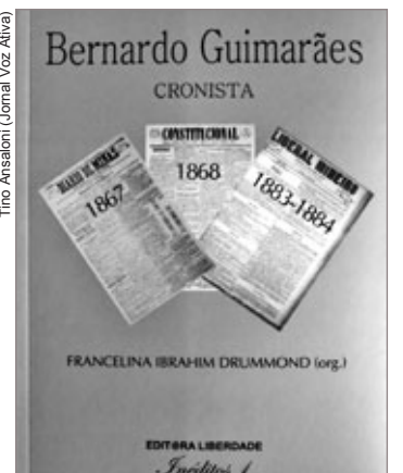
Capa do livro Bernardo Guimarães cronista