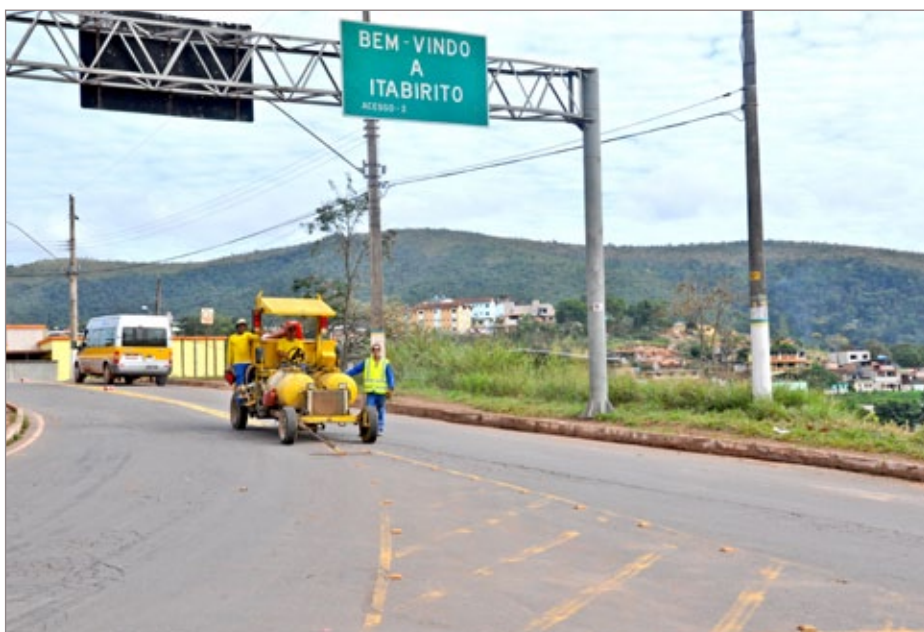
A Prefeitura de Itabirito já fez a sinalização viária em parte da BR e nos bairros próximos do acesso 2