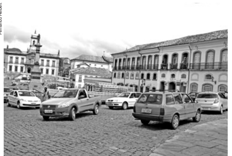
Circulação de veículos em Ouro Preto

A reunião acontece a partir das 8h, na Câmara Municipal de Ouro Preto, localizada na Praça Tiradentes, 41 - Centro.