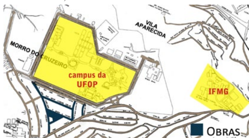
Locais que serão interditados para realização das obras nos próximos dias

Fique atento! Confira no mapa as primeiras ruas a receberem obras.