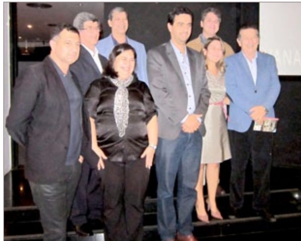
Autoridades durante lançamento do Festival de Inverno

Serão 24 dias de programação, voltadas às artes cênicas, artes visuais, artes plásticas, música, infanto-juvenil, literatura e patrimônio. O evento acontecerá entre os dias 5 e 28 de julho.