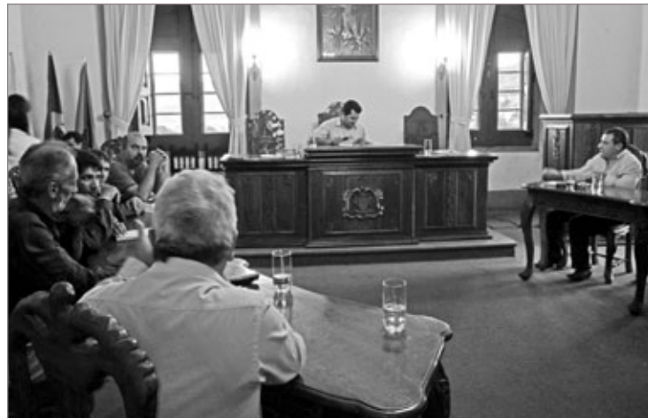
Vereadores pedem a presença de representante dos Correios na Câmara

Comunidade e vereadores aguardam a presença do representante na câmara para esclarecer estes fatos.