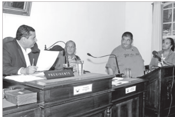
Moradores do Soares reivindicam benfeitorias na localidade