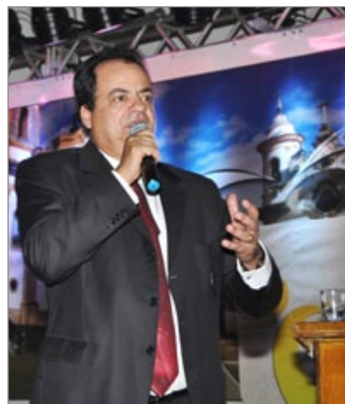
O prefeito Celso Cota enfatizou que foram dias produtivos e de muito trabalho

A Prefeitura de Ouro Preto, por meio da Secretaria de Educação, realiza hoje, sexta-feira (14), a Conferência Municipal da Educação. Durante a reunião, serão escolhidos representantes do Município para a etapa Regional do evento que acontece em Mariana, no dia 26 de junho. Além disso, serão abordados tópicos a serem discutidos na Conferência Nacional. Estão convidados a participar da conferência em Ouro Preto, representantes do poder público, segmentos e instituições educacionais, incluindo professores, servidores, alunos e pais de alunos, além de setores sociais. A reunião acontece, de 14 às 17h, no Centro Social da Família Ouro-Pretana (Cesfo), localizado na Praça Monsenhor Castilho - Pilar.