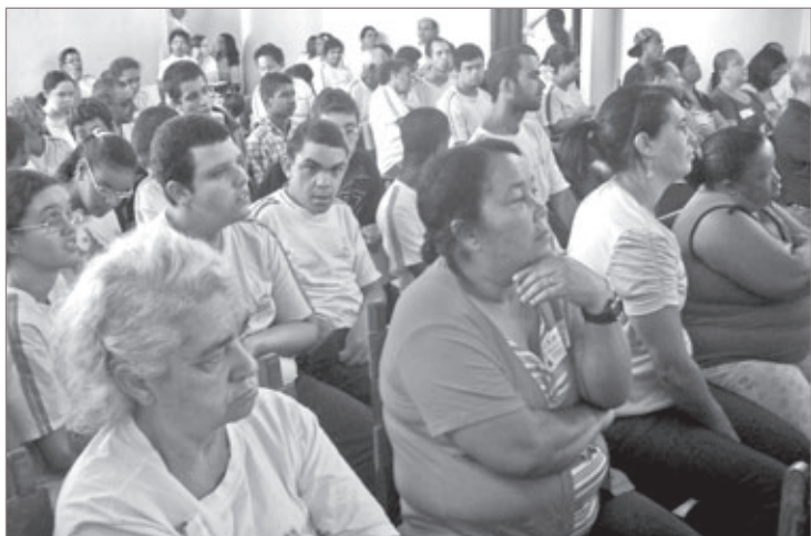
Portadores de necessidades especiais e pais participam de programa de autodefesa