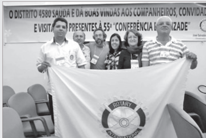
Rotary Club de Itabirito: Itabirito marcou presença na convenção do Rotary realizada na cidade de Caxambu de 17 a 19 de maio

A Escola de Formação de Pais tem como metodologia aulas teóricas onde os pais recebem informações sobre os diferentes temas; momentos de reflexão sobre as informações adquiridas, sua aplicação e posicionamentos pessoais frente a elas; estudo de casos, vivências, pesquisas bibliográficas, filmes, dentre outros.