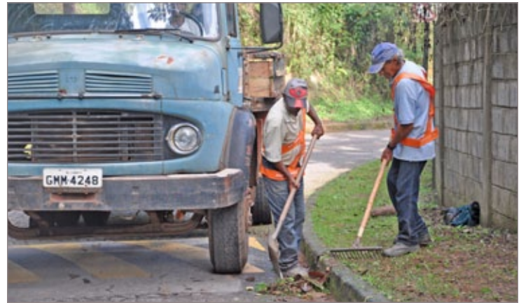
Capina no bairro Santa Tereza