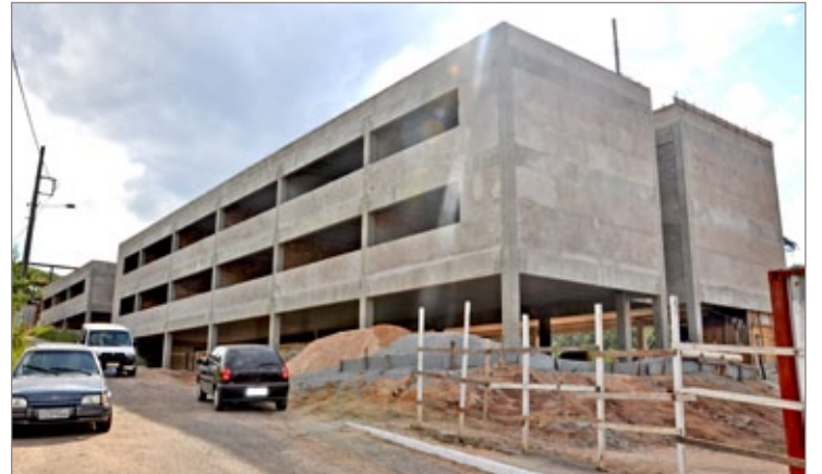
Escola do São José