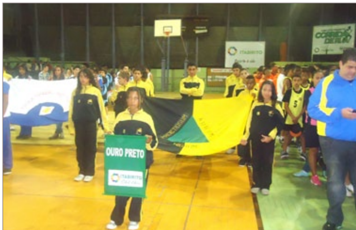
Atletas representantes de Ouro Preto na cerimônia de abertura da Etapa Microrregional dos Jogos Escolares

Os Jogos Escolares de Minas Gerais é uma competição esportivo-educacional para escolas com alunos do ensino fundamental e médio, dos 853 municípios. No estado, mais de 160 mil estudantes disputam os Jogos que são divididos em etapas municipal, microrregional, regional e estadual.