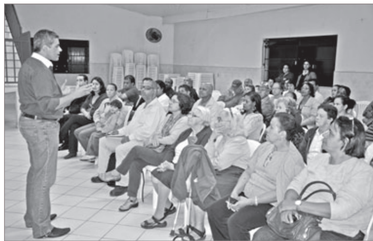
Pré-conferência de Saúde na Vila Gonçalo

Mas não são somente de propostas das pré-conferências que se faz um documento consistente. As diretrizes da campanha do prefeito Alex Salvador e as novas propostas que surgirem na conferência, se aprovadas por votação, também farão parte do documento final.