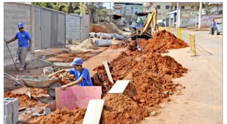
Obras de Drenagem na Avenida dos Inconfidentes