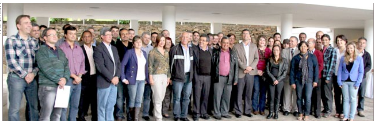
Autoridades e representante das cidades associadas