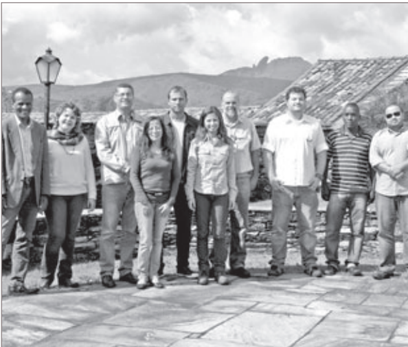
Secretários se reúnem com representantes da empresa Vale