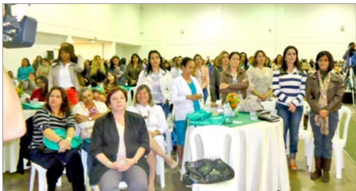
No último sábado, 18 de maio, a Igreja Evangélica Peniel, de Mariana reuniu as mulheres, e muitas convidadas, para ouvir palestra de louvor e graça

Instituto de Ciências Sociais Aplicadas da UFOP promove II Semana de Integração. A II Semana de Integração iniciada dia 20, termina hoje, 24 de maio, nas dependências do Instituto de Ciências Sociais e Aplicadas (ICSA-UFOP), localizado em Mariana.