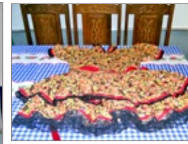
Artesanatos realizados pelos moradores