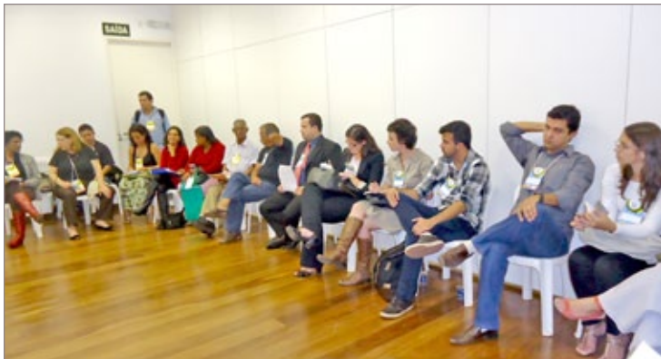
As propostas surgiram com as discussões das necessidades da cidade

melhoria da qualidade dos serviços prestados à população.