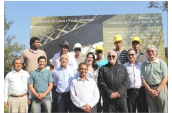
Novelis, autoridades, comunidade e trabalhadores da obra