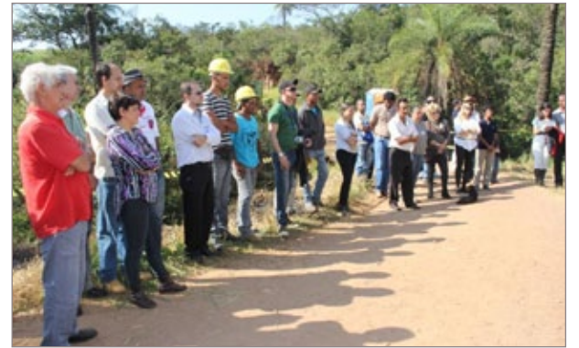
Lançamento do canteiro de obras para restauração do Conjunto de Pontes Ana de Sá