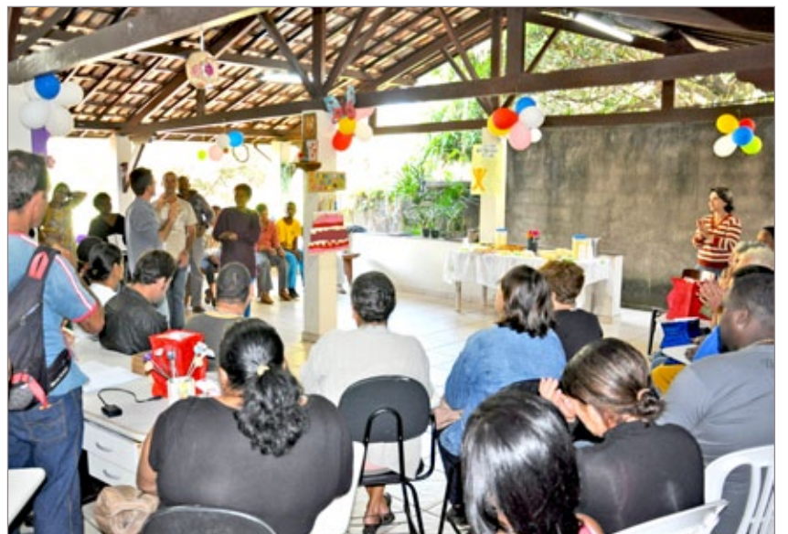
Festa no Caps

que possamos realizar esse desejo de Itabirito. A cidade, os pacientes e as famílias, definitivamente, merecem”, disse o prefeito.