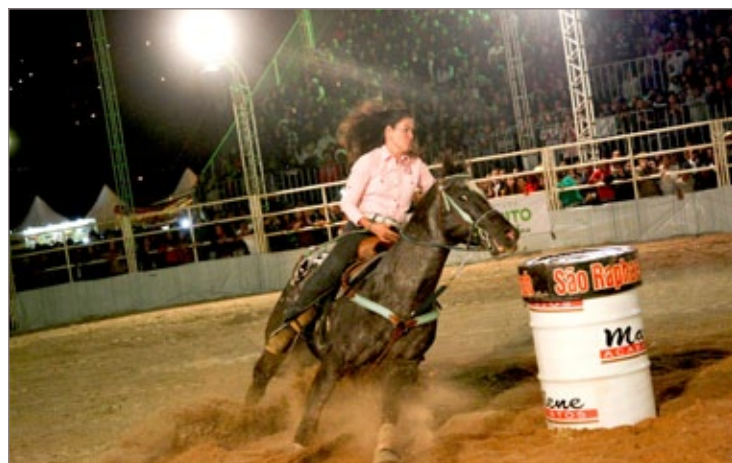
Prova feminina dos três tambores