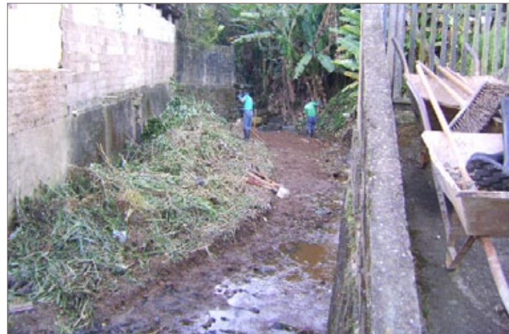
Prefeitura de Ouro Preto inicia limpeza de córregos

A Secretaria de Meio Ambiente pede aos moradores que acompanhem a execução dos serviços e informem a Administração Municipal caso a qualidade dos serviços não esteja atendendo às expectativas.