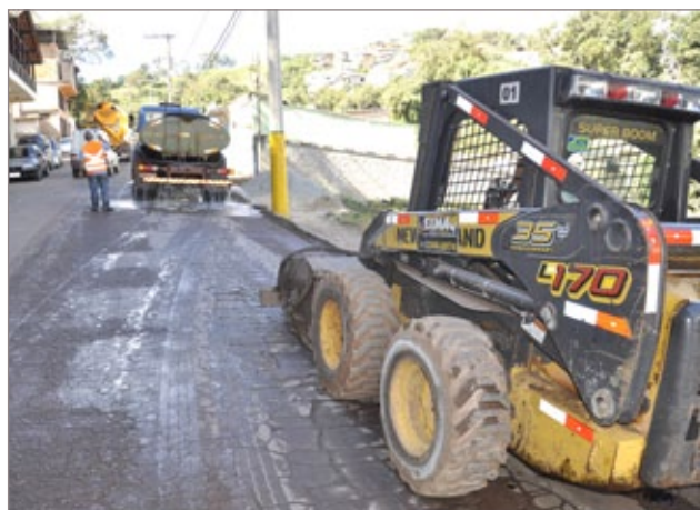
Caminhão pipa e minicarregadeira. Ações para deixar a cidade mais limpa