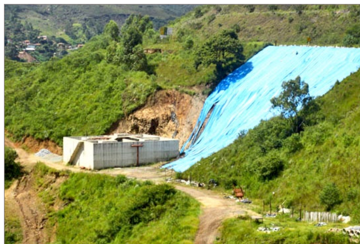
Região conhecida como Osso de Boi