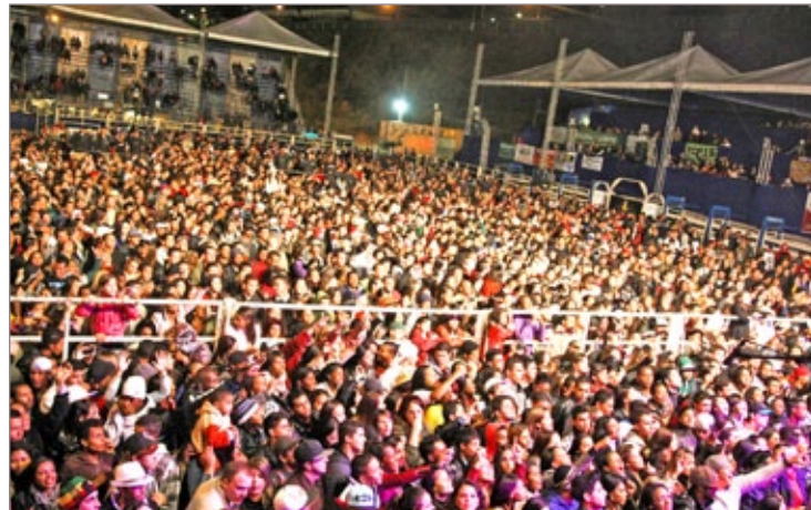
Público lotou a arena no Itabirito Rodeio Festival

Um dos momentos mais esperados do Itabirito Rodeio Festival foi o show do cantor Naldo, que animou o público com o funk melody no último dia de festa. “Hoje, a sensação aqui é de alegria e realização. É super bacana levar a minha música para esse público que curte também a música sertaneja. Sinto como se estivesse ultrapassando uma barreira. É uma grande conquista”, comemorou Naldo.