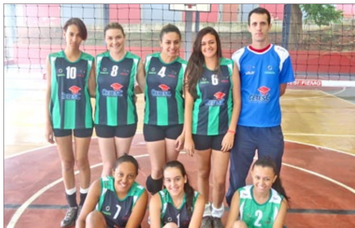
Equipe de vôlei feminino disputou os Jogos de Minas em João Monlevade

A Prefeitura de Itabirito garantiu a participação de oitenta atletas das equipes de futsal masculino e feminino, handebol masculino, vôlei feminino e basquete masculino nos Jogos de Minas 2013. Neste ano, os jogos foram realizados no município de João Monlevade entre os dias 1 e 5 de maio. O evento tem o objetivo de potencializar o esporte de rendimento, identificar os talentos esportivos e estimular a prática esportiva.