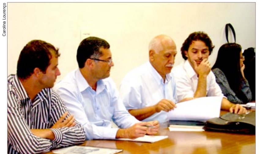
Prefeito e secretários se reúnem com Grupo de Desenvolvimento de Antônio Pereira

Durante a reunião, a Prefeitura informou que algumas das obras solicitadas já estão em processo de licitação ou aguardando recursos. Uma delas é a construção de uma estação de tratamento de esgoto (ETE) que está prevista para ser construída próximo à lagoa do Jacaré. Também serão implementados uma Unidade Básica de Saúde (UBS) e mais uma equipe de Saúde da Família, por meio do projeto de reurbanização de Antônio Pereira.