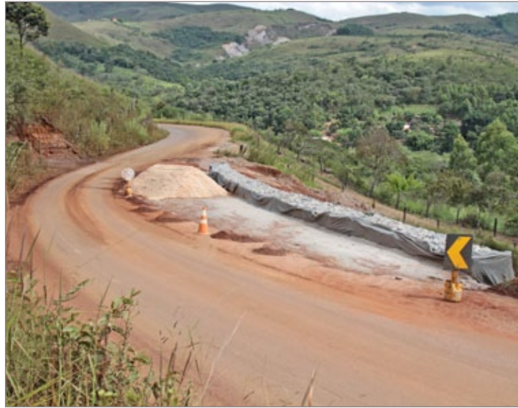
Prefeitura faz intervenções na estrada de Rodrigo Silva