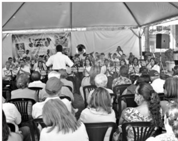
Com a retomada do projeto Domingo é dia de banda a Praça da Estação ficou lotada