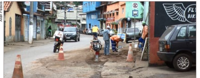
A Prefeitura de Mariana realizou, na semana passada, a recuperação de parte da calçada e pista da Rua do Catete - local próximo ao Instituto de Ciências Sociais Aplicadas (ICSA). A obra serviu para impedir o aumento da erosão que atingia a via e comprometia o tráfego de pedestres e automóveis.