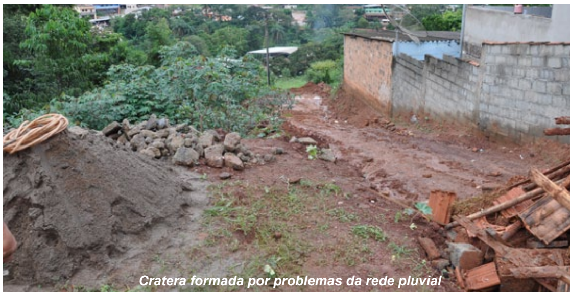
Cratera formada por problemas da rede pluvial

Obras de extensão da rede pluvial foram feitas também no Novo Itabirito, São José, Vila Gonçalo e Nossa Senhora de Fátima. Brevemente, começarão na Rodovia dos Inconfidentes (Santa Efigênia), Cardoso e Santo Antônio.