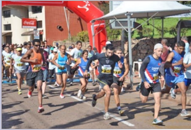
Atletas vencedores da Corrida de rua em Itabirito