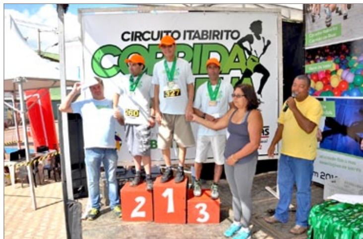
Os atletas da ADI subiram ao pódio e comemoram a vitória