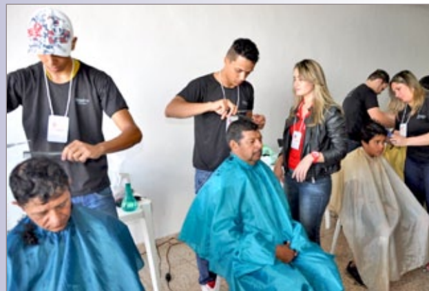
Praça da Cidadania atende 4,5 mil pessoas em Itabirito