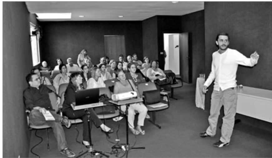
Psiquiatra conversa com participantes do Grupo de Tabagismo e profissionais da Saúde

Itabirito é destaque no estado pelos resultados alcançados nos Grupos de Tabagismo