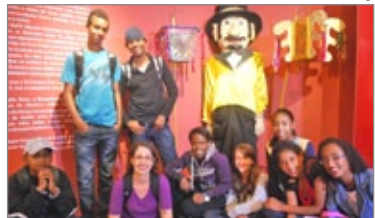
Alunos do Projeto "Lavras Novas: nosso patrimônio" durante atividades educativas

pessoas da própria comunidade. A noite de estréia também será marcada com a apresentação da Folia de Reis e do grupo de capoeira Lavras de Ouro.