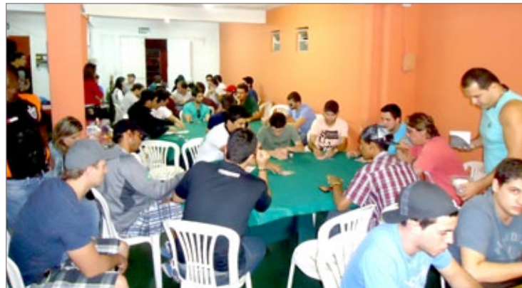
Primeira etapa do Ouro Preto Series of Poker reuniu quase meia centena de jogadores