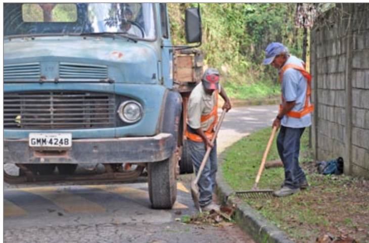
Parte dos trabalhadores que estão atuando no Santa Tereza

De acordo com a Prefeitura são exemplos de materiais que não têm utilidade: latas, plásticos, móveis velhos, restos de construção, de podas, etc. A partir do dia 15 de abril será a vez do bairro São Geraldo. “É essencial que a população desses bairros colabore não deixando de colocar os materiais que não têm utilidade para fora de casa. É uma questão de organização e de saúde pública. É o retorno de serviços es-