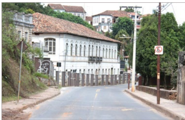
Saída do túnel será na rua Padre Rolim, próximo à antiga Santa Casa