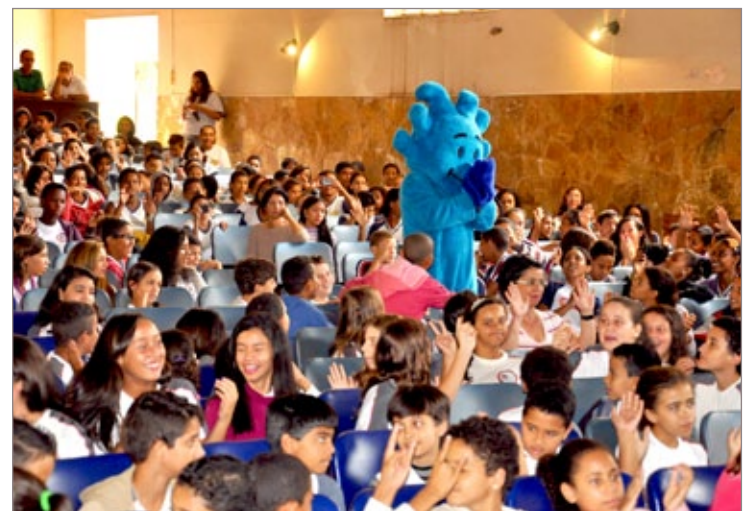
Uma das mascotes do SAAE anima a criançada Prefeitura de Itabirito promove formação para educadores das creches

Na festa do Cine Pax, foi apresentada a encenação teatral "Espetáculo e