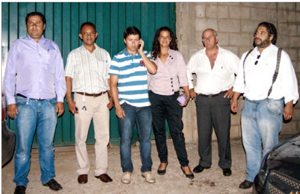
Vereadores da Câmara de Ouro Preto vão à sede da Concessionária da Coleta de Lixo no Município