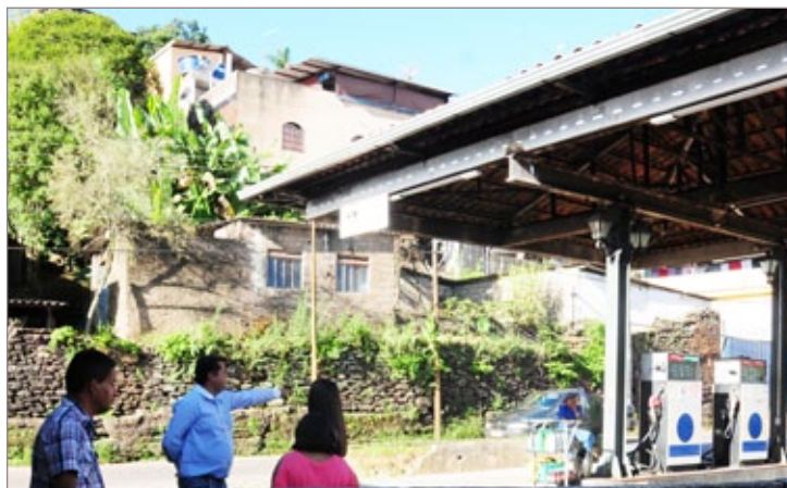
Câmara de Ouro Preto apura riscos com Auto Posto que podem afetar moradores da Rua Santa Rita