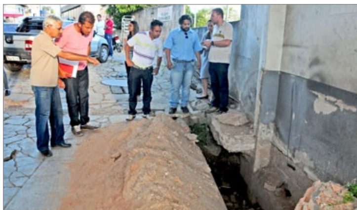
Vereadores averigam trincheira que dá acesso direto ao muro de arrimo comprometido