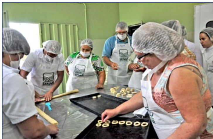
Curso de pães e bolos ensina novas técnicas

O curso, uma parceria do SENAR com a Prefeitura, aconteceu na Escola Municipal Natália Donada Melillo.