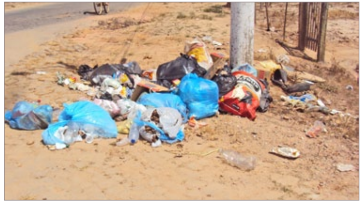
Lixo em Amarantina