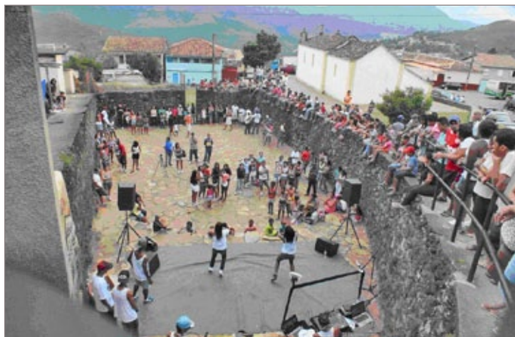
Andar com as próprias pernas tem sido a missão da Rede cultura de rua e cidadania que, mesmo sem apoio institucional, articula-se e realiza evento, já na terceira edição: é o "Fala Favela". O evento tem passagem pelos bairros Padre Faria, Antônio Dias, e Morro da Piedade, o mais recente. O objetivo é divulgar trabalhos com jovens dos bairros periféricos.

O público tem oportunidade única de conferir, até o dia 14 de abril próximo, com entrada franca, parte do acervo de um dos mais importantes grupos de teatro de bonecos do mundo, o mineiro Giramundo. Aberta, esta semana, no Memorial Minas Gerais Vale (Belo Horizonte), a exposição Teatro Móvel Giramundo reúne 33 bonecos do acervo do grupo, vídeo e painel de imagens, que relatam diferentes períodos do trabalho, desenvolvido pelo Giramundo, por meio do Teatro Móvel.