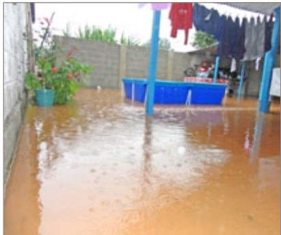
Cachoeira do Campo