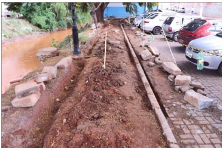
O processo de revitalização do Largo dos imigrantes já foi iniciado