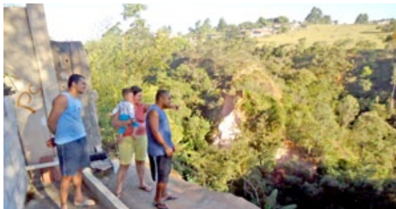
Crescimento contínuo de buraco tira o sossego de moradores do São Francisco