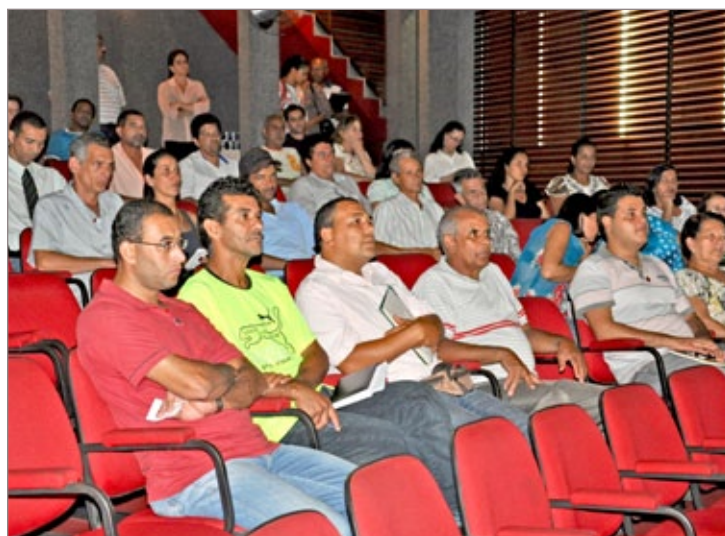
Representantes de 31 associações participaram da reunião

SPA Sorocaba: comprometimento com alegria, bem-estar, segurança e resultado.