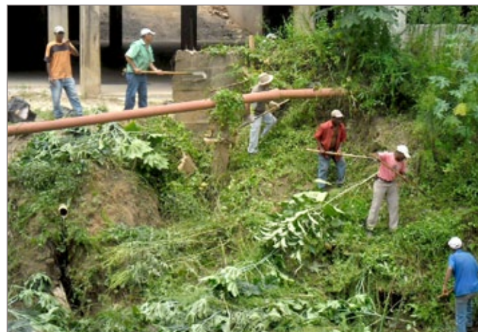
Capina na margem do Rio Itabirito