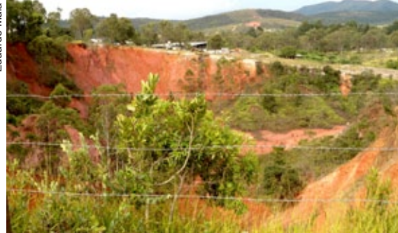
Vale do bairro Vila Alegre