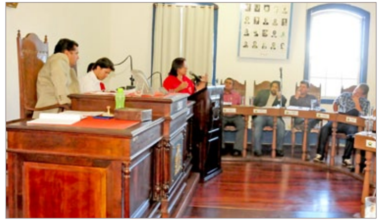
Sindicato cobra a aplicação do piso para o próximo pagamento