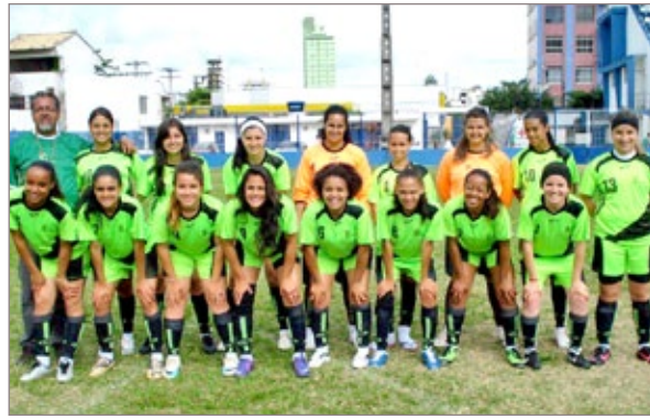
Equipe feminina de futebol

titutos Federais do Estado de Minas Gerais (JIFEM). O encontro foi realizado no IFMG-Campus São João Evangelista em maio deste ano e contou, ainda, com a participação dos campi Bambuí, Congonhas e Governador Valadares.