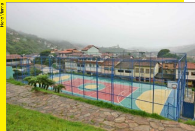
Bairro São Cristóvão acaba de receber uma nova quadra poliesportiva

Outros distritos de Ouro Preto também já foram beneficiados com espaços para prática de esportes implantados pela Prefeitura. Em Lavras Novas, foi erguida uma nova quadra; em Santa Rita de Ouro Preto e Cachoeira do Campo a população já pode desfrutar de ginásios poliesportivos cobertos, melhorando e incentivando o esporte nas duas regiões.