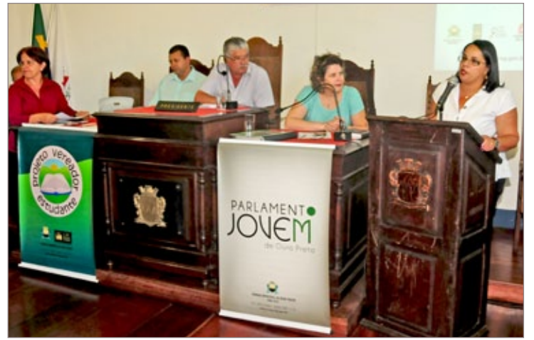
Encerramento e certificação dos Projetos Vereador Estudante 2011-2012 e Parlamento Jovem de Ouro Preto 2012 ocorreu durante Reunião Ordinária da Câmara

Esta foi a terceira edição do Parlamento Jovem de Minas realizada pela Câmara de Ouro Preto em parceria com a Escola do Legislativo da Assembleia Legislativa de Minas Gerais (ALMG) e com o Núcleo de Direitos Humanos da Ufop. O Projeto Vereador Estudante foi criado em 2005 pela Câmara Municipal e trabalha com estudantes do Ensino Fundamental das escolas de Ouro Preto e distritos.