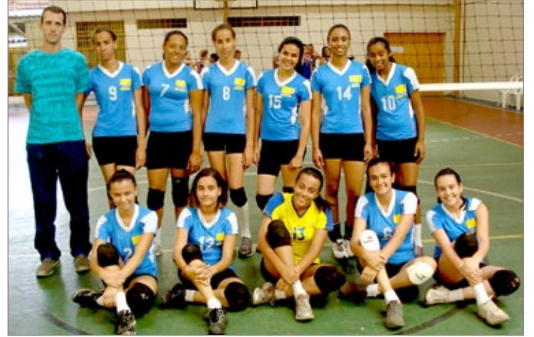
Atletas que disputaram a categoria Infante trouxeram o vice-campeonato para Itabirito

treinadas por profissionais da Prefeitura, que ensinam a parte técnica e tática da modalidade. “Neste torneio, a equipe recebeu total apoio da Prefeitura, desde a inscrição da equipe no torneio, o transporte, alimentação, além de treinamento durante todo o ano”, destaca o professor.