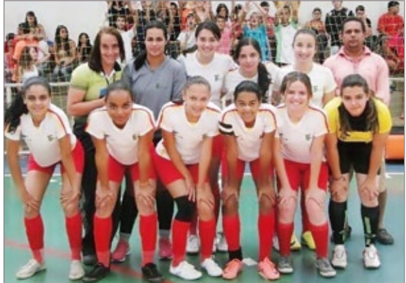
Equipe feminina de futsal