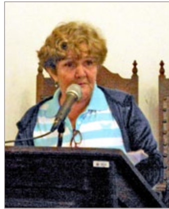
Segunda Gracinha, entidade aguarda com expectativa a construção do novo espaço

O projeto elaborado seguiu os trâmites necessários à sua aprovação. Antes da deliberação do Patrimônio, foi analisado pela Secretaria Municipal de Meio Ambiente. “Isso acontece com toda e qualquer planta