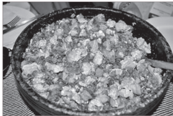
Saboroso feijão tropeiro será servido em tarde de atrações musicais e sorteio de brindes