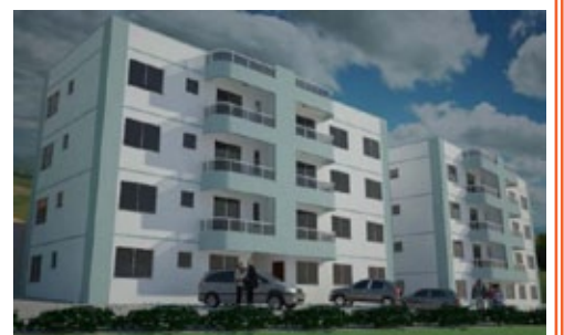
Nossa Senhora do Carmo