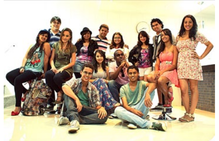
O Amor é Pop