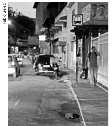
Ponto do Catete, próximo ao ICSA