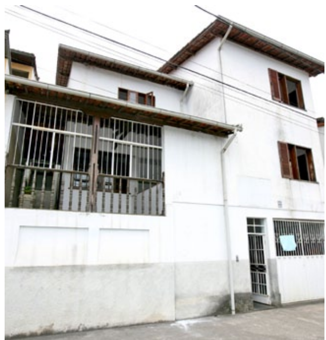
Creas, onde passa a funcionar a sede da Casa Lar

O Creas passa a atender no endereço: Vila São José, Rua Orlando Ramos, 55. por Thiago Guimarães