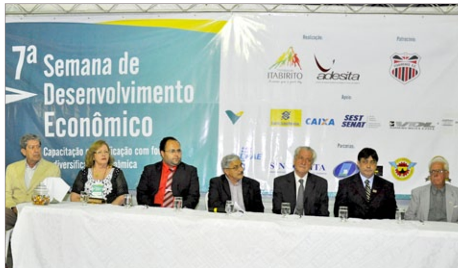
Evento tornou-se referência no segmento de feiras de negócios em Minas Gerais

A 8ª Semana de Desenvolvimento Econômico foi publicada oficialmente no calendário anual de Feiras e Exposições Industriais, Comerciais e de Serviços de Minas Gerais. É uma realização da Prefeitura de Itabirito, execução da Agência de Desenvolvimento Econômico e Social de Itabirito (Adesita) e conta com apoio de diversos parceiros. Os interessados já podem solicitar a reserva de estande. As inscrições para os minicursos e palestras começam a partir do dia 12. Informações na Adesita, à Rua Dr. Guilherme, nº 44, Centro - (31) 3563-1958; (31) 3563-1145.