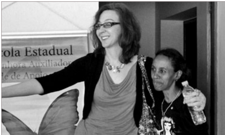
O ensino de disciplinas básicas, como o Português e a Matemática, não são a única oferta da Escola Estadual Nossa Senhora Auxiliadora, em Cachoeira do Campo. A iniciativa foi apresentada pela escola à consultora de educação básica norte-americana, Jennifer Babiracki, em visita realizada, na última quarta-feira, 1º de agosto. A escola ressalta a importância de um trabalho com projetos e eventos juntos à comunidade, tendo como apoio a Obra Nossa Senhora Auxiliadora. A visita ao estado faz parte do "Intercâmbio Brasil - Estados Unidos de Diretores Escolares" que é realizado pelo Conselho Nacional de Secretários de Educação (Consed) em parceria com a Embaixada Americana e os estados brasileiros.