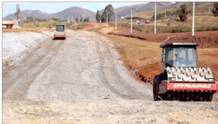
A área onde estava a Biocarbo teve que ser aterrada