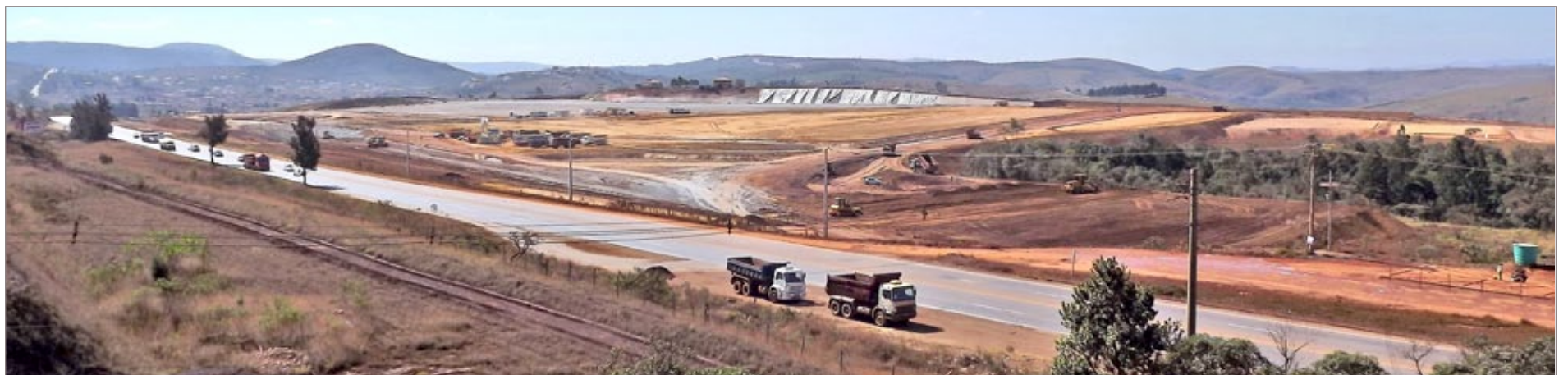
Terreno de 300 mil m 2 foi contrapartida da Prefeitura, para que houvesse a instalação da Coca-Cola, já que não houve renúncia fiscal