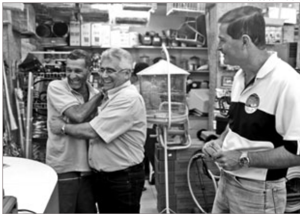
Candidatos em caminhada pelo comércio

Extrato de contrato: 346/2012. Pregão Presencial 108/2012. Aquisição de material escolar atendendo, atendendo à Secretaria Municipal de Educação. Valor: R$ 4.480,00. Data de assinatura: 31/07/2012. Vigência: 31/12/2012. Dotação: 02.006.001-12361.0010.2.063-33903000 02.006.001-12.361.00102.072-33903000-12.367.0012.075-3312.366.010.2076. Papelaria Áurea Ltda.