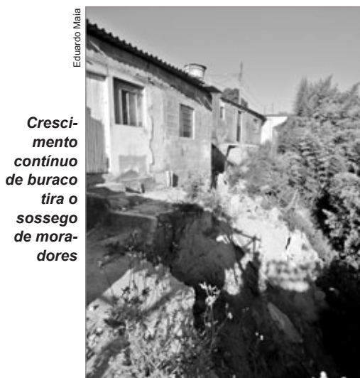
Crescimento contínuo de buraco tira o sossego de moradores

Uma voçoroca de aproximadamente 80m de profundidade ameaça moradores da Rua Randalfo de Lemos, no bairro São Francisco, distrito de Cachoeira do Campo. Em janeiro deste ano, no auge das chuvas, a situação chegou ao extremo, e famílias foram remanejadas. As pessoas que ficaram aguardam até hoje uma solução, uma vez que estudos geotécnicos preliminares já atestam os riscos, considerando-se que o buraco ameaça a rua em sua plenitude.