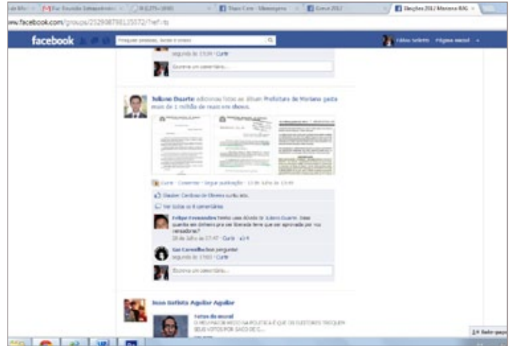
Postagem do vereador

No facebook , alguns cidadãos questionaram o vereador sobre a Câmara ter votado a favor de tal projeto. Em entrevista para redação de O LIBERAL, esclarece que não esteve em plenário no dia, mas comenta que, se estivesse presente, "teria votado contra". Ele ainda relata que a atual gestão da Prefeitura teria gasto "em torno de 2 milhões" em festivais, contando