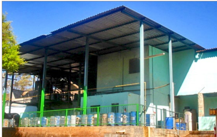
Para instalação da Coca-Cola Femsa, Biocarbo teve que deixar o local