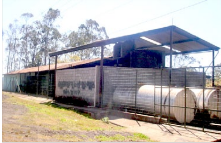
Biocarbo foi indenizada, para deixar o local

MM: Nenhuma empresa no mundo vai concordar em paralisar suas atividades somente pelo valor do terreno e das benfeitorias feitas, ainda mais no curtíssimo prazo que era exigido. A Biocarbo perdeu contratos internacionais, teve que dispensar seus funcionários, sair do local, deixando a área livre e desimpedida em curto prazo. A empresa terá ainda que procurar outro local e buscar a licença ambiental para voltar às suas atividades. Tudo custa tempo e dinheiro. Isso deve demorar cerca de 2 anos, em que a empresa deixará de ter faturamento. Segundo a Secretaria de Estado de Fazenda de Minas Gerais, a Biocarbo tinha um faturamento (VAF) de, no mínimo, R$ 1,5 milhão por ano, perdendo neste tempo mais de R$ 3 milhões. Foram cerca de R$ 800 mil só para cobrir as rescisões trabalhistas referentes à dispensa de funcionários, que a empresa teve que fazer, danos em máquinas e equipamentos, e os gastos com a saída da empresa do local. Somando-se o valor do terreno, das benfeitorias e dos prejuízos que a empresa teve, chegou-se a um acordo amigável de R$ 5,5 milhões.