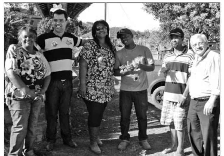
Candidatos foram bem recebidos pelos moradores do Córrego do Bação