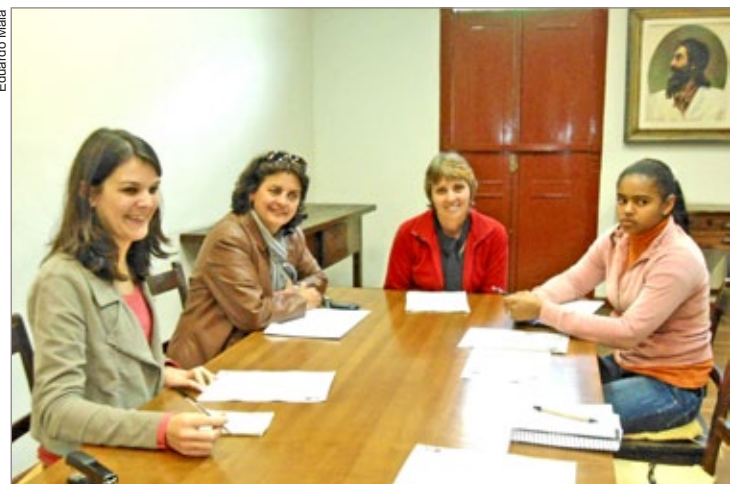
Lei que dispõe sobre a substituição das sacolas plásticas passa a valer a partir de 14 de setembro

Segundo a secretária, durante esse período há um inten-