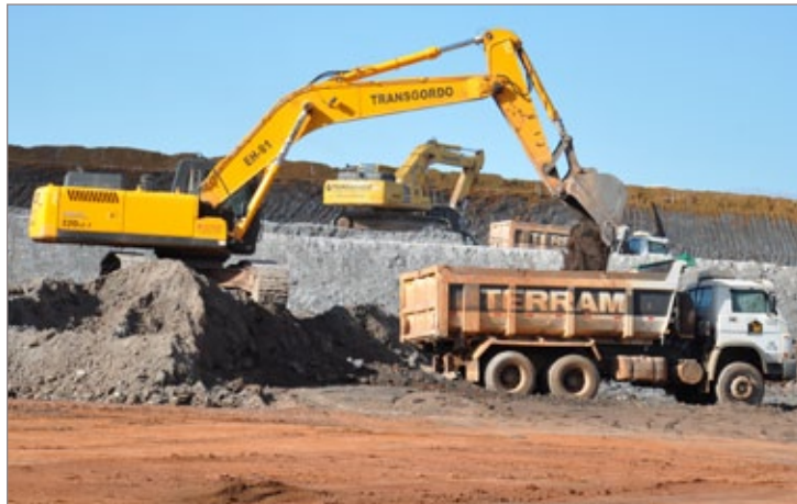
Máquinas já estão concluindo a terraplanagem do terreno de 300 mil m 2