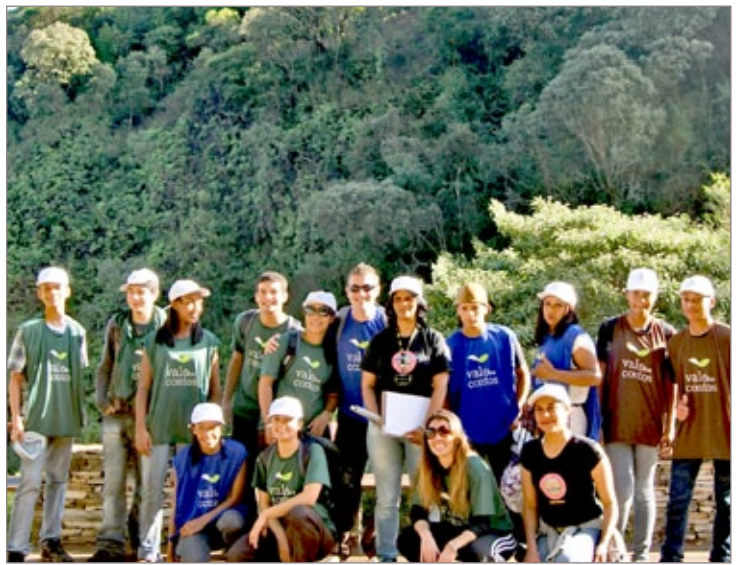
Vereadores Estudantes de Ouro Preto e equipe do Projeto de Educação Patrimonial do Parque Vale dos Contos

Atendimento ao Cidadão (CAC) da Câmara Municipal de Ouro Preto e tem como objetivo estimular a participação de alunos do Ensino Fundamental na prática legislativa do município e no exercício da cidadania.