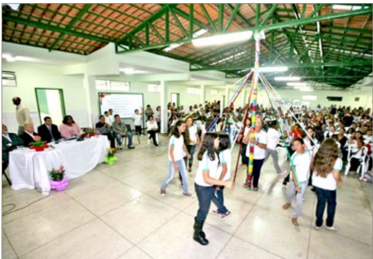
Escola Municipal Major Raimundo Felicíssimo depois de reforma e durante entrega

Ainda estão previstas outras obras de melhorias para a Escola. Serão realizadas a urbanização na entrada e a construção de uma quadra de esportes para os alunos. Ao lado da escola, está sendo construída a Creche Pró-infância em parceria com o Governo Federal.