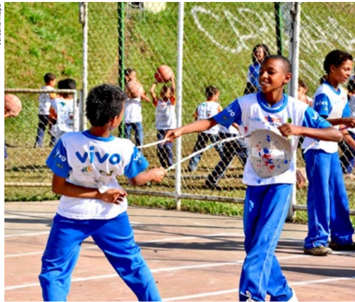
Três mil crianças e 150 professores foram atendidos em três dias de atividades esportivas e capacitação