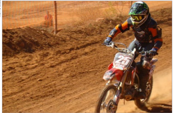
Copa de Motocross Cassios Racing reúne pilotos consagrados

A prova será disputada em 13 categorias, por pilotos de 4 a 70 anos. Para o sucesso do evento, a Prefeitura disponibilizará médicos, enfermeiros e uma ambulância. Para outras informações e inscrições, ligue (31) 9993-2993.