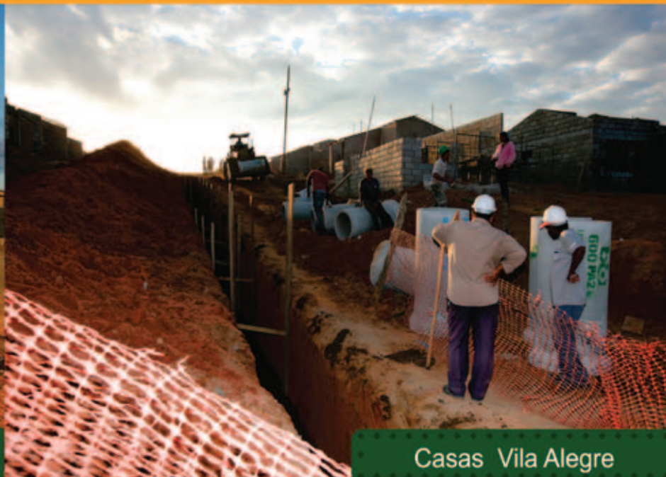
Casas Vila Alegre