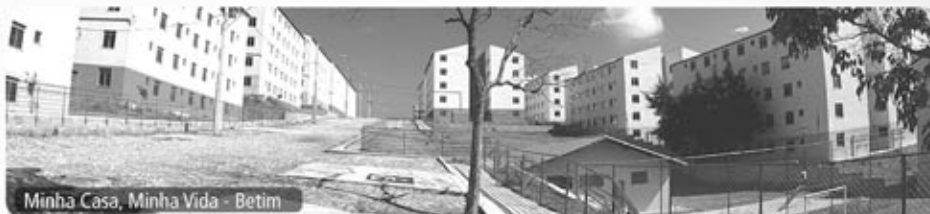
Minha Casa, Minha Vida - Betim