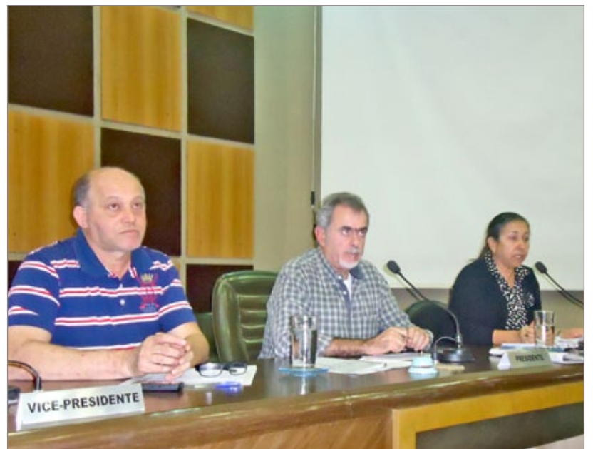
Vereadores discutiram problemas criados pelas terceirizadas da Vale