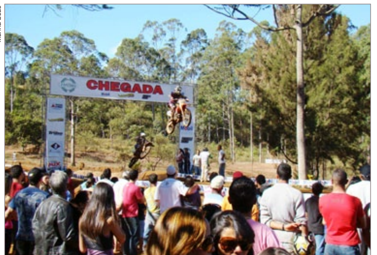
Mais de 200 atletas competem em 13 categorias