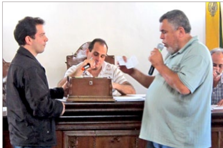
Por unanimidade, vereadores votam a favor do projeto