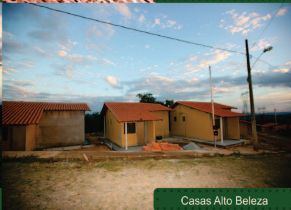
Casas Alto Beleza