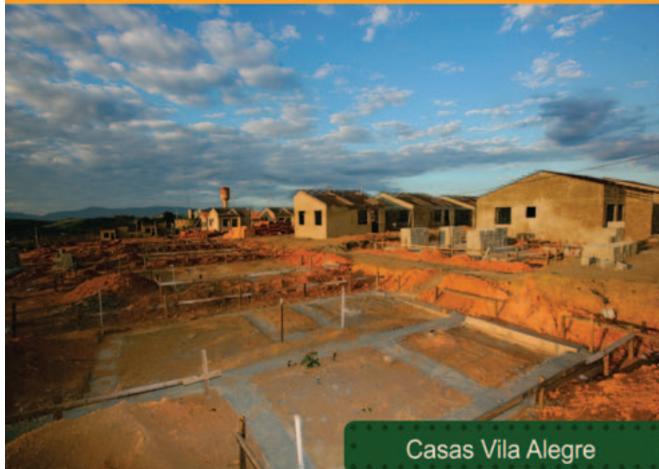
Casas Vila Alegre