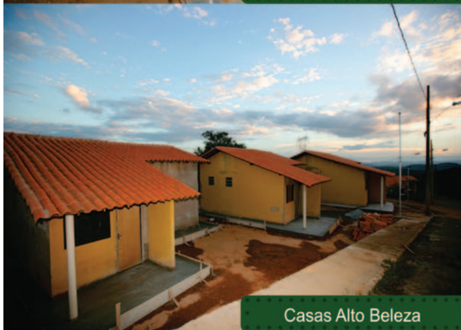
Casas Alto Beleza