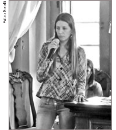
Servidora defende projeto

De acordo com o texto do projeto, ele “dispõe sobre a criação de fun-