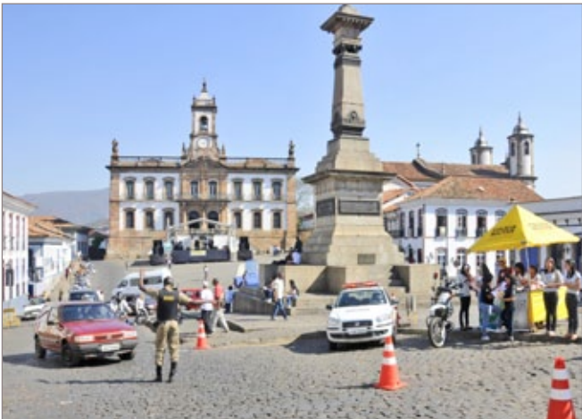
Cerca de 100 motoristas foram abordados durante a Blitz Educativa realizada em 2011 em frente à Câmara

O evento contará também com apresentações da Ginástica Olímpica da Fundação Aleijadinho e da Fanfarra da E. M. Professora Juventina Drummond. No hall da Câmara, haverá exposição dos trabalhos realizados pela Associação de Catadores de Materiais Recicláveis do Padre Faria. A Blitz terá o apoio da Polícia Militar, da Prefeitura de Ouro Preto, da Guarda Municipal e Ourotran, do Semae-OP e da Rádio Província FM.