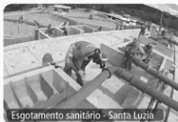
Esgotamento sanitário - Santa Luzia