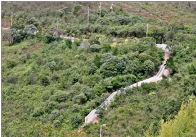
Vista da Rua Eli Coelho Neto, no bairro Novo Horizonte