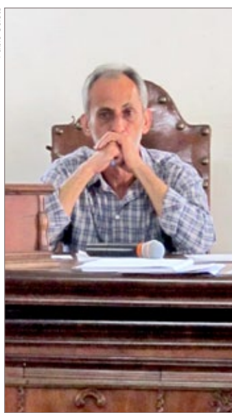
Votação secreta, na caixa, para derrubada de veto