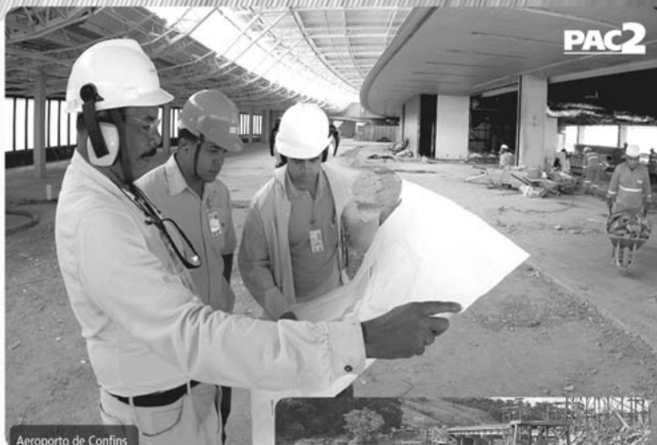
Aeroporto de Confins

O Minha Casa, Minha Vida vai realizar o sonho da casa própria de 158.190 famílias.