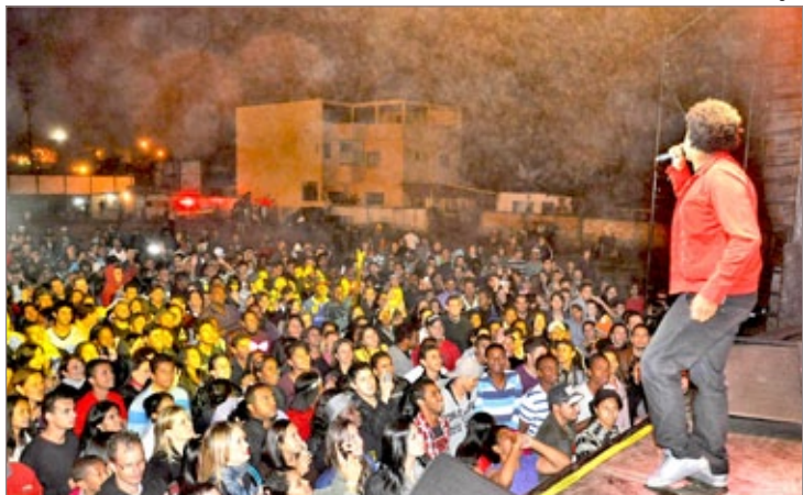
Público estava animado para participar da marcha para Jesus 2012