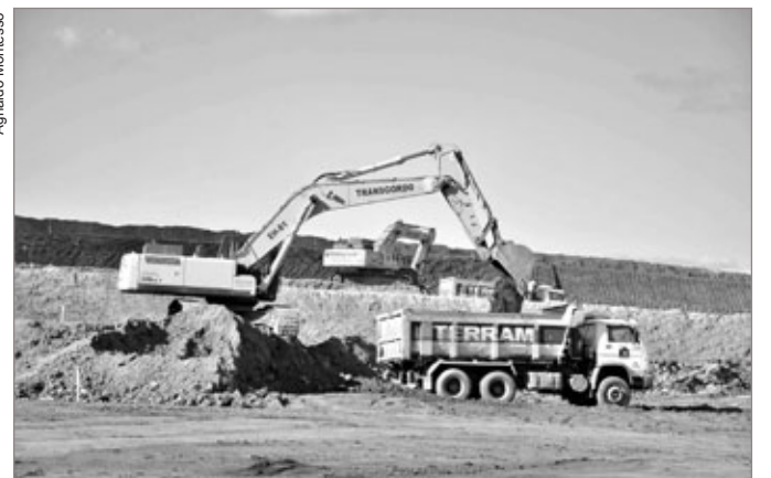
Vinda da maior franquia da Coca-Cola no mundo para Itabirito é garantia de emprego para a cidade