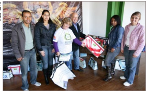
"A arte de reciclar transformando o lixo em luxo" expõe vassouras e bolsas confeccionadas pela Associação dos Catadores de Materiais Recicláveis no bairro Padre Faria