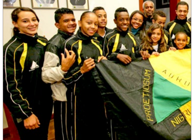
Alguns dos jovens participantes do programa Bolsa-Atleta