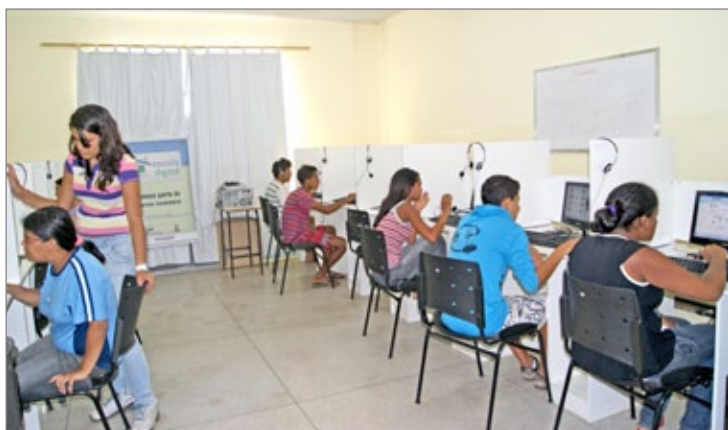
Laboratório de Informática da E. M. Dr. Alves de Brito, onde são ministradas as aulas do Projeto “Escola Digital”