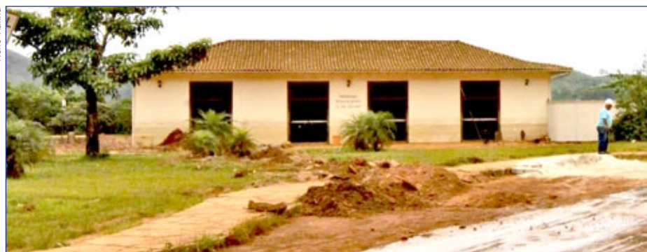
Terminal Rodoviário 8 de Julho antes e depois do desabamento decorrente das chuvas do início do ano