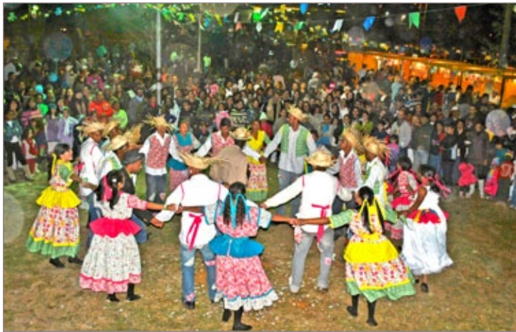
Em 2011, o Arraial da Cooperação reuniu público de aproximadamente duas mil pessoas