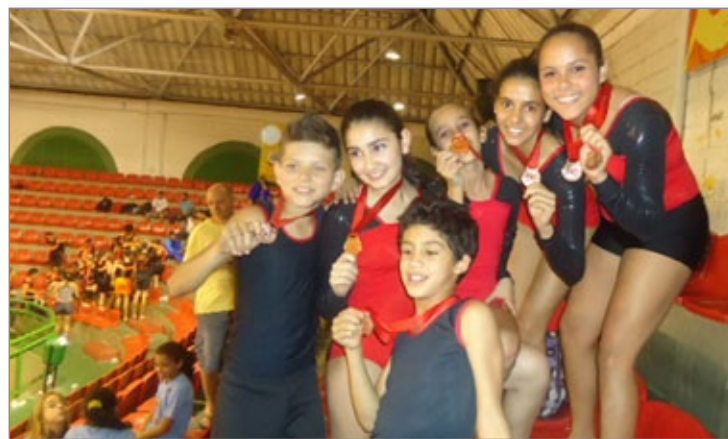
Atletas comemoram o bom resultado conquistado