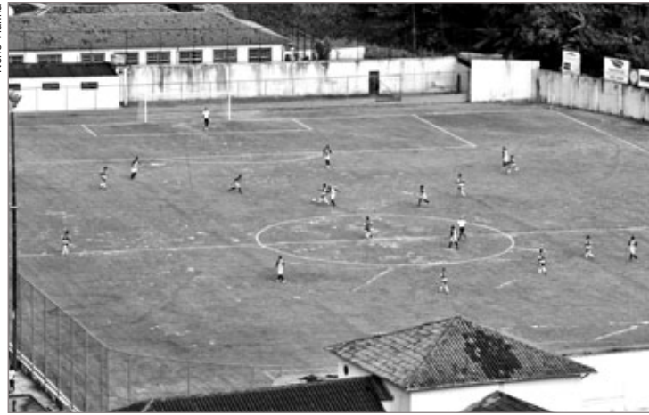
Jogos da Copa Estrada Real de Futebol Amador