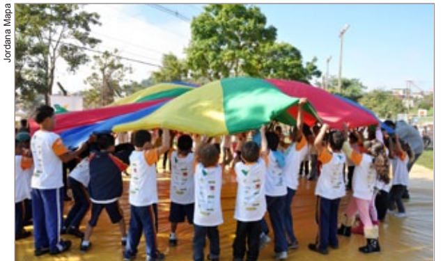
12 modalidades esportivas estão sendo praticadas pelos alunos