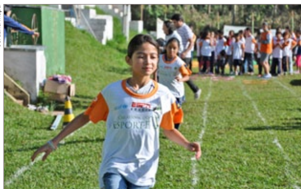
Crianças se divertiram com aulas de Basquete, Vôlei, Futsal, entre outras modalidades