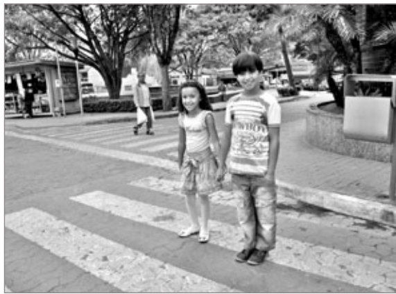
Campanha conscientiza pessoas de todas as idades