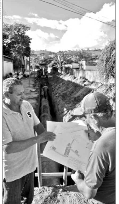
Obras de drenagem contemplam as ruas Cristovão Militão, Lígia Vidal e Dr. Baeta Costa