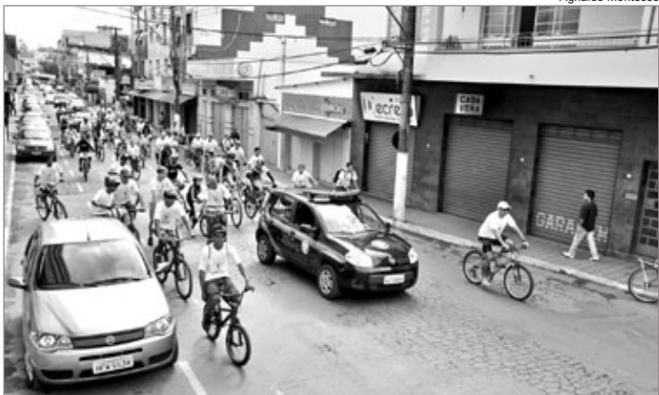
Passeio percorreu as ruas centrais de Itabirito